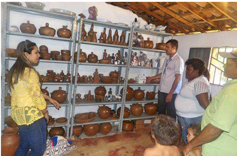
Imagem 8: Visita do SEBAE a comunidade “Os Rufinos” para verificar os resultados do curso de capacitação de artesanato em barro.

Este capítulo tem por objetivo traçar um olhar sobre a comunidade “Os Rufinos” levando em conta seus aspectos identitários, culturais e sociopolíticos, onde é possível perceber a marca sociocultural impressa nas práticas de seus moradores e daqueles que fazem presentes junto à comunidade tanto pelo seu grau de parentesco, quanto pela proximidade com as lutas sociais da mesma. Neste sentido, destacaremos os aspectos identitários sobre a identidade quilombola em Pombal-PB relacionando com a cultura no geral para a compreensão das práticas socioculturais identificadas no contexto que pretendemos abordar sobre “Os Rufinos”.