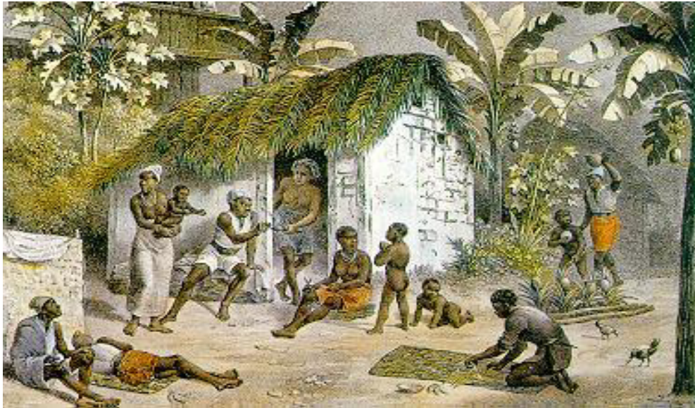
Imagem I: Habitação de Negros. Johann Moritz Rugendas. Disponível em: https://pt.wikipedia.org/wiki/Johann_Moritz_Rugendas . Acessado em: 11/01/2018.

Na imagem acima do pintor Johann Moritz Rugendas, ele retrata o cotidiano de um quilombo, onde podemos observar que, os aquilombados eram um grupo bastante diversificado, ou seja, constituídos por crianças, jovens, adultos e pessoas idosas. Observando bem a pintura, como alguns autores denominavam como era a forma de organização e os motivos aos quais levavam os negros a fugirem e conseqüentemente formavam os quilombos, a obra de Rugendas detalha como os ex escravos se organizam, com liberdade, autonomia, onde as crianças brincam pacificamente, os adultos tem o direito de descansar e o trabalho coletivo em prol da sobrevivência do grupo, sem marcas do sistema escravista ao qual eram submetidos nas casas e fazendas dos senhores escravocratas.