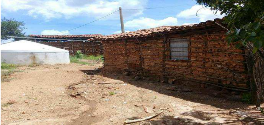
Imagem 5: Residência da comunidade.