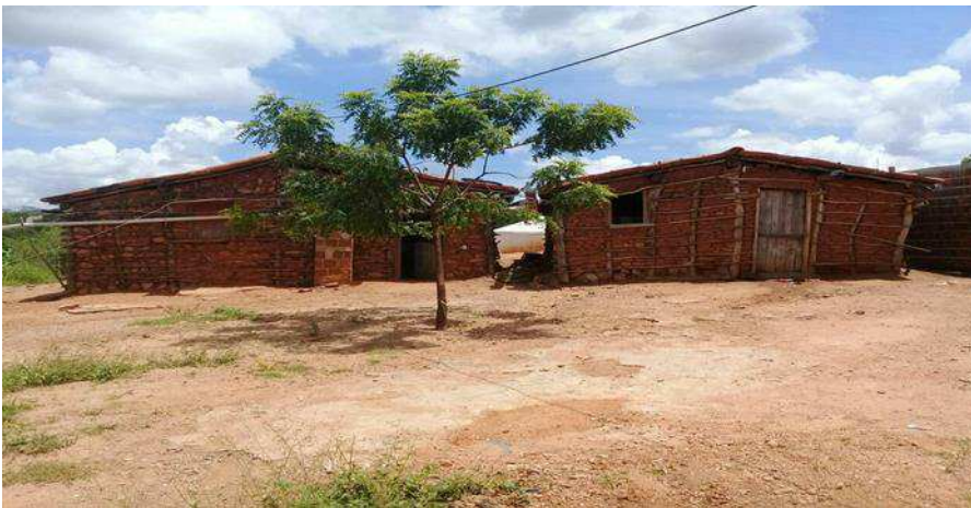
Imagem 6: Residência da comunidade (Acervo; Joana Darc Sales Oliveira).

Nas fotografias I e II, podemos observar políticas públicas que já foram executadas e trouxeram um conforto e segurança habitacional para algumas famílias da comunidade quilombola remanescente “Os Rufinos”, com a substituição de casas de taipa por alvenaria. Esse projeto foi executado no ano de 2013, tendo a FUNASA como órgão regulador e fiscalizador, em parceria com a Prefeitura Municipal de Pombal-PB, que ficou responsável pela execução do projeto. É importante ressaltar outra política pública importantíssima que já proporcionou melhorias para dezenas de famílias da comunidade “Os Rufinos”, a construção de cisternas, reservatório hídrico, onde capta água das chuvas, assim possibilitando um abastecimento de água potável, tendo em vista que, mesmo a comunidade sendo banhada pelas águas do Rio Piranhas-Piancó, mas não há água tratada, potável para o consumo humano.