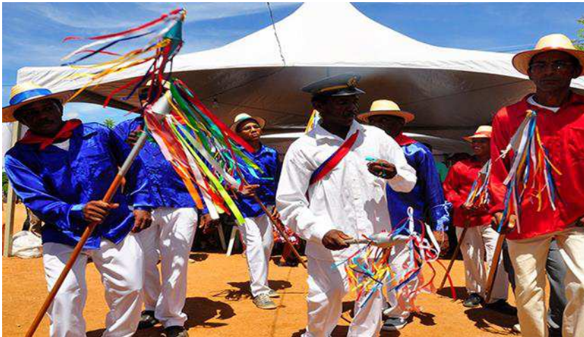
Imagem 9: Fotografia de uma apresentação do grupo folclórico “Os Pontões” (16/04/2014)