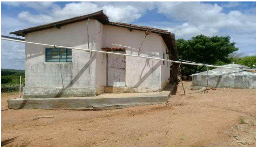
Imagem 4: Residência da comunidade.