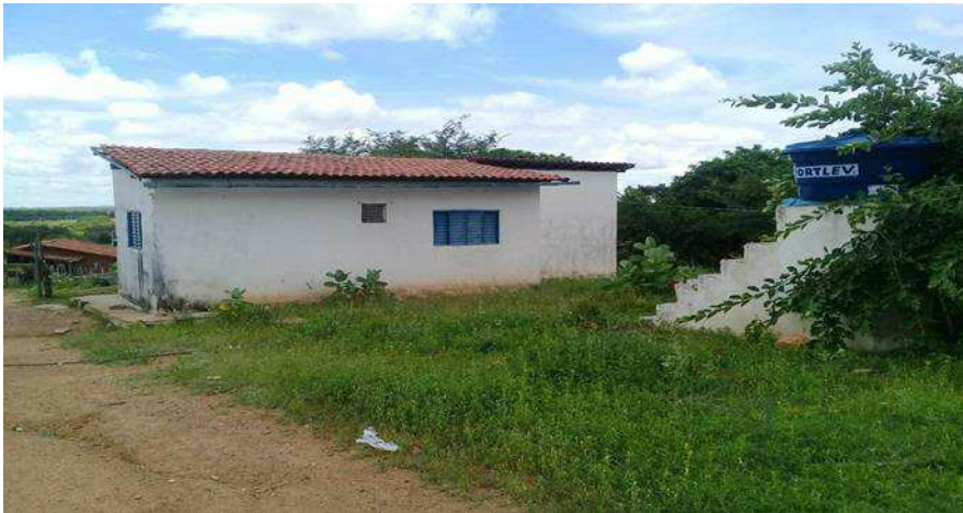
Imagem 3: Residência da comunidade.

Todavia, os avanços e conquistas já são vistos como mencionados e que proporcionam um melhor conforto e dignidade para os quilombolas moradores desta comunidade. Abaixo seguem algumas imagens de casa de alvenaria construídas em ações do Governo Federal voltadas as comunidades: