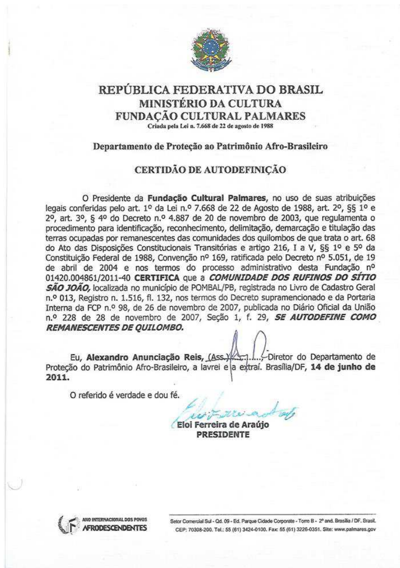
Imagem 7: Documento de Reconhecimento da Comunidade quilombola “Os Rufinos”.

Tais benefícios foram implantados na comunidade a partir da certificação que a mesma recebeu e da tramitação dos contatos que a comunidade, de forma organizada realizou dentro da luta que a ela compete como autoreconhecidora dos seus próprios direitos. Abaixo verifica-se o documento da Fundação Palmares: