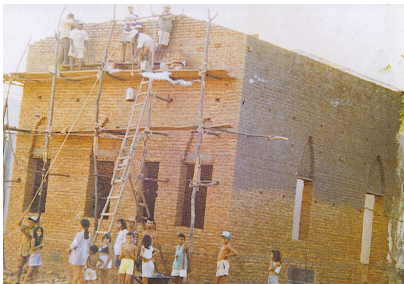
Foto 1: Padre Nicolau Leite Foto 2: Construção da Capela Santo Afonso