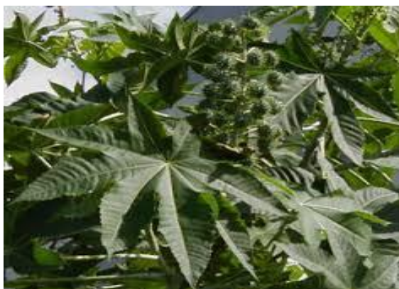
Figura 1: Planta que deu origem ao nome do município

A origem do nome Carrapateira é devido a uma planta da família Euforbiácea, espécie Ricinuscommunis L. originária da Etiópia (África), conhecida popularmente como: carrapateira, mamoneira, palma de cristo, que havia em abundância na região, na época de seu desbravamento.