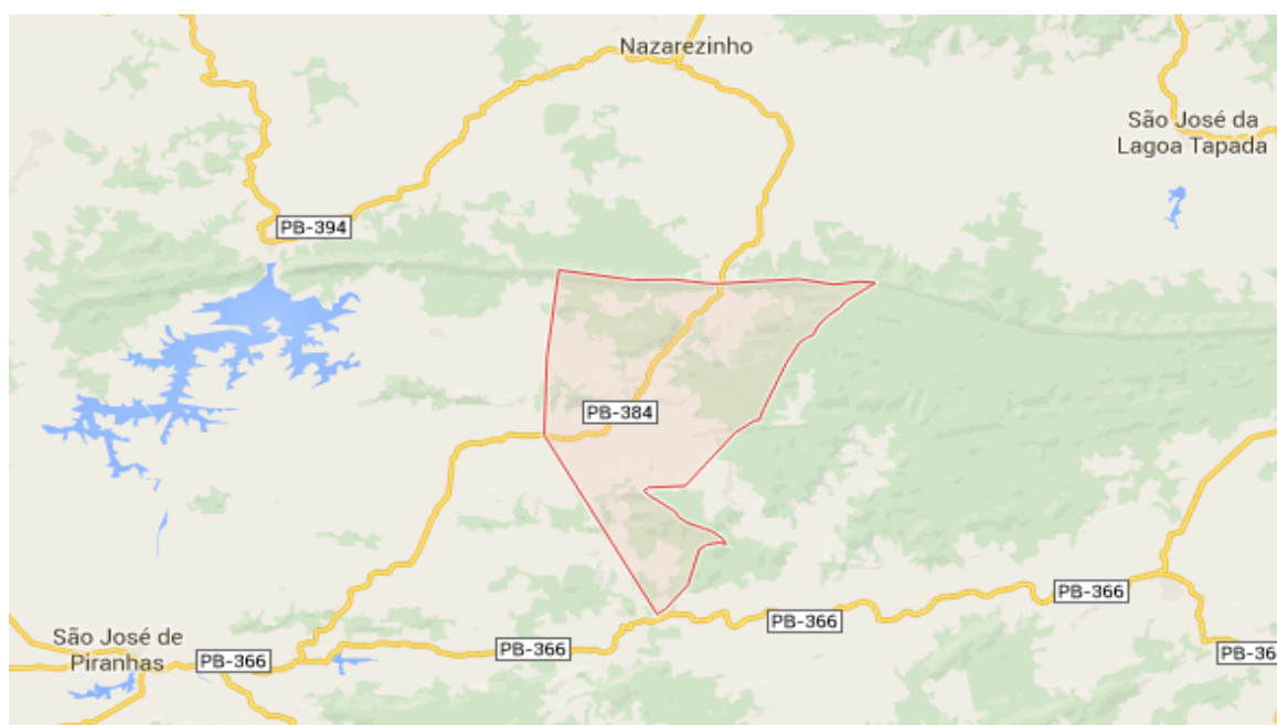
Figura 2: Mapa de localização do município de Carrapateira/PB

O município de Carrapateira, está localizado na mesorregião do Sertão Paraibano, na micro região de Cajazeiras, distanciando-se da Capital do Estado em 469,5 km. Possui uma área de 72,78 km 2 representando 0.1289% do Estado, 0.0047% da Região e 0.0009% de todo o território brasileiro, gerando assim uma densidade demográfica de 32,8 hab./km 2 . A altitude da sede é de 372 m. Limita-se a Oeste e Sudoeste com São José de Piranhas, ficando a uma distancia de 25 km da sede, a norte Nazarezinho, cuja distância até a sede é de 18 km e a Leste e Sudeste Aguiar, sendo distantes 30 km da sede. A “sede municipal apresenta coordenadas geográficas de 38° 20’ 38” longitude oeste e 07° 02’ 20” de latitude sul.