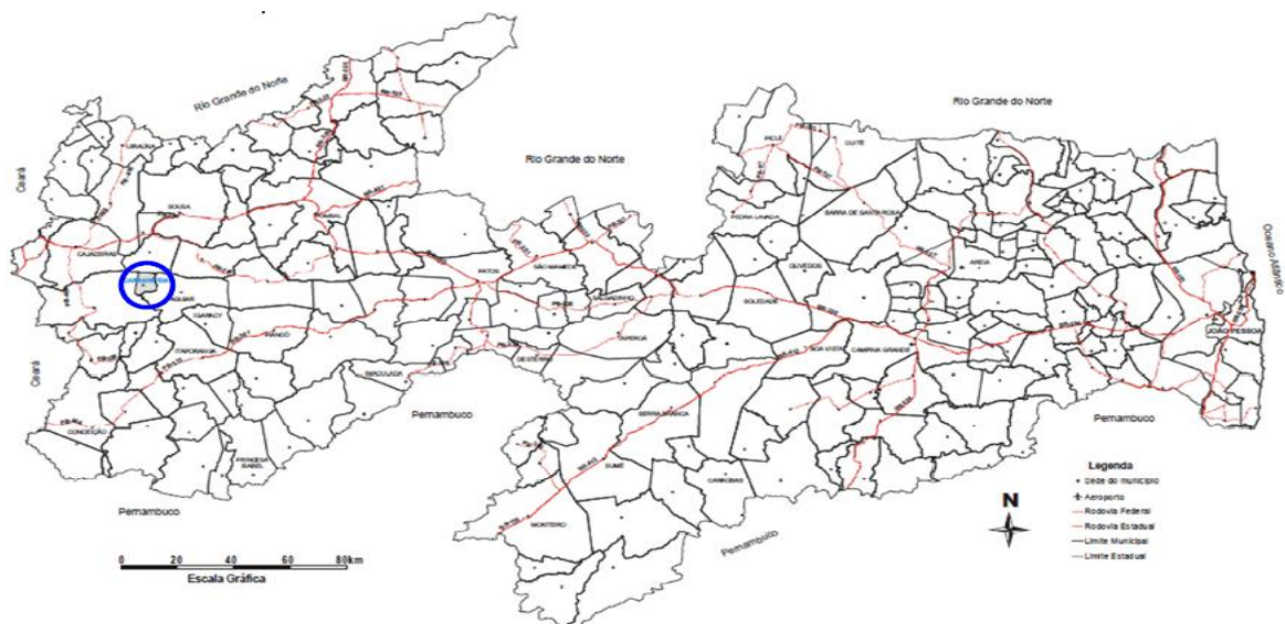
Figura3: Mapa de acesso rodoviário