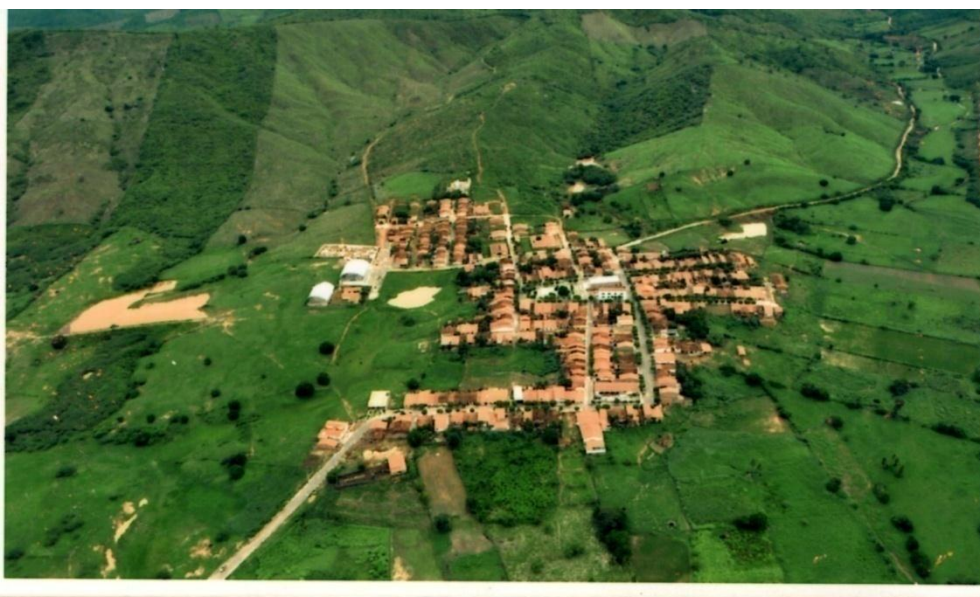
Foto 3: Município de Carrapateira – PB

O Sítio Carrapateira é elevado à categoria de vila pelo então prefeito de São José de Piranhas Malaquias Barbosa, ocasião esta da construção das primeiras ruas em 01 de fevereiro de 1937. Sua evolução como povoada foi lenta, justificada pela sua localização entre serras de difícil acesso. Por isso, passou muitos anos para encontrar seu progresso. Atualmente a estrada que dar acesso ao município está asfaltada, mas isso não influenciou no desenvolvimento econômico e no desenvolvimento urbano, só trouxe melhorias para o deslocamento aos municípios circunvizinhos.