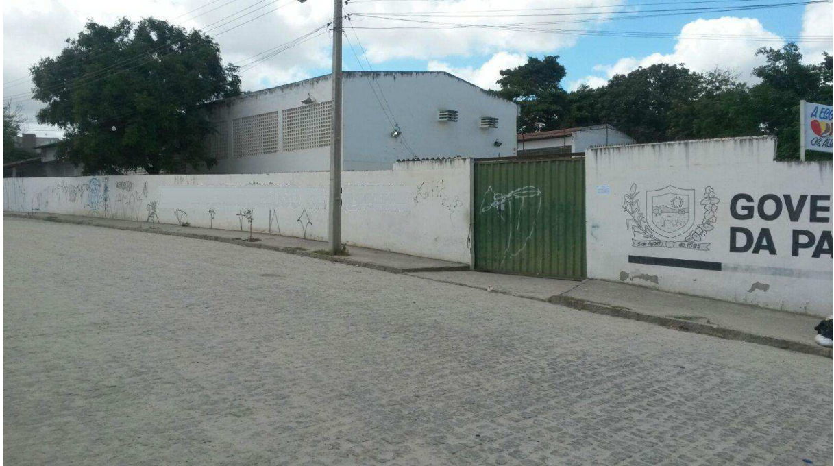
Imagem 1 – Entrada principal Escola Estadual Rio Amazonas. Foto: Alessandra Silva - 2015

De acordo com as informações registradas nos documentos da escola, sua fundação ocorreu em 1965, inicialmente a escola possuía apenas com 04 (quatro) turmas, era denominada Escola Estadual de 1º e 2º grau e funcionava como sucursal de outra Escola Estadual localizada em outro bairro da cidade.