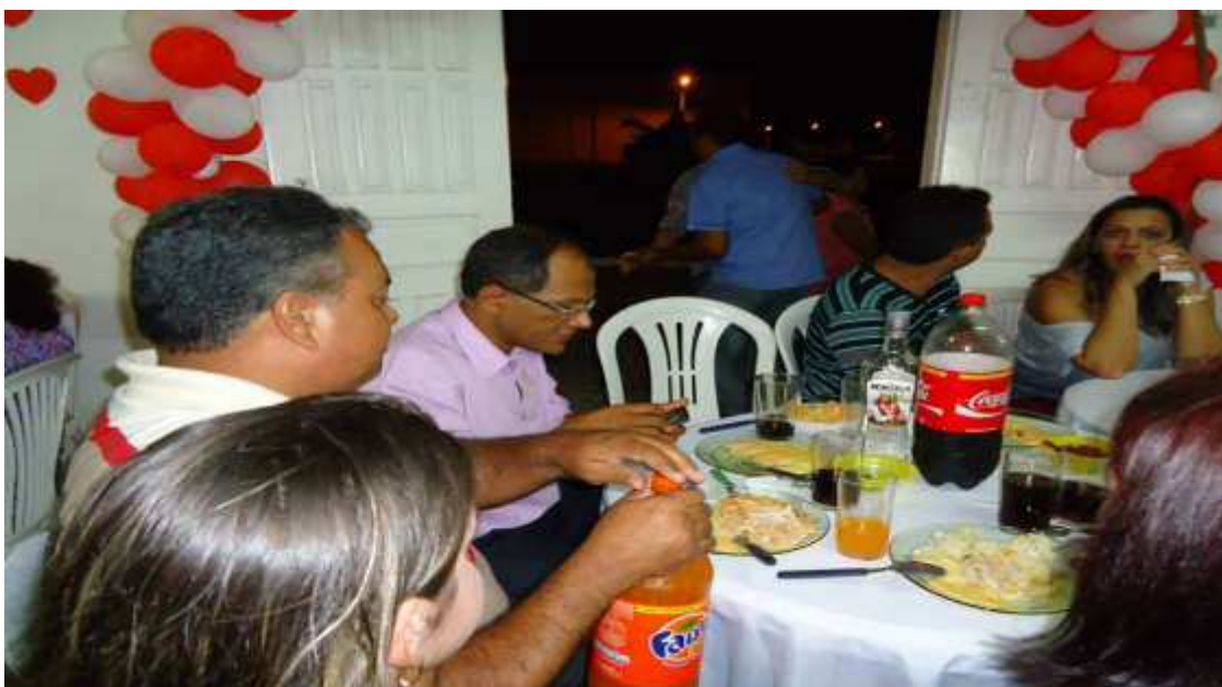
Figura 19: Políticos presente no jantar em comemoração ao Dia das Mães na Associação de Moradores do bairro Ferraz.

Estes encontros também podem ser realizados nas entidades, no entanto fora do “tempo da política”. Um dos eventos que presenciamos foi um jantar em comemoração ao Dia das Mães na Associação de Moradores do Ferraz.