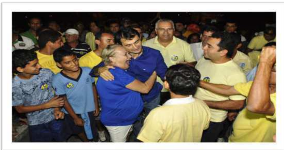
Figura 13: Presença do candidato a prefeito e vereadores na caminhada no bairro Ferraz – Campanha de 2012.

Elas são caracterizadas pela presença do candidato na frente acenando e cumprimentando, o líder do seu lado junto com alguns assessores, seguidos de mais membros, selecionados pelo líder, para entregar santinhos, bandeiras e adesivos nas casas.