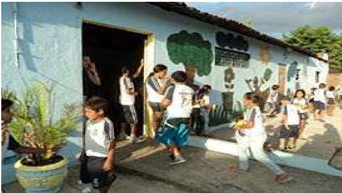
Figura 1: Sede da SAB do Belo Monte desenvolvendo atividade em parceria com a creche municipal do bairro.

equidade social para todos os subúrbios desde o Bairro das Nações até a recém nascida Vila dos Teimosos em Bodocongó. Campina Grande conseguiu muitos benefícios, porque os membros das SABs estavam sempre exigindo, a quem de direito.