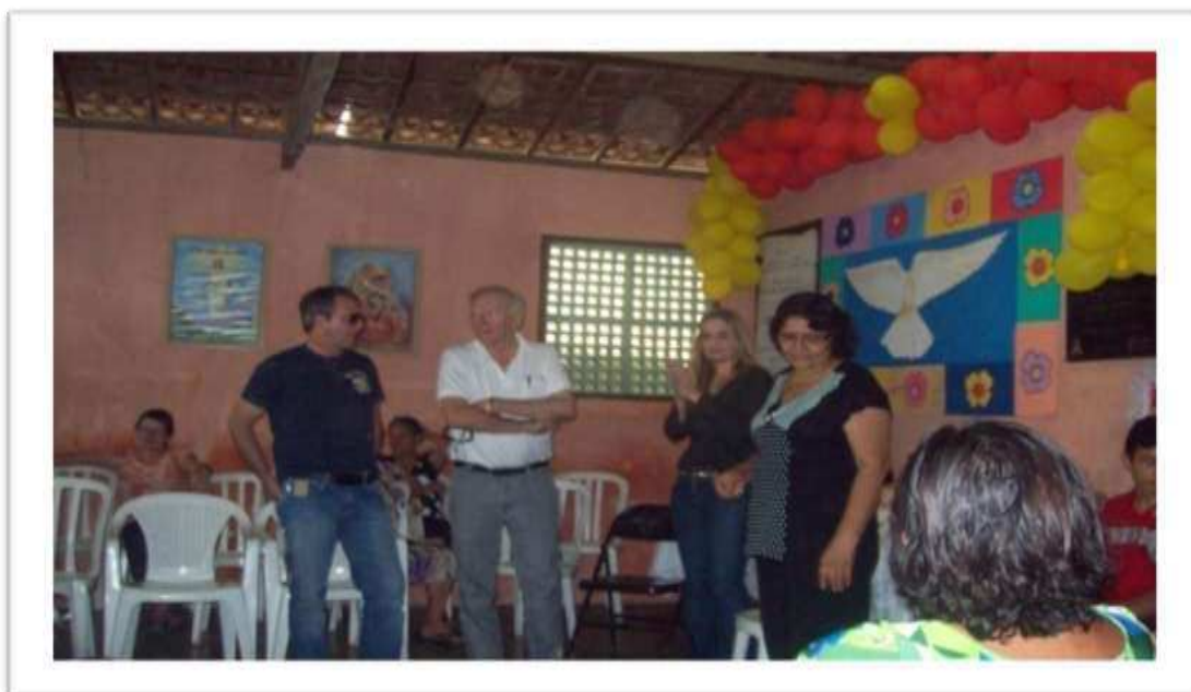
Figura 9: Visita de políticos ao Clube de Mães Ferraz.