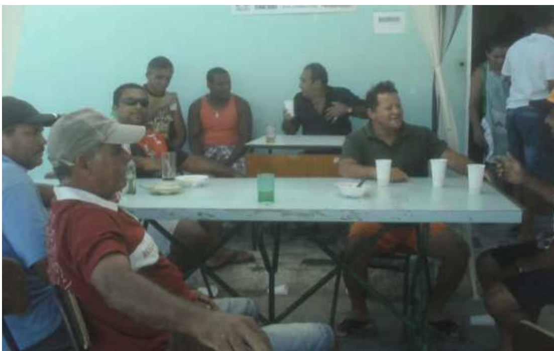
Figura 18: Feijoada do racha de domingo no Bairro Belo Monte.