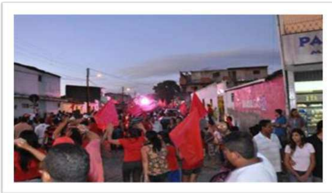
Figura 12: Presença do candidato a prefeito e vereadores na caminhada no bairro Ferraz – Campanha de 2012.

Elas são caracterizadas pela presença do candidato na frente acenando e cumprimentando, o líder do seu lado junto com alguns assessores, seguidos de mais membros, selecionados pelo líder, para entregar santinhos, bandeiras e adesivos nas casas.