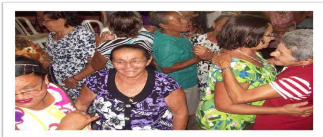
Figura 8: Sócias do Clube de Mães Ferraz dançando.