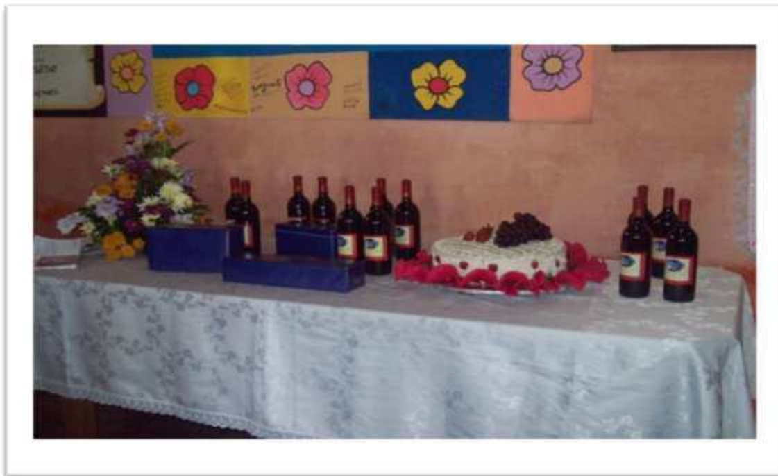
Figura 7: Mesa em Comemoração ao Dia das Mães no Clube de Mães do bairro Ferraz.

Aproximadamente às 15:30h a Presidente do Clube deu início ao encontro agradecendo a presença e participação e logo após abrindo o espaço para quem quisesse falar sobre o dia das Mães. Três sócias se pronunciaram e cada uma delas leu uma mensagem e falou sobre a maternidade. Neste ínterim, chegam assessores de políticos, os que foram convidados através dos ofícios e líderes, políticos e assessores traçam estratégias para oferecer a melhor visibilidade ao político e a liderança que o apoia.