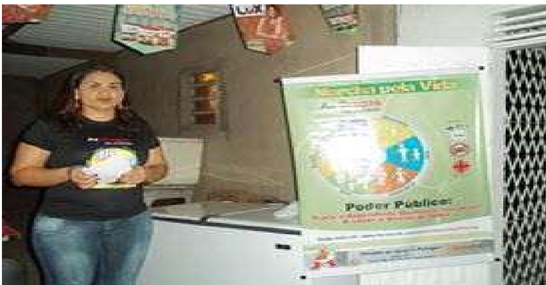
Figura 2: Curso de formação para diretoria da Associação de Moradores do bairro Ferraz, organizada pelo movimento anti drogas Marcha pela vida.

O movimento comunitário envolve também outras entidades como o Clube de Mães e outros agrupamentos reivindicatórios da cidade. Os Clubes de Mães são