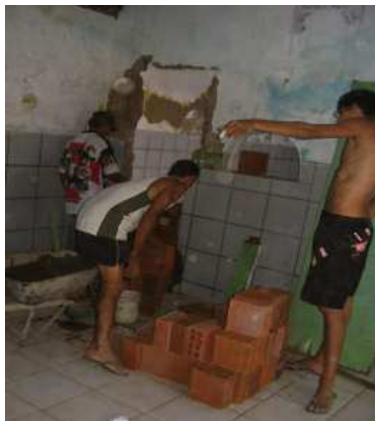
Figura 5: Reforma da SAB do Belo Monte através de multirão realizados pelos moradores do bairro.

Dália ao narrar como era antes da construção da sede do Clube de Mães Ferraz, expõe que as reuniões aconteceram por muito tempo nas casas das mulheres ou no salão da igreja. Mas quando houve uma mudança na igreja, não puderam se reunir mais lá e “muitas mulheres desistiram do grupo”. A solução encontrada para reverter tal situação de apatia, foi, segundo as palavras de nossa depoente,