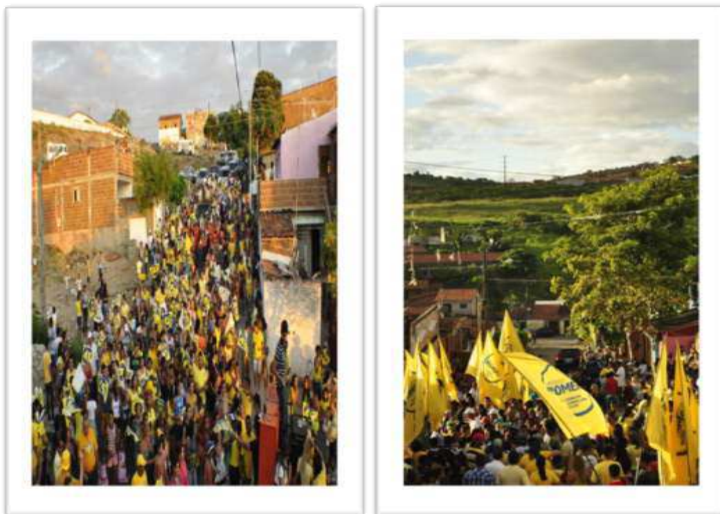
Figura 14 e 15: Caminhadas no bairro Belo Monte – Campanha de 2012

Numa cidade, do porte de Campina Grande, à participação das lideranças no bairro objetiva cumprir o papel de representantes do candidato, já que é praticamente impossível a presença do candidato em todos os bairros. Sendo assim, é primordial a ação dos líderes comunitários na tarefa do “corpo a corpo” ou “campanha de rua” (SCOTTO, 1996) nos bairros periféricos analisados, uma vez que foram extremamente intensas e diversificadas as atividades de campanha, o que realmente exigiu destes enorme disposição para o trabalho e dedicação para o cumprimento das atividades previstas. Scotto (1996, p. 166) define a campanha de rua como “uma série de atividades cujo elemento comum parece vincular-se a uma tentativa dos candidatos de estabelecer uma aproximação e um contato mais direto com seus potenciais eleitores”.