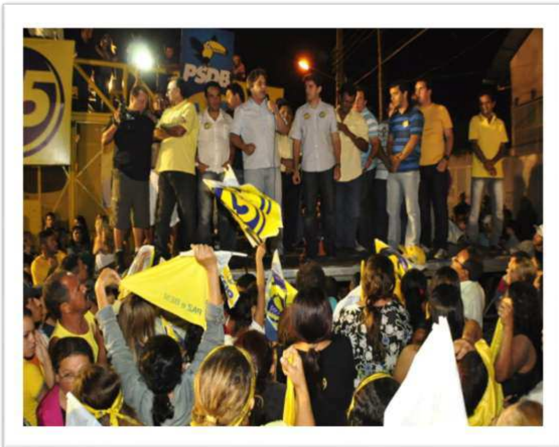
Figura 17: Comício no bairro Ferraz na campanha de 2012.

Observamos também que diferente de alguns trabalhos etnográficos para quem os comícios pareciam não ter mais importância e significado com relação a imagem produzida em outros eventos, pois já não se valorizava tanto o discurso mas, a imagem do candidato, para o líder Gerânio a visão é diferenciada: