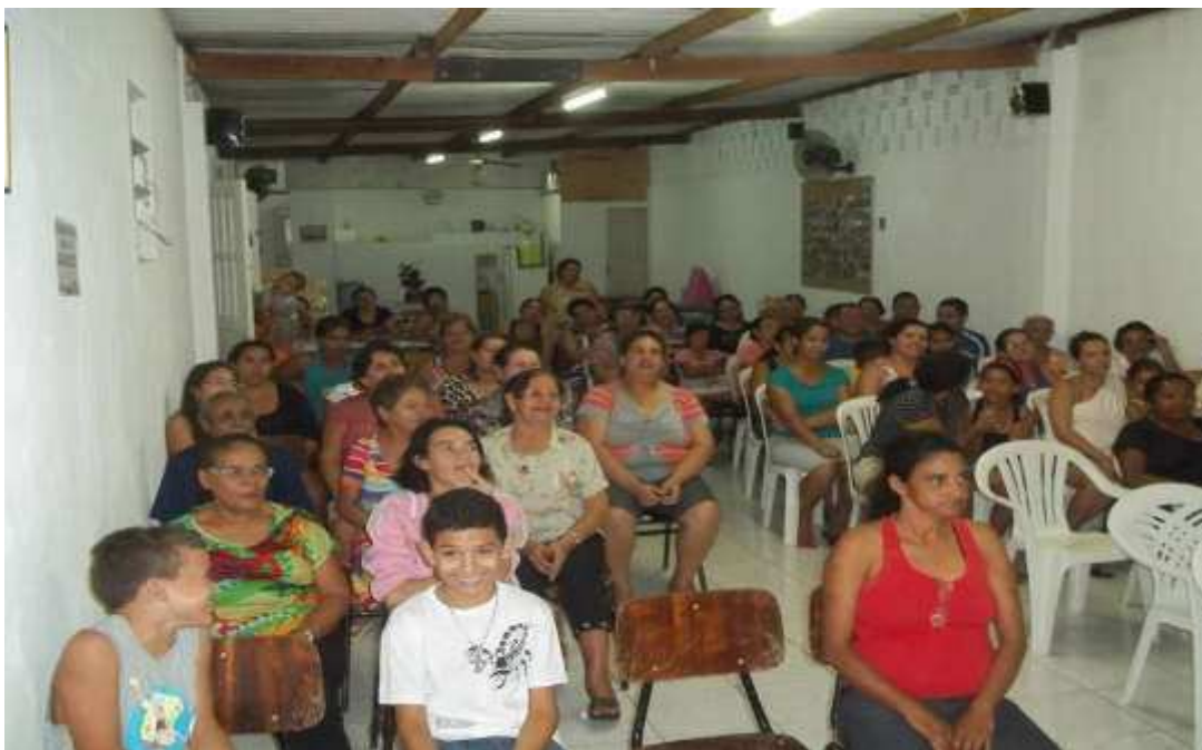
Figura 6: Reunião de sócios da Associação de Moradores do Ferraz.

Diante destas disputas e oposições entre as SABs e um novo grupo de moradores que estavam se unindo, decidiram formar a Associação de Moradores do Ferraz, originando assim uma nova entidade. Através de outro candidato conseguiram alugar uma residência que se tornou sede. Com a mudança de governo, entraram em contato com outros políticos e através de uma reivindicação para abertura de uma rua sem saída, também conseguiram a autorização para construção da sede neste novo espaço.