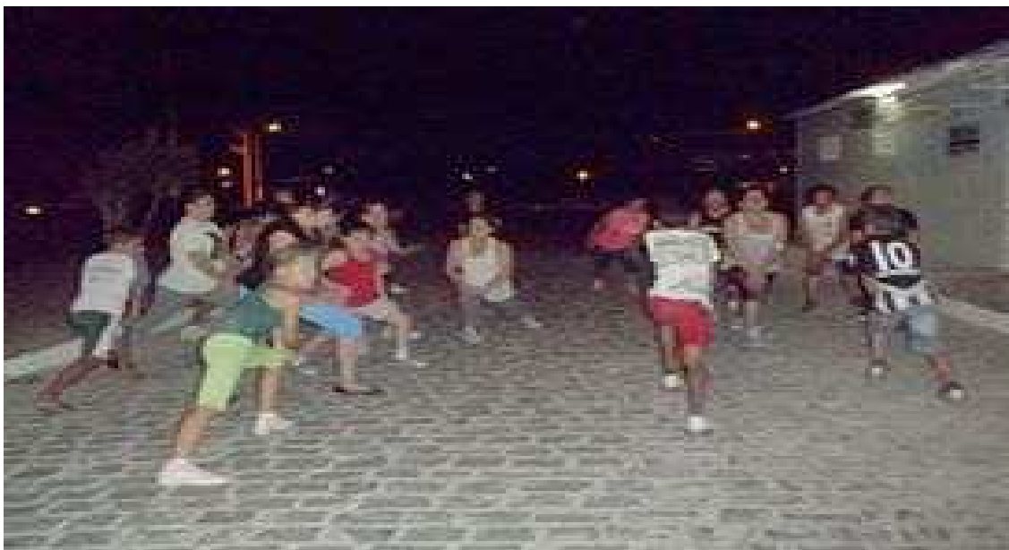
Figura 3: Aula voluntária de aeróbica oferecida por estudantes estagiários do curso de Educação Física – UEPB no Clube de Mães do Ferraz.

compostos por mulheres que lutam pelas participações femininas nas mais diferentes esferas da sociedade. Além disso, tem trazido as mulheres destes bairros aprendizados em artes culinárias, beleza, artesanato, atividades físicas, dentre outros projetos específicos a cada bairro. Tardes de atividades e fins de semana de lazer também fazem parte da programação destas entidades.