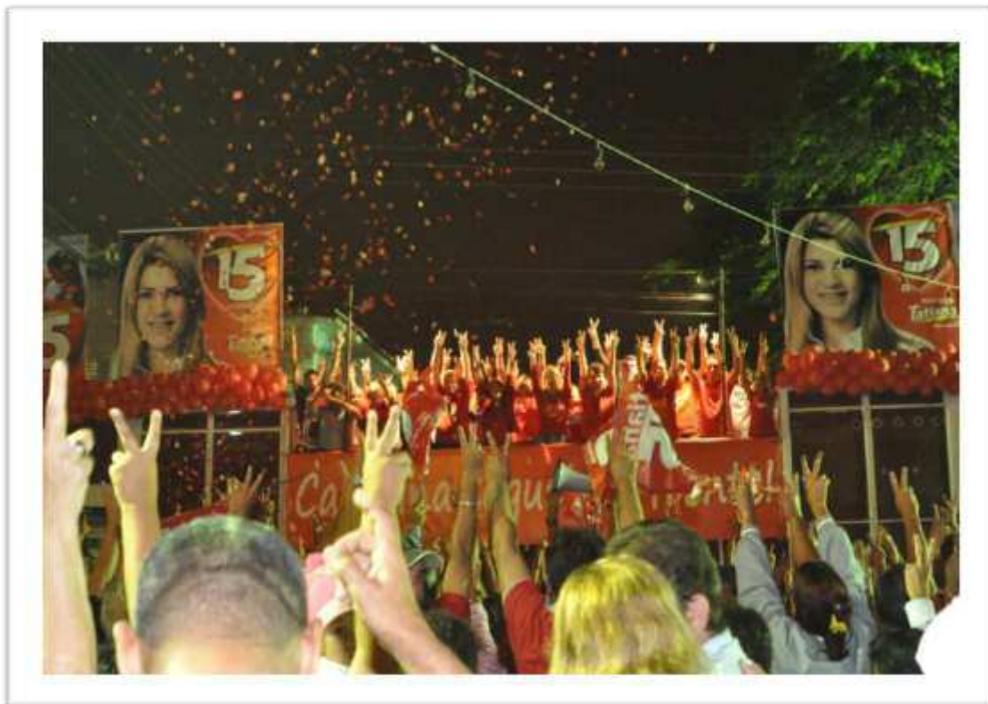
Figura 16: Comício realizado no Bairro vizinho ao Belo Monte na Campanha de 2012.

A participação dos líderes em comícios extrapola os limites do próprio bairro, nos relata Cravo: