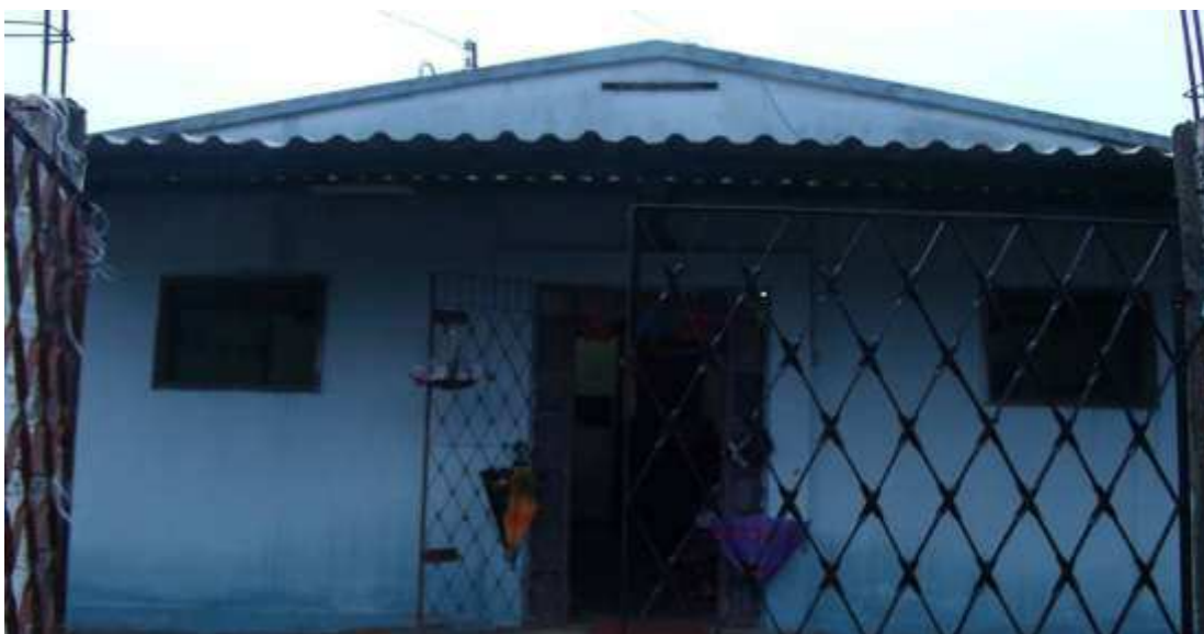
Figura 4: Fachada da sede do Clube de Mães e SAB do bairro Ferraz.

Ao defender que “o clube ta lá lembrando sempre” a líder reafirma o papel da entidade em relação à luta pelos direitos da mulher, ou seja, a existência da entidade e suas atividades “por si só”, já é resultado desta luta. Bem como ela traz à tona a questão da inferioridade feminina diante da superioridade dos seus companheiros, impossibilitando a participação de muitas mulheres em grupos como estes que discutem e orientam as mulheres a buscar seus direitos e rever seu papel diante da família e da sociedade.