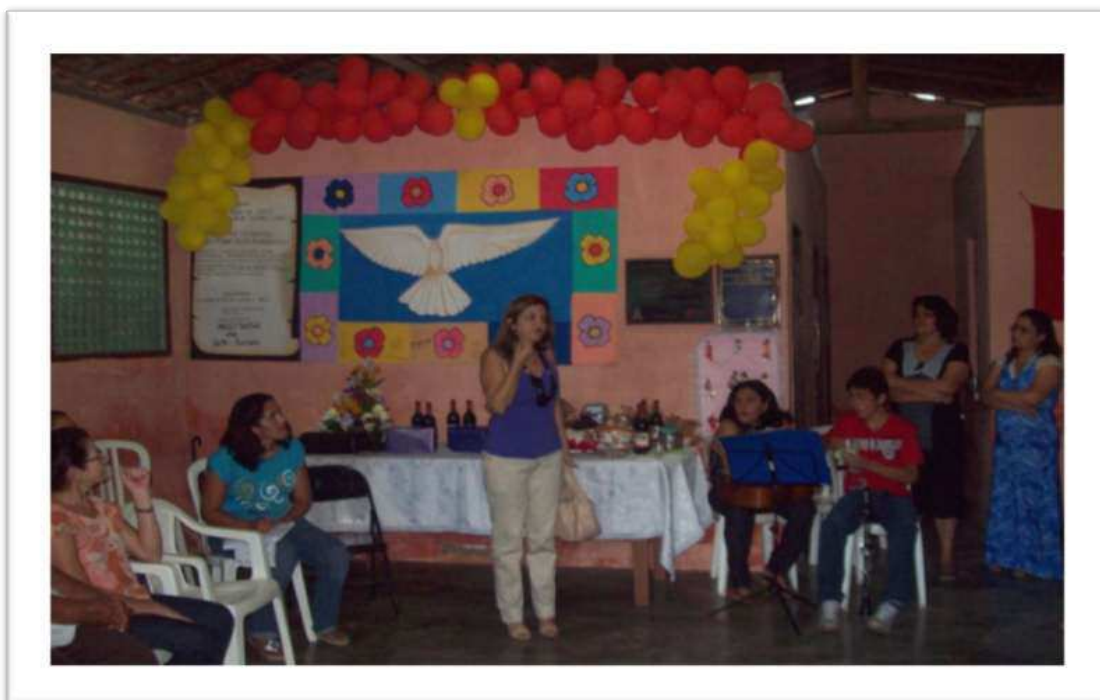
Figura 10: Visita de assessores de políticos ao Clube de Mães Ferraz.

Alguns assessores vieram representando o candidato e também discursaram em nome deles e justificando a ausência. Com a chegada de um político ou assessor o outro pedia desculpas e se retirava. Estes acontecimentos intercalaram a programação da comemoração com músicas, lanches, dinâmicas e homenagens.