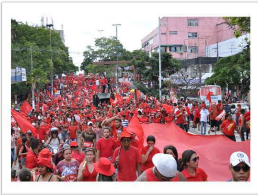
FIGURA 11: Caminhada nas ruas centrais de Campina Grande – PB nas eleições de 2012.

Sobre a caminhada na periferia, assevera a autora: