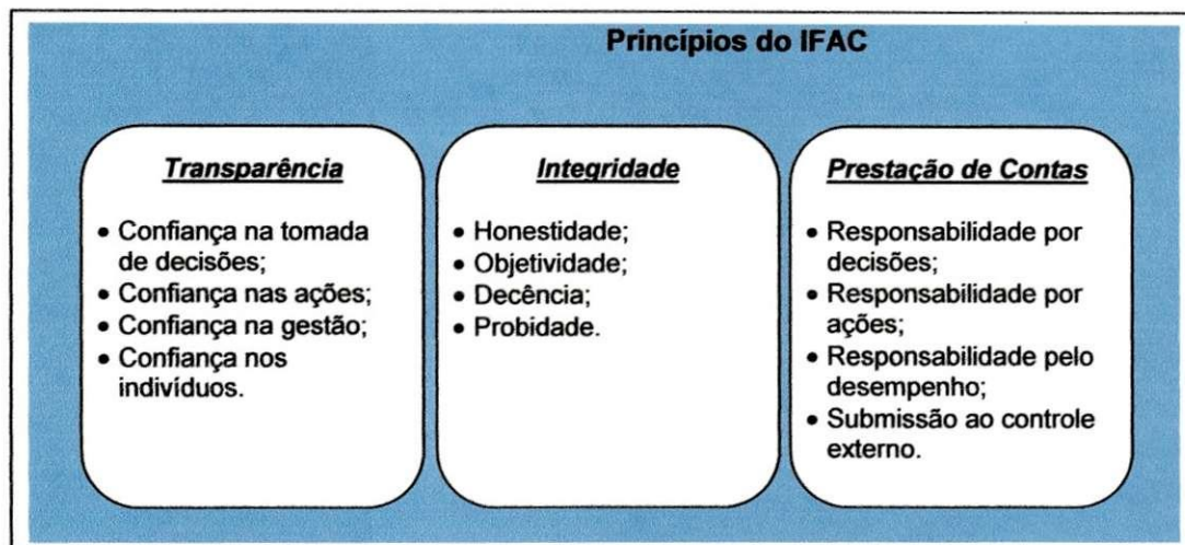
Figura 2 – Princípios de governança para o setor público.

O IFAC trabalha com três princípios de governança voltados ao setor público: A transparência, a integridade e a prestação de contas, conforme demonstra a figura 2: