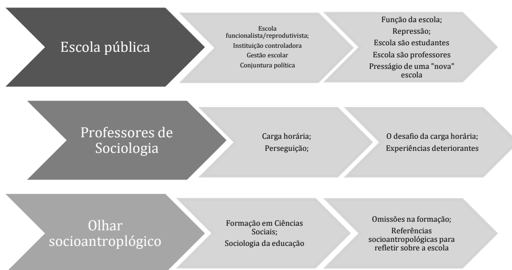
Figura 3: Categorias teóricas, categorias empíricas e unidades de análise da pesquisa

O quadro abaixo nos fornece um panorama geral do percurso de análise montado ao longo de nossa pesquisa, a saber: categorias teóricas (à esquerda), empíricas (ao centro) e unidades de análise (à direita).