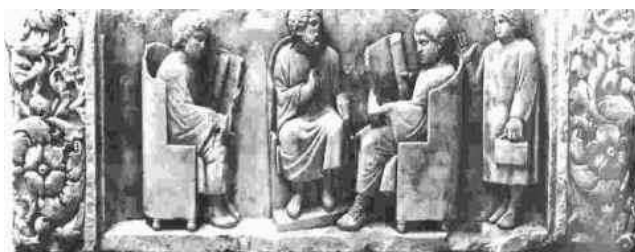
Figura 1: Cena de escola em Trier. Relevo romano tardio (séc. III A.D.). O mestre e os alunos. Dois deles desenrolam seus volumina (manuscritos; hoje, livros): o terceiro, à direita, traz a capsa, caixa de madeira que serve para conter e transportar livros e que contém o necessário para ler e escrever. 1