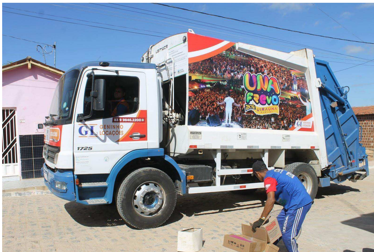
Figura 02. Coleta de lixo na cidade Uiraúna- PB.