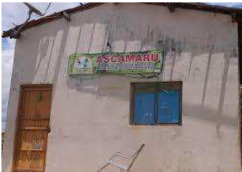
Figura 03. Sede da associação de catadores da cidade de Uiraúna.