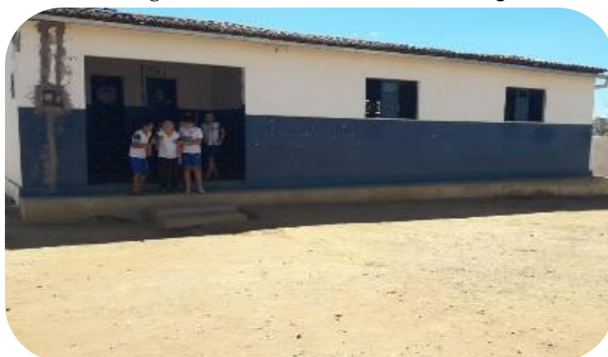
Fotografia 2 - Frente da Escola Riacho Salgado.