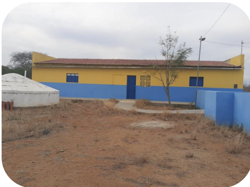
Fotografia 3 - Frente da Escola Hilda Maria de Sousa Brito