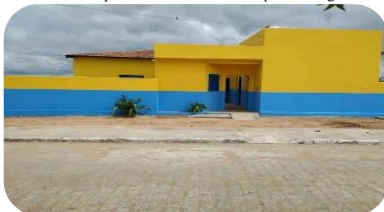
Figura 4 - Frente do prédio da Creche Municipal Rosangela de Fátima.