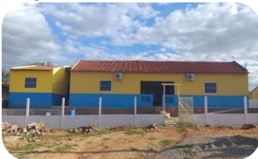
Fotografia 1 - Frente da Escola Constantino de Farias Castro.