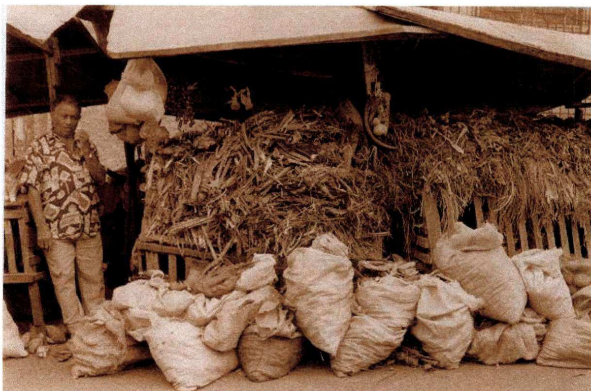
Banca de ervas (Feira Central) (Foto 5)

Em algumas bancas situadas na Feira Central, observou-se que as ervas estão dispostas umas sobre as outras, de tal maneira que formam uma divisória entre a rua e a parte interna da banca. Neste espaço, o erveiro costuma realizar consultas mais específicas que exigem uma maior proximidade entre ele e seu cliente.