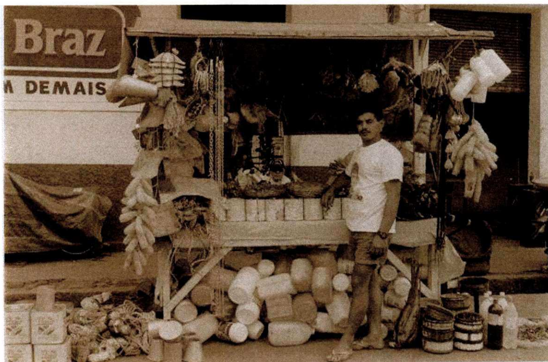
Banca de ervas (Feira Central) (Foto 2)

Também é visível que, além das ervas e garrafadas expostas à venda, outros produtos são comercializados, embora em menor fluxo, como: escorredores de pratos, espanadores, colheres de pau, galinhas, peixe-seco, abanos, temperos caseiros, panelas, vassouras e quadros com imagens representativas do sincretismo religioso e de artistas televisivos.