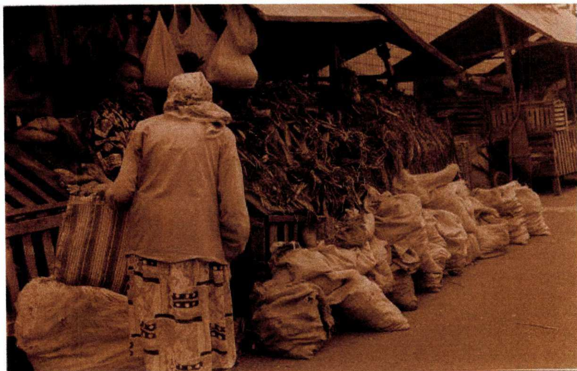
Banca de ervas (Feira Central) (Foto 2)

Com referência ao aspecto “físico” das bancas de ervas, verificou-se que o padrão predominante se caracteriza por estruturas improvisadas, feitas de madeira tosca e folhas de zinco com cobertura de lona ou plástico; por se tratar de um comércio com característica ambulante, as bancas são montadas e desmontadas diariamente, enquanto que as ervas são acondicionadas em sacos plásticos, caixas de papelão, latas, ou envolvidas na própria lona que cobre a banca, como bem ilustra o material fotográfico a seguir: