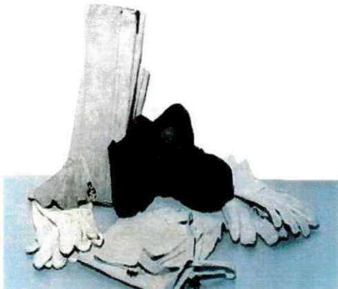
FIGURA 16 – Alguns Equipamentos de Proteção para Membros (EPM)