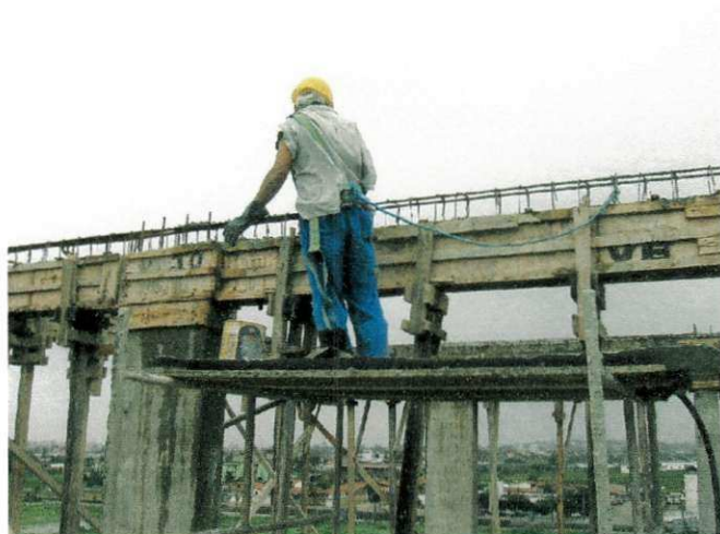
FIGURA 12 - Trabalhador usando equipamentos de proteção: cinto, luvas e capacete.