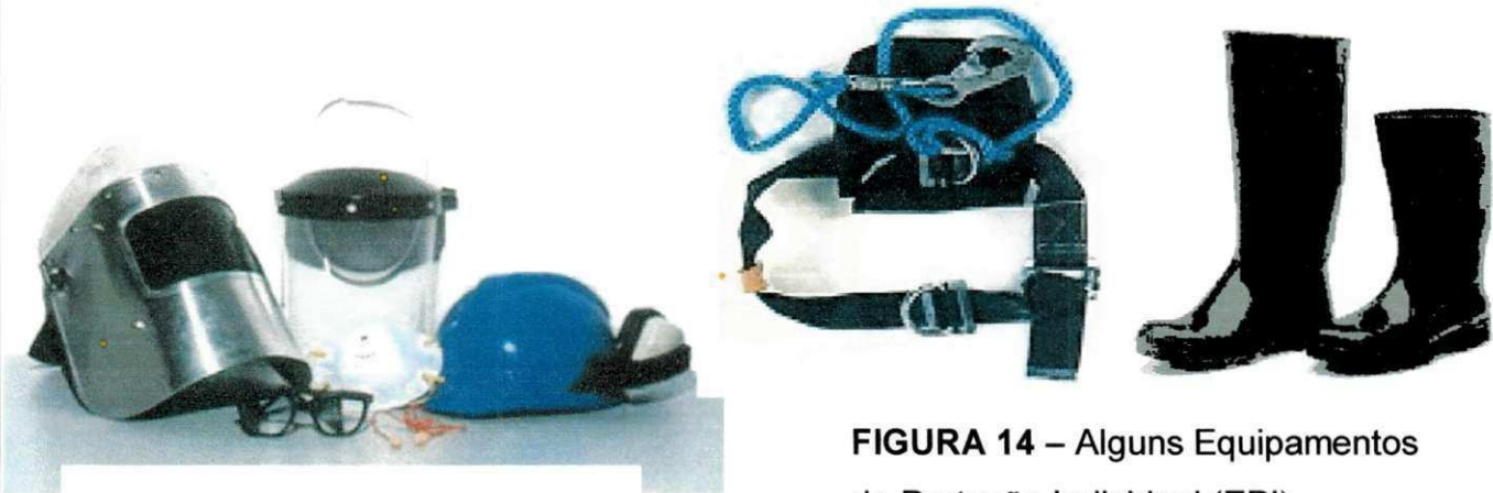
FIGURA 14 – Alguns Equipamentos de Proteção Individual (EPI)