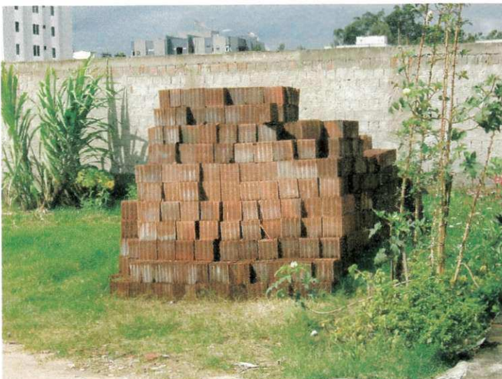
FIGURA 08 – Armazenagem dos tijolos

Até o presente momento as paredes estão completadas nos quatro primeiros pavimentos, ainda não se realizou o encunhamento das paredes, e nos demais pavimentos estão a uma altura de 1,5 m.