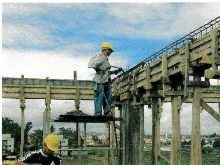
FIGURA 10 – Adensamento do Concreto em vigas

Além disso, é fundamental fazer corretamente o adensamento e a cura das argamassas e dos concretos. O adensamento e a cura mal feitos são as principais causas de defeitos e problemas que surgem nas argamassas e nos concretos, como baixa resistência, as trincas e fissuras, corrosão da armadura etc. O bom adensamento é obtido por vibração adequada. O principal cuidado que se deve tomar para obter uma cura correta é manter as argamassas e os concretos úmidos após a pega, molhando-os com uma mangueira ou com um regador, ou então cobrindo-os com sacos molhados (de aniagem ou do próprio cimento), ou até colocando tábuas ou chapas de madeira molhadas sobre a superfície, de modo a impedir a evaporação da água por ação do vento e do calor do sol durante um período mínimo de sete dias.