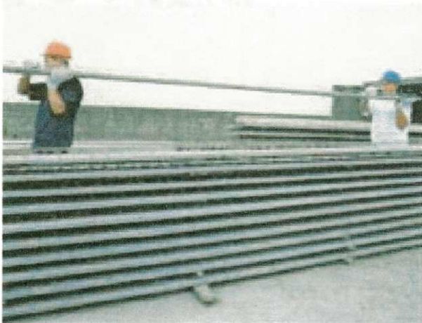
FIGURA 07 – Transporte das Vigotas