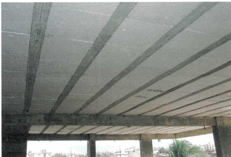
FIGURA 02 – Aspecto visual da laje treliçada com blocos de EPS.