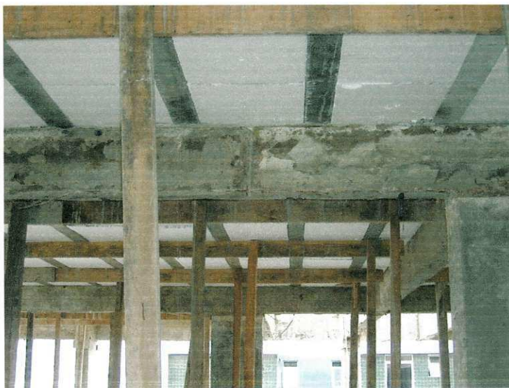
FIGURA 05 – Escoramento da laje

Observação: Os dois sistemas de nervurada (protendida e treliçada) devem ser caracterizados como laje executada com elementos pré-moldados, já que parte dela é moldada in-loco.