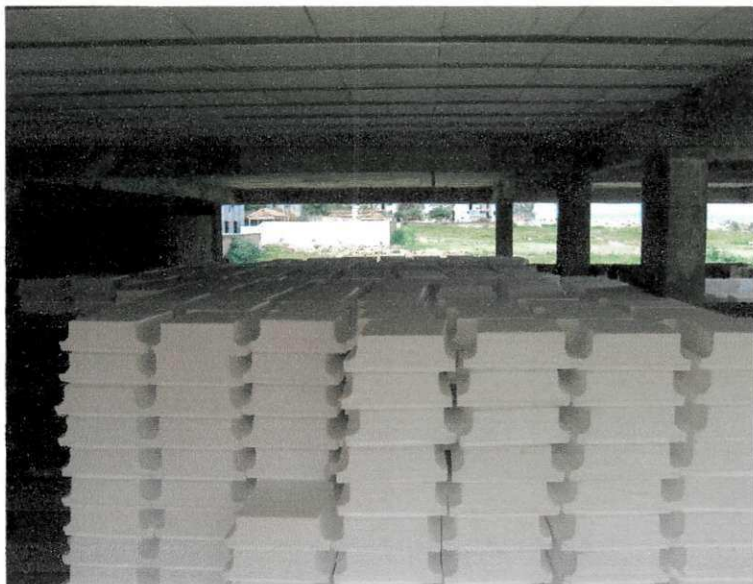
FIGURA 03- Armazenamento dos blocos de EPS