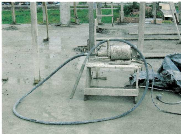
FIGURA 13 - Vibrador de Imersão

OBS.: No caso de grandes deformações, a concretagem tem que ser suspensa, retirado o concreto, e concertada a fôrma. Na linguagem dos operários este fato é conhecido como “abrir fôrma”.