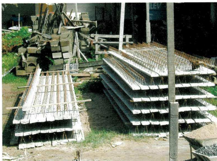
FIGURA 06 – Armazenamento das Vigotas