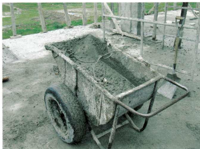
FIGURA 09 – Transporte do Concreto