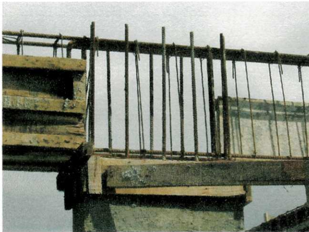
FIGURA 11 – Transpasse de pilares com vigas

Durante a concretagem dos pilares é comum verificar um congestionamento de barras, no ponto em que estas são unidas – nos nós -, mais precisamente nas bases para os pilares e continuação dos mesmos no pavimento superior.