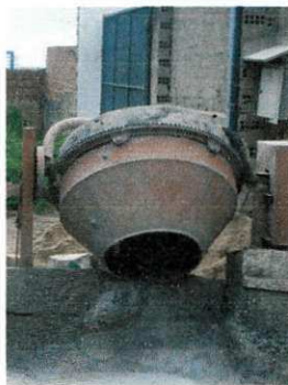
Figura 19 - Betoneira

Equipamento utilizado para à produção de argamassa. Nesta obra, a betoneira tem capacidade para 580 litros e potência de 7,5 cv (1730 rpm).