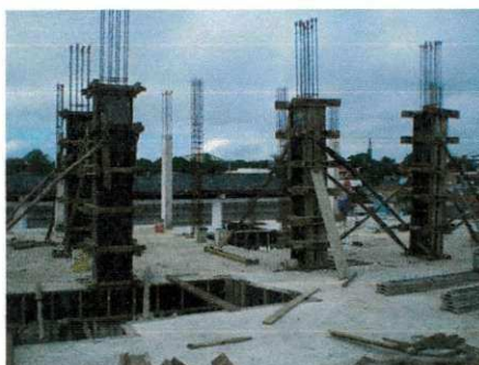
Figura 16 - Fôrmas e escoramentos para pilares

Para os pilares as formas de madeira são constituídas por quatro tabuas laterais, assim como as das vigas se precavendo contra o abaulamento no ato da concretagem. São deixadas portinholas nos pés dos pilares para permitir a ligação dos ferros de um para outro pavimento.