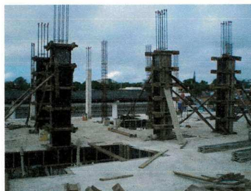
Figura 9 - Armadura à espera do concreto