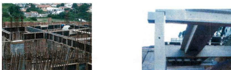
Figura 2 - Operação de montagem de painéis pré-fabricados

No caso das lajes compostas por vigotas e blocos cerâmicos, ao contrário dos painéis pré-fabricados, deve ser feita a solidarização do conjunto com uma capa superior de concreto, geralmente de 4 cm de espessura. A grande vantagem deste tipo de solução é a velocidade de execução e a dispensa de fôrmas. Seus vãos variam de 4 a 8 metros, podendo-se chegar a 15 metros.