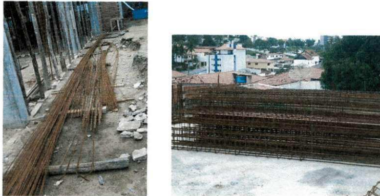
Figuras 22 – Armação