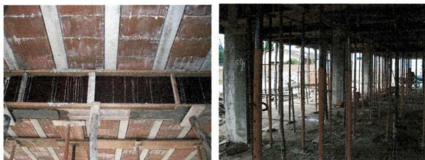
Figura 15 - Fôrmas e escoramentos para lajes e vigas

Para as vigas, as formas utilizadas também são de madeira, estribadas com cintas para evidenciar o seu abaulamento no ato da concretagem. Devem ser escoradas a cada 0,80m com pontaletes verticais como os das lajes.