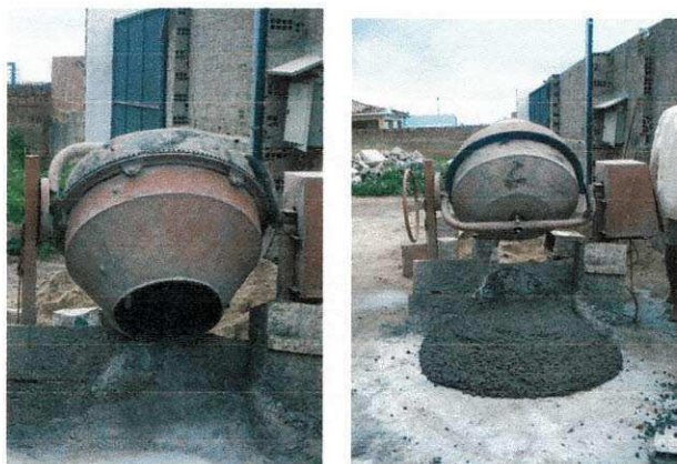
Figura 3 - Processo de fabricação do concreto in locu

No início de meu estágio o concreto estava sendo confeccionado in locu, preparado com o auxílio de betoneiras. No período de concretagem constatou-se que a baixa intensidade de chuva não prejudicou a execução, mas favoreceu de certa forma a cura do concreto.