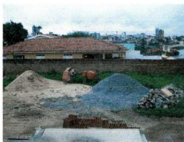
Figura 10 - Armazenamento de areia e brita

O fechamento da obra é de extrema importância para que se possa evitar a entrada de pessoas estranhas, o que poderia vir a causar acidentes graves, na obra. O Condomínio Residencial foi cercado por muro de alvenaria, onde foram feitos um portão para entrada de pessoal, outro para entrada de veículos e materiais.