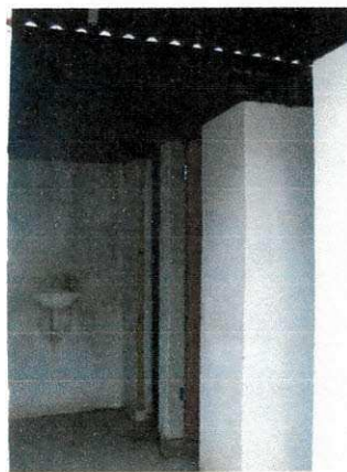
Figura 13 – Vestiários e sanitários

Os canteiros de obra deveriam possuir vestiário para a troca de roupa dos trabalhadores que não residem no local. O vestiário apresenta paredes de alvenaria e pisos cimentados, iluminação artificial, área de ventilação e armários individuais, observando sempre a conservação de higiene e limpeza dos local pelos próprios operários.