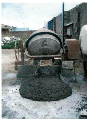
Figura14 – Concreto fabricado in loco

O fck estabelecido em projeto é de 20 MPa, sendo realizado o traço com cimento em peso, e agregados. Inicialmente o concreto foi fabricado in loco, através do uso de betoneiras , após foi contratado o concreto usinado seguindo o mesmo fck estabelecido anteriormente.