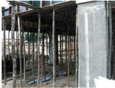
Figura 17 - Pilar depois de retirada a fôrma