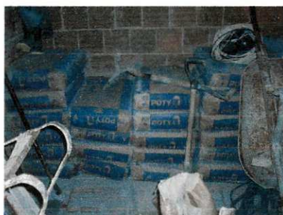
Figura 21 – Armazenamento do cimento

Empilhados com altura máxima de 10 sacos e abrigado em local protegido das intempéries, asentados em um tablado de madeira para evitar a umidade do solo.