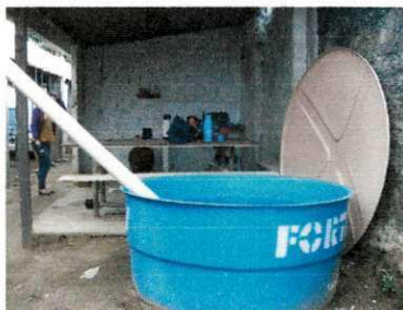
Figura 20 – Armazenamento de água da chuva

Fornecimento feito pela Companhia de Água e Esgotos da Paraíba (CAGEPA); considerando-se a mesma potável, e devido à presença de chuvas a água da mesma também foi aproveitada.