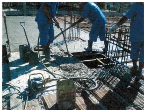
Figura 18 - Vibrador de imersão