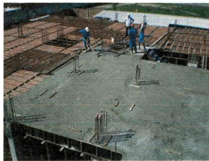
Figura 21 – Operários concretando laje

Seria mais produtivo se a concretagem comesçassem por volta das 8hs, desta forma os trabalhadores não estariam envolvidos em outras atividades no início da manhã e não enfrentarem a concretagem já um tanto cansados.