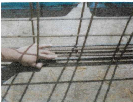
Figura 8 - Verificação dos espaçamentos

A medida que os pavimentos iam sendo desocupados, dois operários encarregavam-se da limpeza dos mesmos, de modo que a obra apresentava-se sempre limpa.