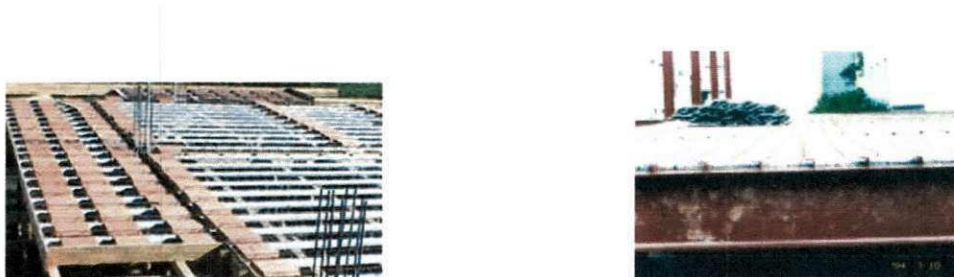
Figura 1 - Operação de alinhamento das vigotas e painéis treliçados

Existem diversos tipos de lajes pré-fabricadas, que seguem um rígido controle de qualidade das peças, inerente ao próprio sistema de produção. Podem ser constituídas por vigotas treliçadas ou armadas, que funcionam como elementos resistentes, cujos vãos são preenchidos com blocos cerâmicos ou de cimento, ou por painéis pré-fabricados protendidos ou treliçados, apoiados diretamente sobre as vigas de concreto ou metálicas (estrutura mista).