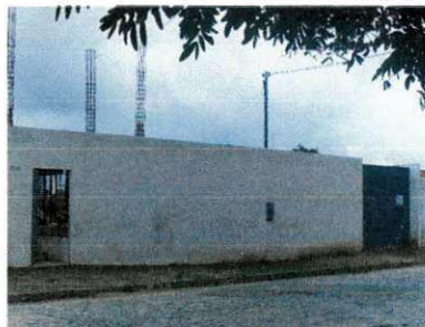
Figura 11 – Portões de acesso à obra