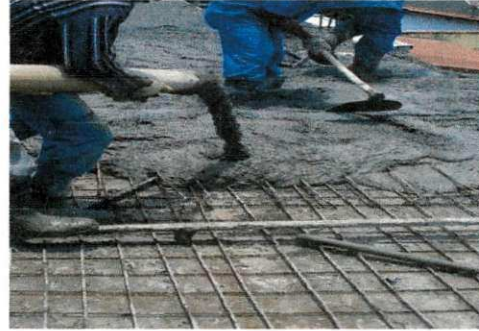
Figura 5 – Concretagem da laje usando O concreto usinado

Executado com concreto armado, as cintas, lajes nervuradas e pilares, tendo a resistência característica do concreto à compressão f_{ck} em 20 MPa. Observou-se no laboratório que todos os testes possibilitaram estimar uma resistência acima da esperada.