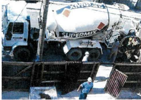
Figura 4 – Concreto usinado

Apesar disso devido a necessidade do aumento do andamento da obra, utilizou-se o concreto usinado da empresa Supermix para a concretagem dos pilares e lajes restantes do edifício.