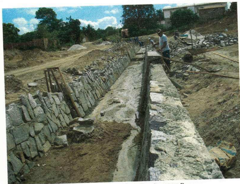
Figura 18 (Construção do canal)