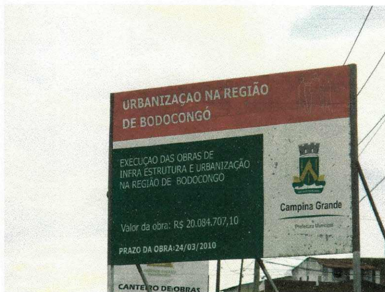
Figura 02 (Placa informativa)