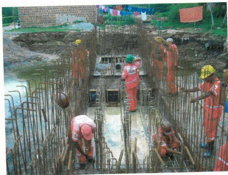
Figura 15 (Construção da estação elevatória)