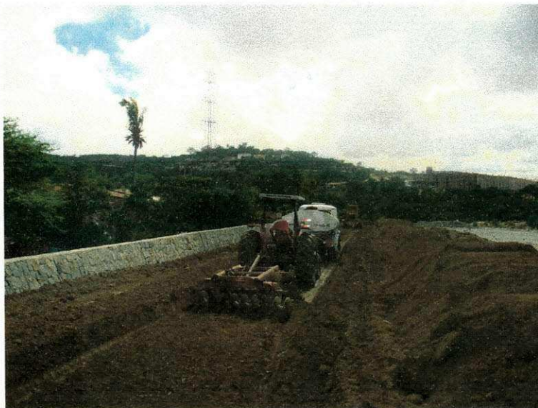
Figura 09 (Terraplenagem)