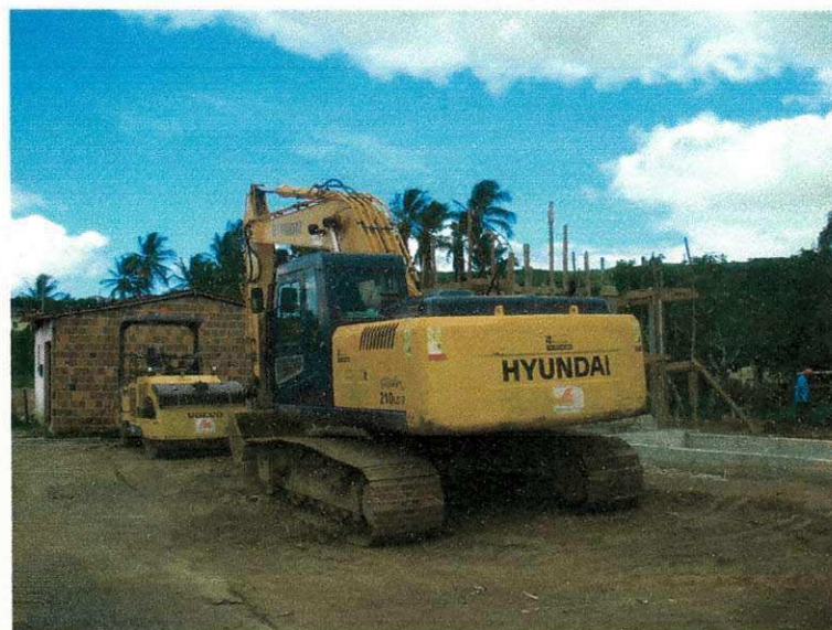
Figura 03 (Maquinas)