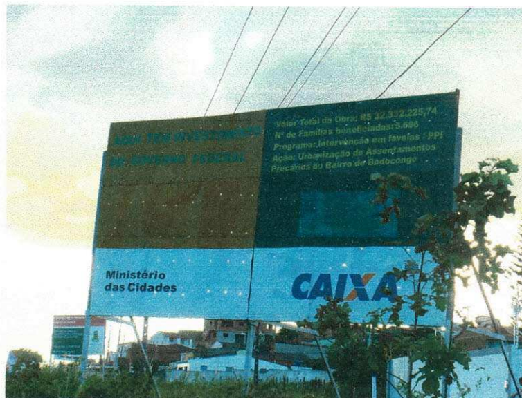
Figura 01 (Placa informativa)