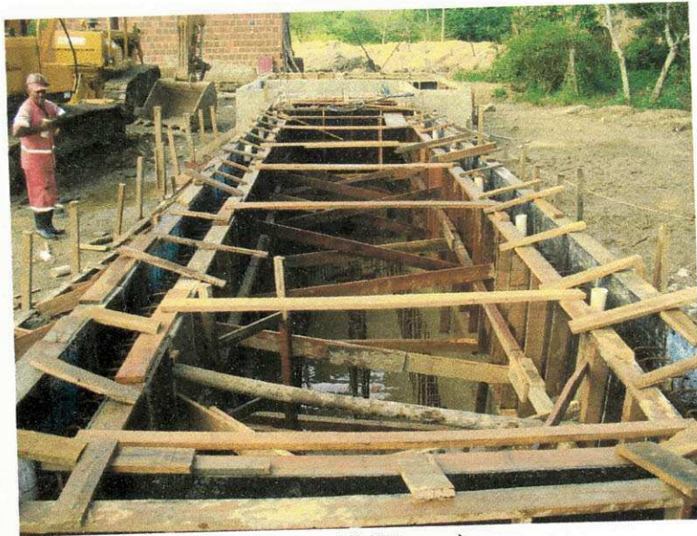
Figura 16 (Fôrmas)