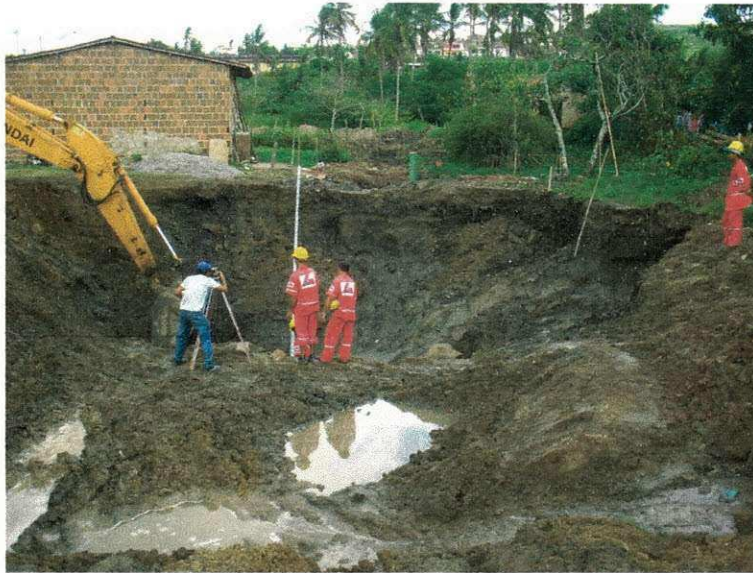
Figura 07 (Escavação em lama)