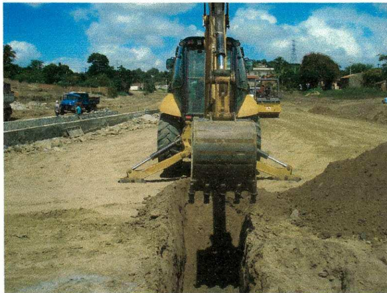
Figura 08 (Escavação mecânica)