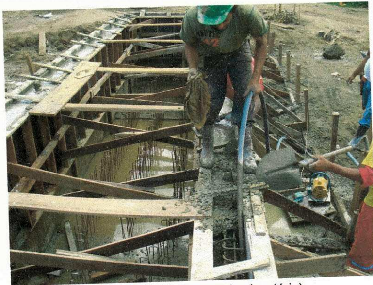
Figura 17(Concretagem da elevatória)