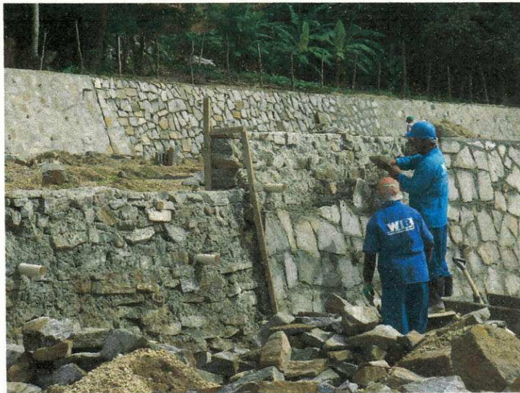
Figura 11 (Muro de arrimo)