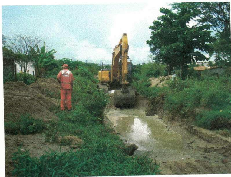
Figura 13 (Escavação de canais)