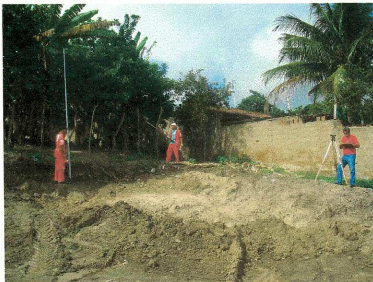
Figura 06 (Topografia)