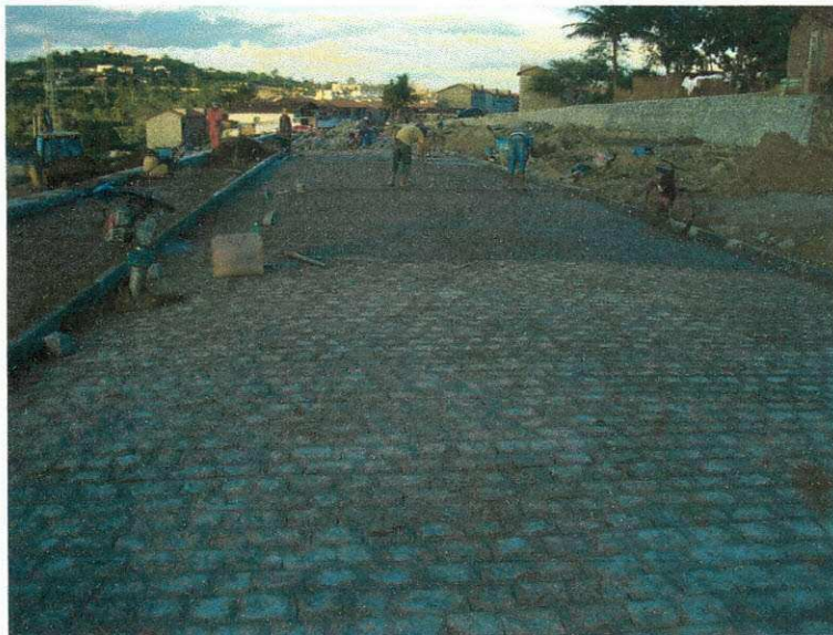
Figura 10 (pavimentação de rua)