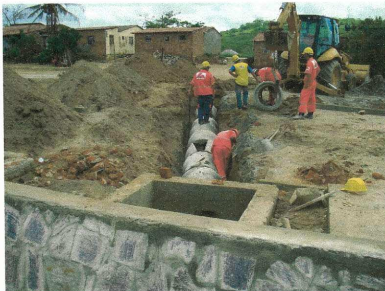
Figura 12 (Rede de drenagem)