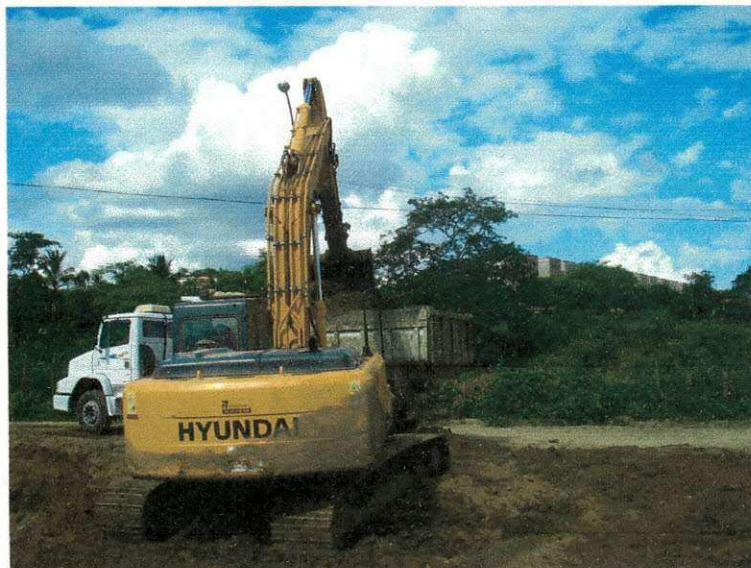
Figura 05 (Movimentação de terra: bota – fora)