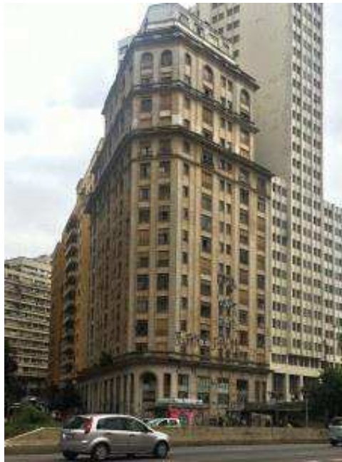
Figura 3 - Edifício Riskallah Jorge.