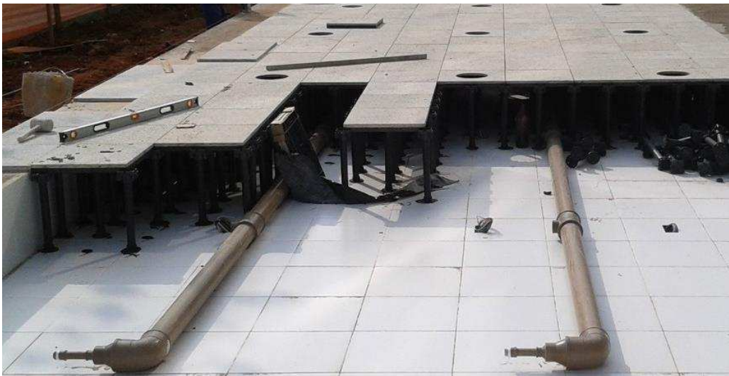
Figura 2 - Piso elevado com passagem de tubulações hidrossanitárias.