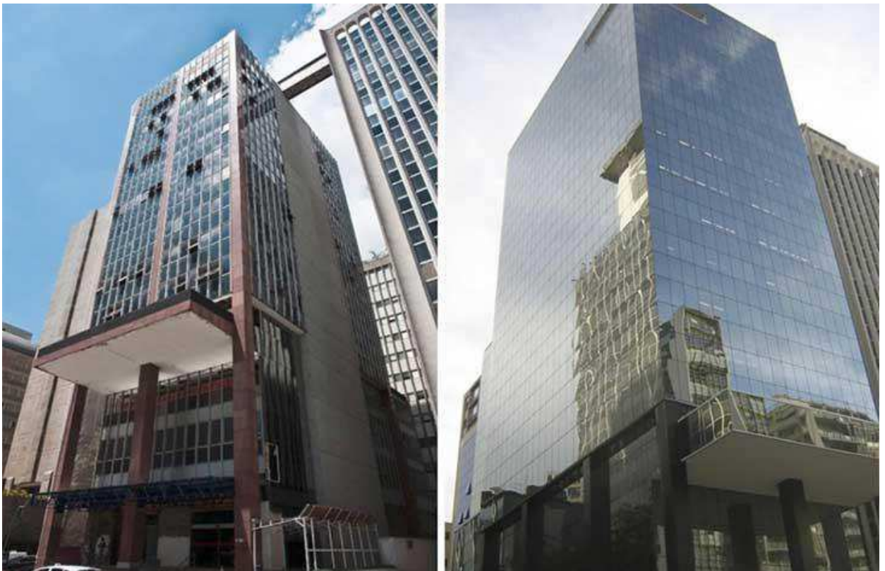
Figura 1 - Edifício Bella Paulista antes e depois do retrofit de fachada.