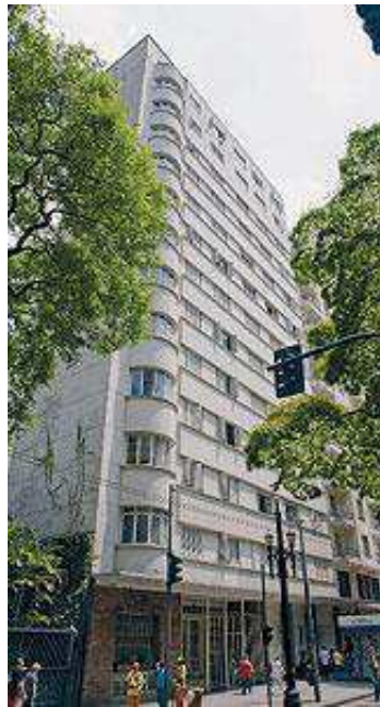
Figura 4 - Edifício Maria Paula.

Também se encontra localizado na cidade de São Paulo - SP, na Rua Maria Paula, nº 171, Bela Vista, possuindo subsolo, térreo e 12 pavimentos. Manteve seu uso original de edifício residencial após a intervenção, porém passou por um processo de adequação às normas vigentes de incêndio. Sua fachada pode ser vista na Figura 4.