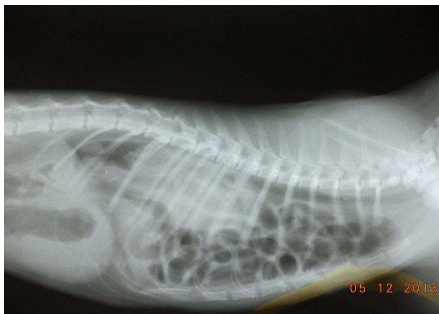
Figura 3. Imagem radiográfica do tórax (hérnia diafragmática) de um gato, SRD, macho, 8 meses de idade. Atropelado por moto. Ausência de silhueta cardíaca obscurecida pelo padrão pulmonar, perda parcial da cúpula diafragmática e presença de estruturas radiolúcidas no espaço pleural sugestivo de alças intestinais.