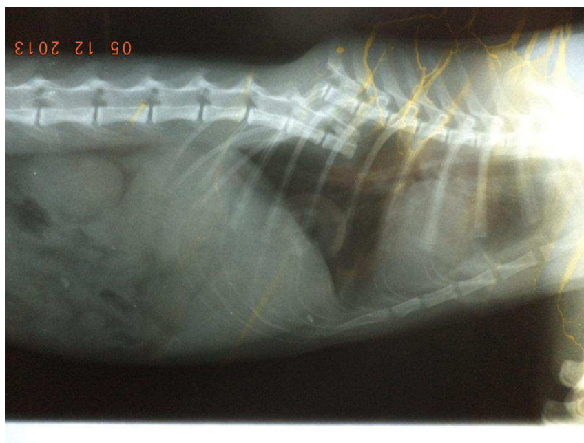
Figura 5. Imagem radiográfica do segmento torácico da coluna vertebral de um gato, SRD, macho. Caiu de uma laje. Com fratura avulsiva de T11.

Vítimas de trauma torácico apresentaram ocorrência de 44,44% do número de óbitos, dos quais, 2 eram cães e 2 gatos. Contudo 22,22% apresentarem trauma medular, sendo 2 gatos. O mesmo aconteceu com as vítimas de trauma abdominal, sendo 22,22% o número de óbitos, acometendo 2 gatos. E por fim o de menor incidência, o trauma crânio-encefálico com 11% dos casos de óbitos, acometendo um gato. Dos animais que foram a óbito, 78% (7/9) eram gatos, todos SRD. Os outros 22% (2/9) eram cães, sendo um SRD e outro da raça pinscher.