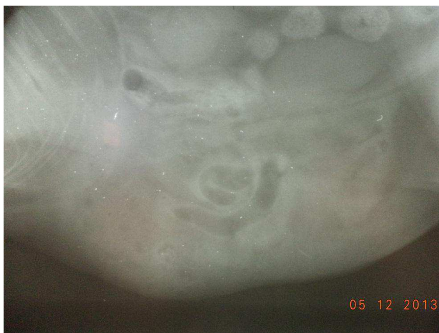
Figura 4. Imagem radiográfica do abdômen de um gato, SRD, macho, 1 ano de idade. Presença de estruturas com diferentes densidades sugerindo a presença de estruturas parenquimatosas e alças intestinais no saco herniário, achado radiográfico sugestivo de hérnia umbilical.

A eventração abdominal apresentou uma ocorrência de 33,33% das afecções traumáticas abdominais, acometendo apenas gatos. A hérnia inguinal apresentou a mesma prevalência de 33,33% dos traumas, acometendo apenas cães, porém, Smeak (2003) afirma que essa afecção não tem predisposição sexual ou racial. A hérnia umbilical ocorreu em apenas 16,66% da casuística, em um gato. A ruptura da bexiga obteve a mesma ocorrência, sendo 16,66% dos casos, em um cão, e segundo Thornhill e Cechner (1981) os cães machos apresentam uma maior predisposição à ruptura traumática vesical, pois suas uretras são capazes de resistir a elevadas pressões mesmo quando submetidas a traumas intensos. Os cães foram acometidos em 50% (3/6) das lesões, assim como os gatos. Todos os felinos eram SRD, já os caninos em sua maioria eram da raça poodle com 66,66% (2/3) de prevalência. A idade desses animais encontrava-se numa faixa etária entre 8 meses a 11 anos de idade, não havendo uma maior predominância por faixa etária.