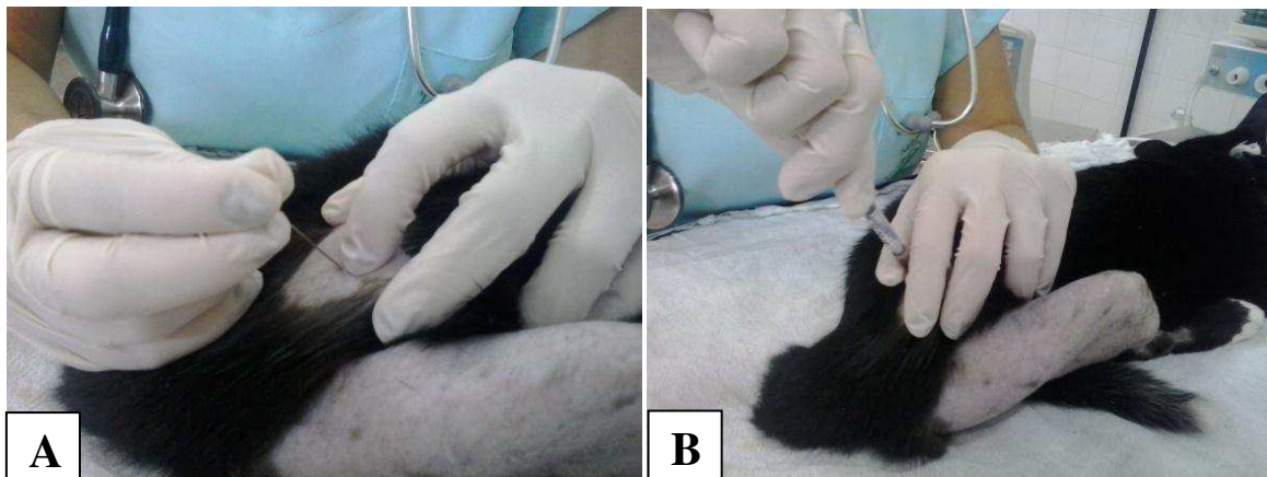
Figura 3: Local de bloqueio para anestesia epidural (A) e infusão de anestesia epidural (B).

radiculopatia, particularmente para pacientes com dores nas costas, pernas e pescoço (DICKINSON, 2009).