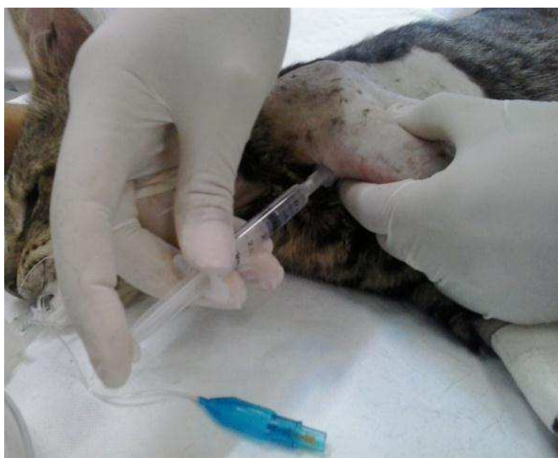
Figura 4: Abordagem axilar - bloqueio do plexo braquial

A abordagem axilar para bloqueio de plexo braquial (Figura 4) proporciona anestesia satisfatória para cirurgias em cotovelo, antebraço e mão e também fornece anestesia cutânea confiável na face interna do braço, incluindo o nervo cutâneo medial do braço e o nervo intercostobraquial. Além disso, a abordagem axilar é considerada segura, uma vez que não corre-se o risco de bloqueio do nervo frênico, nem tem o potencial de causar pneumotórax (ASHISH, 2011).