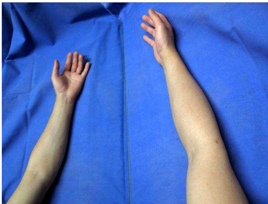
Figura 2: Terapia espelho para dor fantasma de membro.

corpo ajuda a reorganizar e integrar o descompasso entre a propriocepção e o feedback visual do apêndice removido (Figura 2), aumentando o efeito do tratamento para a dor do membro fantasma. Um paciente com dor do membro fantasma pode experimentar a mesma sensação ou emoção de sua parte normal do corpo, observando a imagem no espelho. Ao fazer isso, espera-se diminuir a dor através da resolução de conflito na interação motor-proprioceptivo-visual (CHAN, 2007).