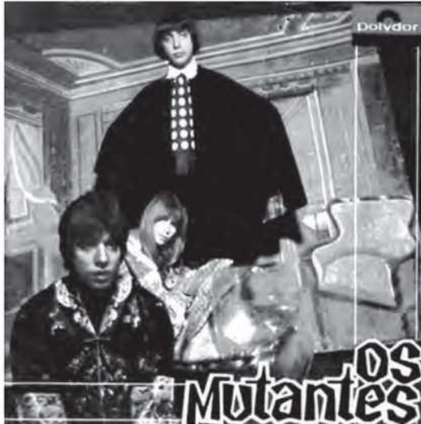
Capa do LP Os Mutantes, 1968. Disponível em: http://mutantes.com . Acesso em: 28 fev. 2012. (Foto: Reprodução/Enem)

A capa do LP Os Mutantes, de 1968, ilustra o movimento da contracultura. O desafio à tradição nessa criação musical é caracterizado por