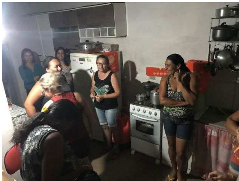
IMAGEM 11 - ENCONTRO DAS MULHERES DO GRUPO NA COZINHA