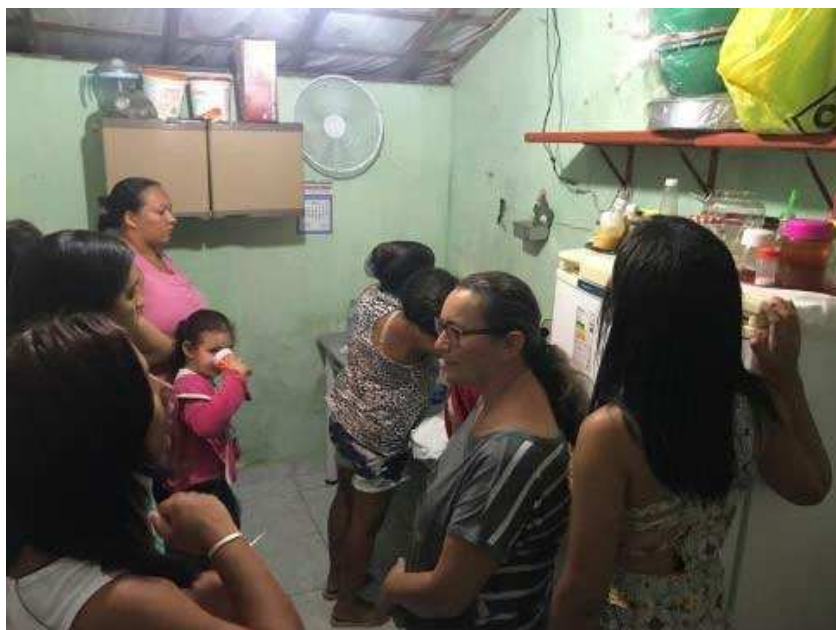
IMAGEM 12 - MOMENTO DE CONVERSA E PRODUÇÃO NA COZINHA