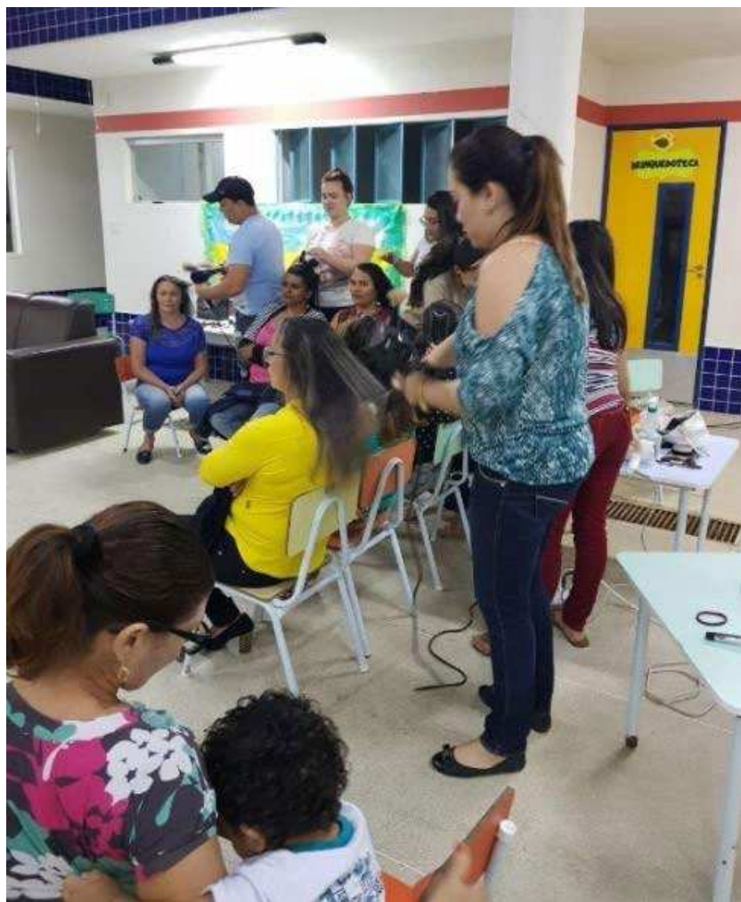
IMAGEM 18 - AÇÃO DIA DA BELEZA