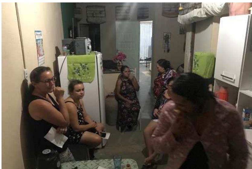
IMAGEM 15 - MULHERES NA COZINHA