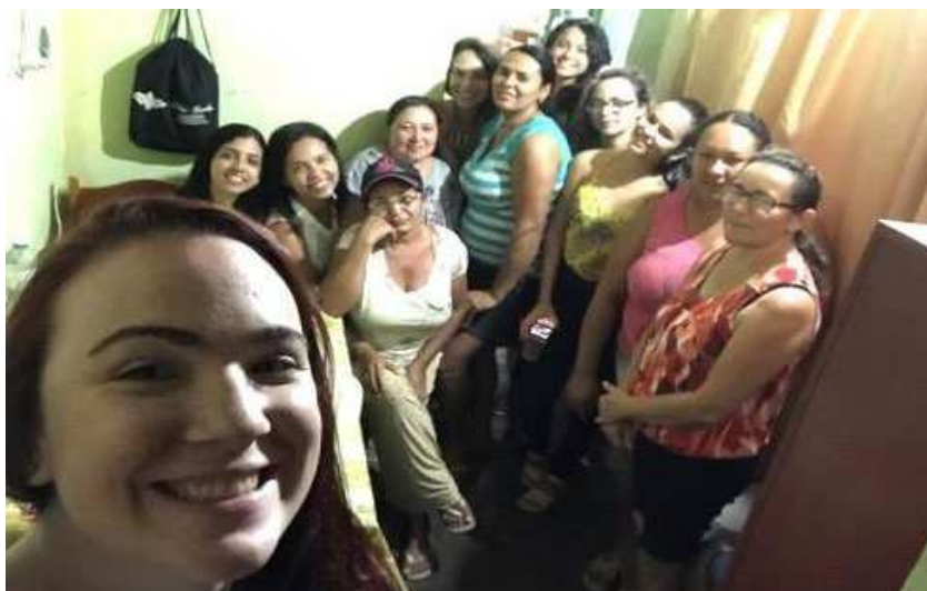
IMAGEM 16 - GRUPO VIDA NOVA REUNIDO