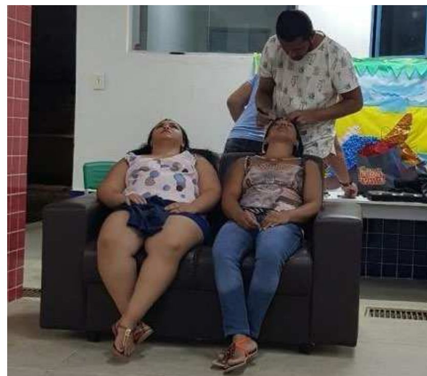
IMAGEM 17 - VOLUNTÁRIO MAQUIANDO NO DIA DA BELEZA

https://www.youtube.com/watch?v=TSfdCLOLIRI