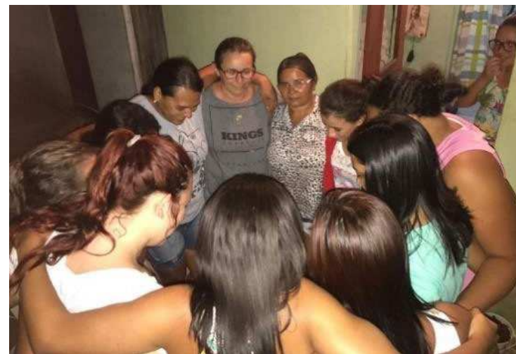
IMAGEM 7 - MULHERES DO VIDA NOVA