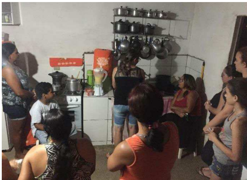
IMAGEM 3 - COZINHA DE UMA DAS MULHERES DO GRUPO

Cada encontro sempre era iniciado por uma conversa informal, fazendo com que as participantes ficassem mais à vontade para discutir sobre a temática posteriormente. A temática a ser trabalhada, pautada no Guia Alimentar para a População Brasileira, era introduzida teoricamente como que uma conversa “ao pé da mesa”, antes de colocar em prática a receita, ao passo que o conforto da conversa possibilitava interações múltiplas.