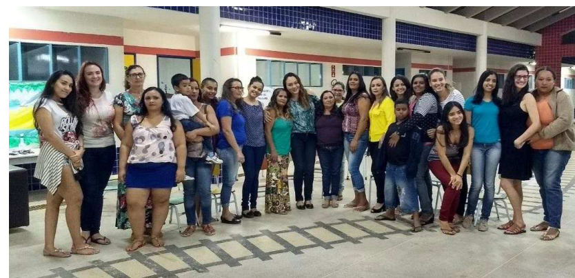
IMAGEM 20 – CENTRO DE EDUCAÇÃO E SAÚDE - UFCG -CAMPUS CUITÉ