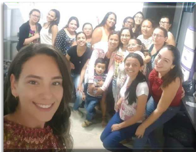
IMAGEM 1 - GRUPO VIDA NOVA