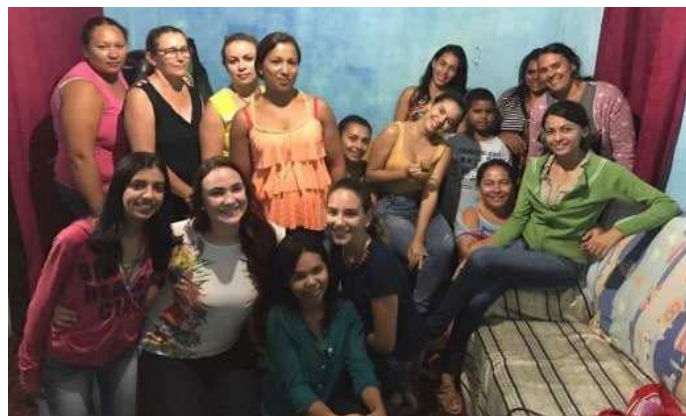
IMAGEM 10 - FIM DE MAIS UM ENCONTRO DO GRUPO