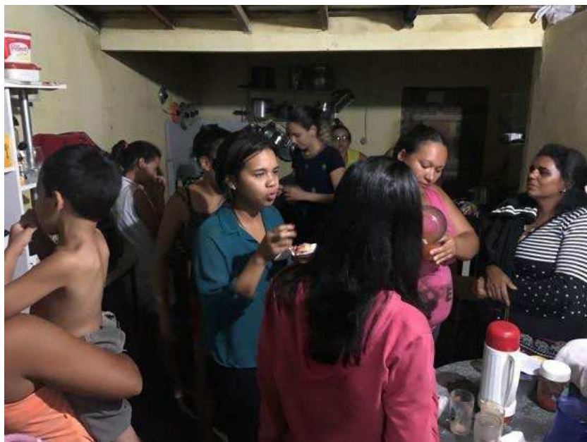
IMAGEM 13 - COMPARTILHAMENTO DE SABERES NA COZINHA DAS INTEGRANTES

“Reunidos com alegria e comendo com prazer”.