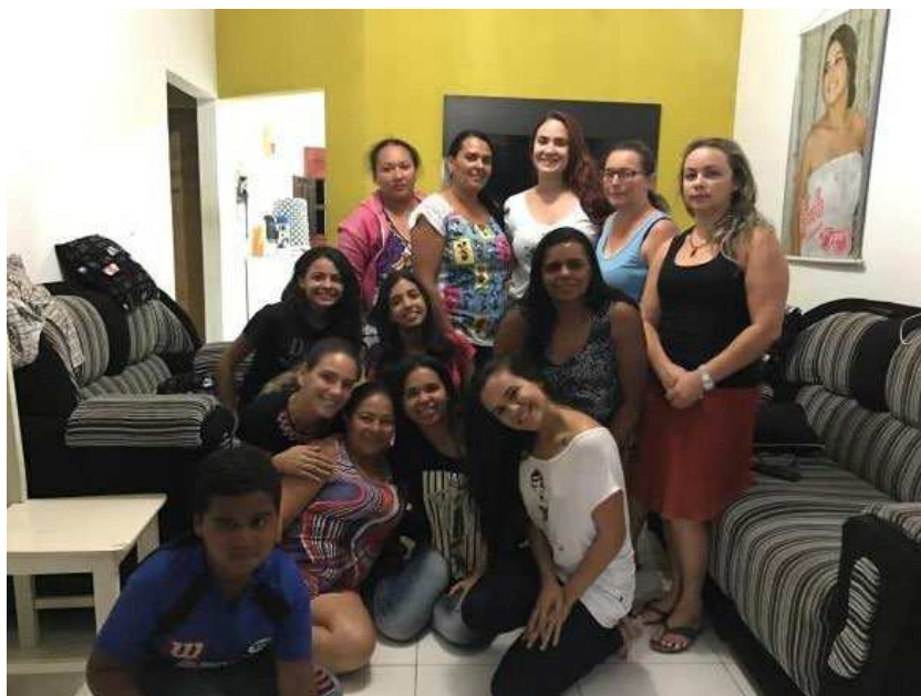
IMAGEM 14 - FIM DO ENCONTRO