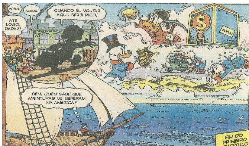
IMAGEM 1 - APÓS GANHAR UMA MOEDA DE DEZ CENTAVOS DE DÓLAR (A SUA FAMOSA MOEDINHA NÚMERO UM) TRABALHANDO COMO ENGRAXATE NOS ESTÁBULOS DE GLASGOW, PATINHAS DECIDE EMBARCAR PARA A AMÉRICA

Fonte: ROSA, Keno Don. São Paulo: Abril, n. 1, p. 39 (Reproduzido com a permissão do editor para fins didáticos. © Disney. Todos os direitos reservados).