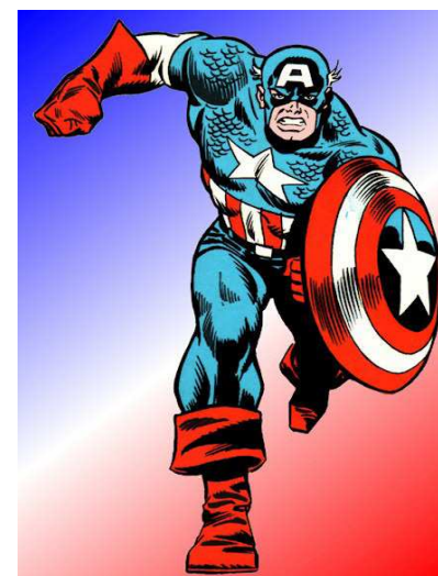
IMAGEM 1- CAPITÃO AMÉRICA E SEU ESCUDO