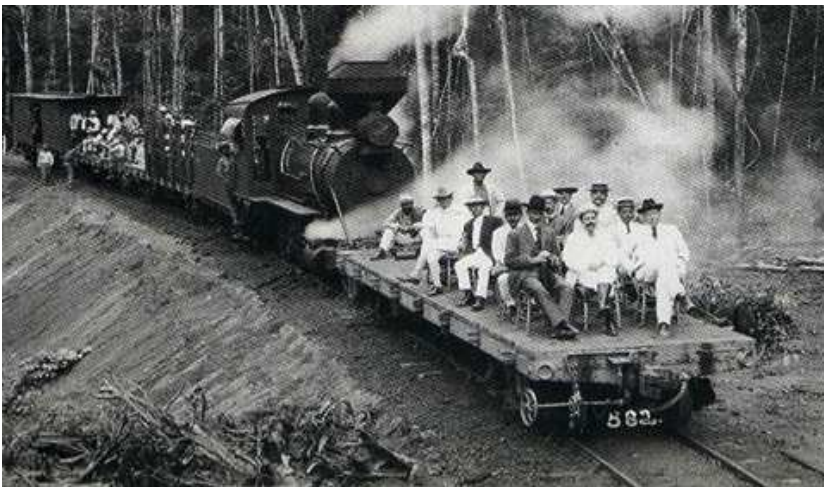
FIGURA 1. AUTORIDADES EM VIAGEM DE INAUGURAÇÃO DE UM TRECHO DA EFMM, EM 1910