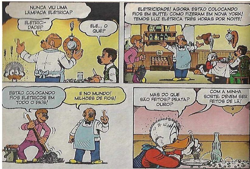
IMAGEM 2 - APÓS SER “FULMINADO” POR UM RAIO, PATINHAS DESCOBRE A ELETRICIDADE.

Fonte: ROSA, Keno Don. São Paulo: Abril, n. 1, p. 102 (Reproduzido com a permissão do editor para fins didáticos. c Disney. Todos os direitos reservados).