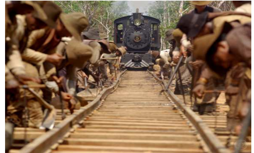
FIGURA 2. CENA DA MINISSÉRIE MAD MARIA, 2005