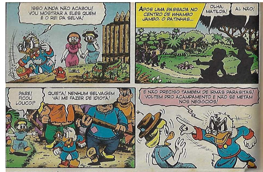
IMAGEM 4 - Na “ÚNICA AÇÃO DESONESTA DE TODA SUA VIDA”, PATINHAS INVADE UM VILAREJO AFRICANO.

Fonte: ROSA, Keno Don. São Paulo: Abril, n. 2, p. 108 (Reproduzido com a permissão do editor para fins didáticos. © Disney. Todos os direitos reservados).