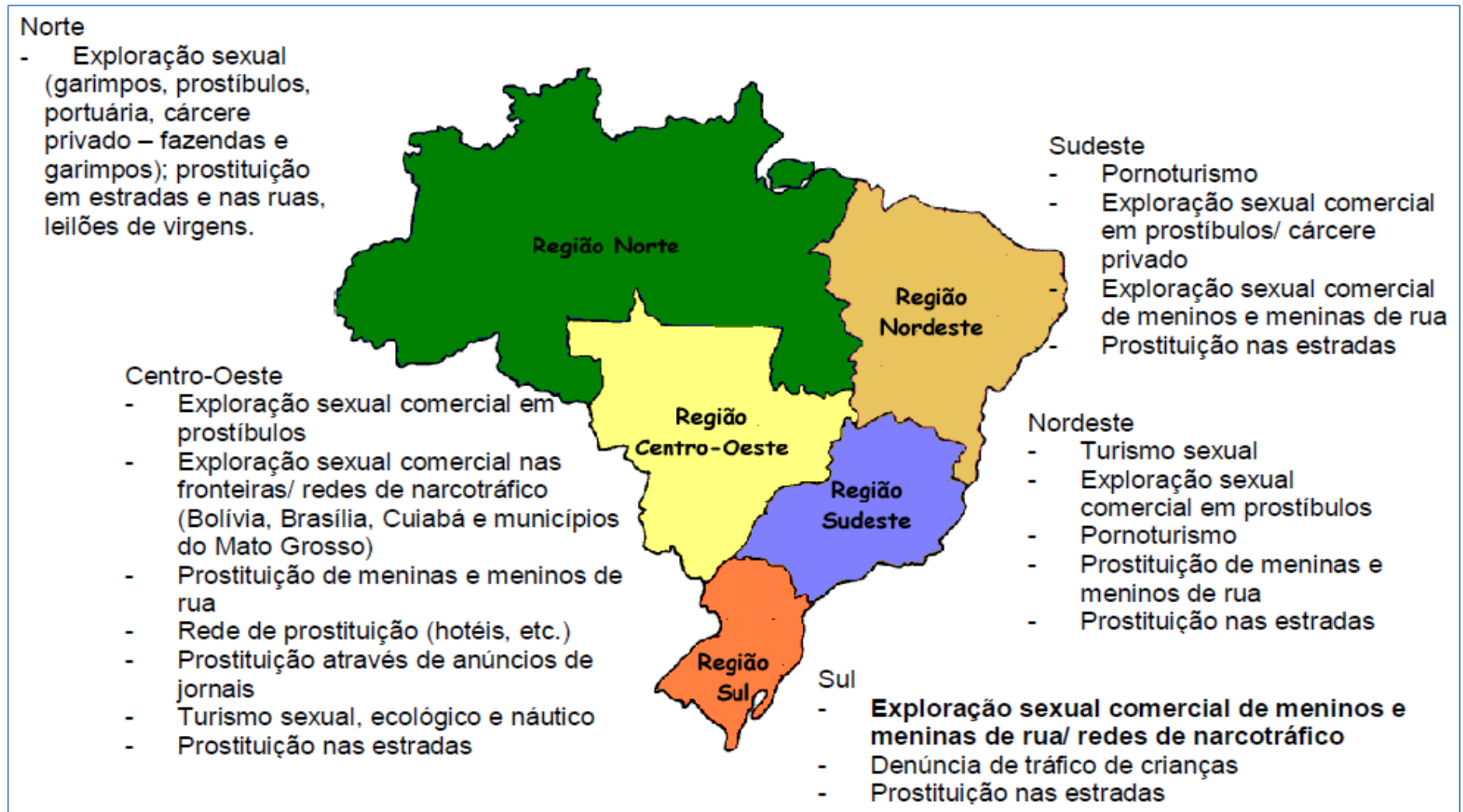
FIGURA 01 - A Distribuição Regional da Exploração Sexual Comercial Infanto-Juvenil no Brasil

Elaborado por: LEAL, Maria Lúcia Pinto. A Exploração Sexual Comercial de Meninos, Meninas e Adolescentes na América Latina e Caribe (RelatórioFinal – Brasil). Brasília: CECRIA, IIN, Ministério da Justiça, UNICEF, CESE, 1999.