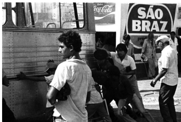
Imagem 17 – Manifestações populares pelo barateamento dos transportes. Na imagem acima é possível observar os manifestantes mais exaltados, por Nicolau de Castro.

Durante o período de ditadura em Campina Grande era comum nos ônibus a presença de policiais armados (imagens 16 e 17), pois esses seguiam ordens para apreender cidadãos considerados subversivos que prestariam esclarecimentos no quartel do exército, efetuando prisões quando julgavam necessário, além de garantirem a segurança daqueles que trabalhavam e utilizavam os ônibus como meio de transporte e eram às vezes surpreendidos por manifestações mais exaltadas e violentas.