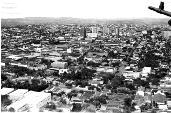
Imagem 03 – Vista aérea da cidade de Campina Grande - PB, no início da década de 80, por Nicolau de Castro.

Esta etapa apresenta o principal objetivo da pesquisa, que se propôs a investigar tal período da história de Campina Grande especialmente através de registros fotográficos e das memórias de fotojornalistas da cidade. Sendo assim, são apresentadas a seguir, de forma contextualizada, imagens do acervo pessoal de Nicolau de Castro, todas em caráter inédito.