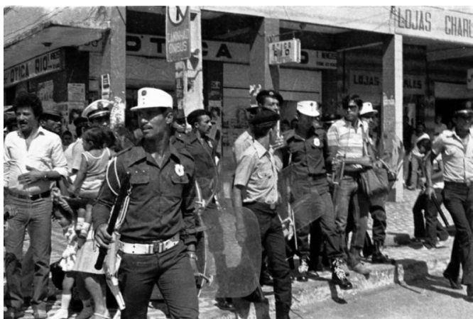
Imagem 12– Manifestação popular no centro da cidade de Campina Grande, por Nicolau de Castro.

período de ditadura haviam desaparecimentos e roubos de carregamentos de armas, porém isso não era noticiado pela imprensa” 15 .