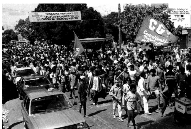
Imagem 13 – população campinense vai às ruas em manifestação pelas Diretas Já, por Nicolau de Castro.

Com base nas imagens acima (imagem 12 e 13), pode-se observar a mobilização da população campinense pouco antes das eleições que puseram fim ao regime ditatorial. Inicialmente, o governo militar mostrava não se importar com tais tipos de manifestações, porém a partir do momento em que estudantes, professores, intelectuais e artistas se juntaram formando uma só massa de oposição que vinha a reivindicar direitos trabalhistas, o governo militar atentou que várias camadas da sociedade estavam contra a ditadura. Na tentativa de evitar a queda do regime foram então instituídos instrumentos mais contundentes para conter o aumento de questionamentos, como foi o caso do Decreto – Lei nº477/69 e o AI-5.