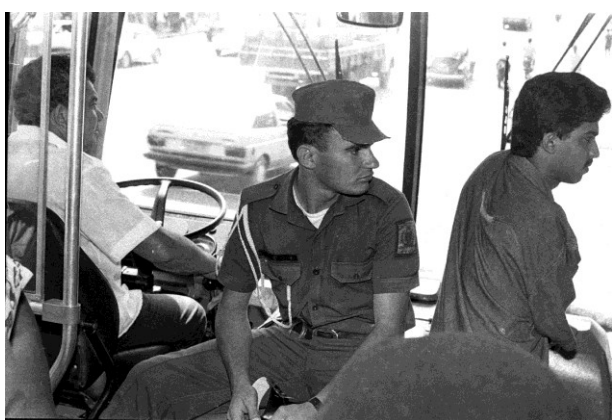
Imagens 16 – Dentro do ônibus policial garante a segurança do motorista e cobrador do ônibus, devido a violentas manifestações contra preços de passagens, por Nicolau de Castro.