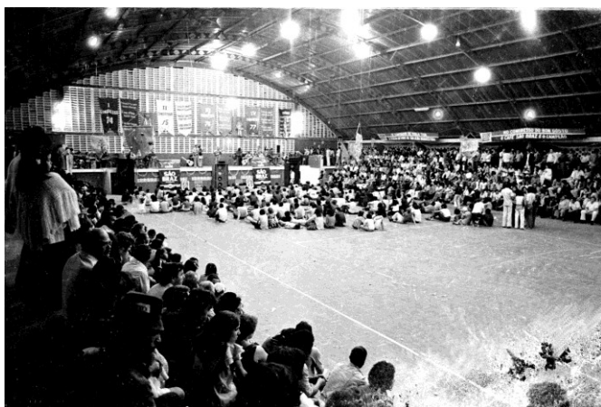
Imagem 19 – Festival de Violeiros, por Nicolau de Castro.

No período em que os ditadores encontravam-se no poder, canções que poderiam de alguma forma ir de encontro ao marketing político governamental eram reprimidas. O festival de violeiros, na foto a seguir (imagem 19), foi um desses eventos que, por não exaltar o “progresso” do país durante a ditadura e por conter um abaixo assinado por melhores condições de transporte, teve as imagens de divulgação censuradas. Sendo assim fotografias como essas (imagens 19 e 20), nunca chegaram a ser publicadas.