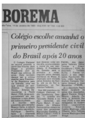
Imagem 01 - Colégio escolhe amanhã o primeiro presidente civil após 20 anos. (Reportagem de capa publicada em 14 de jan. 1985).

Em se tratando de memória e fotografia, edições do Diário da Borborema , durante o período de abertura, reavivam o passado e a história do regime militar, através de chamativas manchetes expostas na primeira página do jornal. Abaixo temos alguns exemplos que remetem ao período pós ditatorial, em janeiro de 1985 como, por exemplo, a eleição realizada ainda de forma indireta, porém levando um civil à presidência.