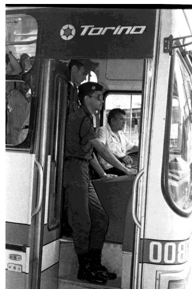
Imagem 18 – Durante o regime militar, com a finalidade de manter a ordem pública, a segurança policial garante transporte coletivo sem manifestantes, por Nicolau de Castro.

Na foto ao lado (imagem 18) é possível observar policiais atentos a movimentação enquanto garantem a segurança do motorista e cobrador, estando aptos a efetuar prisões para acalmar a reação dos manifestantes e levarem estes a prestar esclarecimentos pela desordem causada. O excesso de prisões foi um fenômeno que repercutiu por todo país.