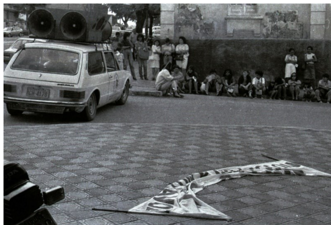
Imagem 05 – estudantes e curiosos aderem à manifestação do Sintab, aumentando o número de pessoas no local, por Nicolau de Castro.

O autoritarismo se instalou nas Universidades desde o primeiro instante da ditadura militar, através do combate às infiltrações de ideais progressistas. O Governo praticamente acabou com a possibilidade da livre manifestação estudantil.