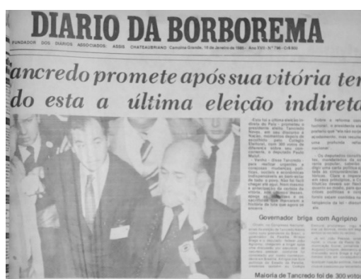
Imagem 02- Tancredo promete após sua vitória ter sido esta a última eleição indireta. (reportagem de capa, publicada em 16 jan. 1985).