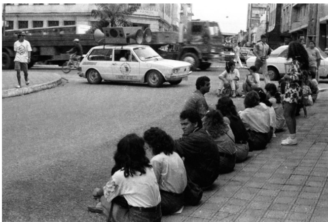
Imagem 04 – professores e funcionários do Sindicato dos trabalhadores (Sintab) de Campina Grande realizam manifestação na frente da prefeitura da cidade reivindicando melhores salários, por Nicolau de Castro.

Se é verdade que, em sua maioria, os estudantes politizados vinham da classe média, é verdade também que eles constituíam uma categoria que pressionava desde o Governo João Goulart, juntamente com as classes operárias, para as mudanças sociais que se faziam necessárias; por isso, a ação repressora aos estudantes foi feita de modo contundente. No dia seguinte ao golpe militar, a União Nacional dos Estudantes – UNE estimulou uma greve geral nas universidades. As lideranças estudantis esperavam o apoio total das esquerdas e dos movimentos populares contrários ao golpe – mas, decididamente, esse apoio não veio (GOMES, 2002, p.23).