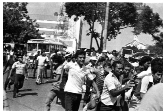
Imagens 14 e 15 – Avenida Floriano Peixoto, em Campina Grande, é alvo de manifestações