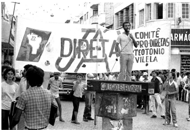
Imagem 06 – Manifestação sindical pelas Diretas Já, em janeiro de 1985, ano da abertura política e, conseqüentemente, fim do regime ditatorial