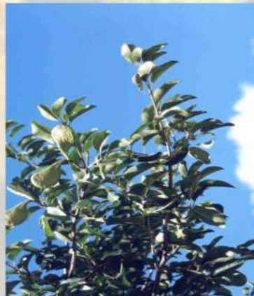
Figura 2. Planta adulta do pereiro (Fonte: 11).

É uma árvore de porte regular, podendo atingir em média 5m de altura (24-25) de tronco bem desenvolvido, ereto, mas não muito grosso podendo chegar de 15 a 20 cm de diâmetro (Figura 2). A copa é normal. A casca é lisa e acinzentada, com lenticelas brancas quando a planta é jovem, e rugosa quando mais idosa; as folhas são ovais, simples, amargosas, glabras ou pilosas; suas flores são pequeninas, de cor clara e possuem um perfume muito agradável que exala no ambiente durante a noite. O fruto é em forma de gota achatada (é conhecido popularmente como “galinha”), de cor castanho-claro, com pequenas verrugas de cor cinza, que comporta cerca de cinco sementes, aladas e planas; a dispersão dessas sementes é feita através do vento. A madeira do pereiro é de cor clara, moderadamente pesada, macia e de fácil trabalho, resistente e muito durável, de textura fina e uniforme (23). A floração ocorre geralmente no início das chuvas, com a folhagem ainda não desenvolvida ou em início de desenvolvimento, sendo, desse modo, de setembro a janeiro. A frutificação vai de janeiro a março (24-26).