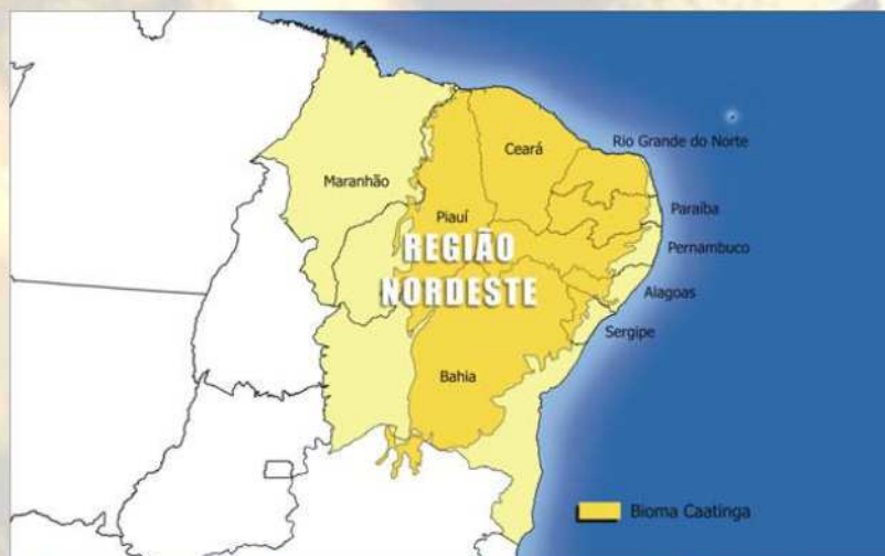
Figura 1. Mapa demonstrando os Estados que o Bioma Caatinga abrange (Fonte: 9).

O Bioma Caatinga é o tipo de vegetação que cobre a maior parte da área da região Nordeste do Brasil com clima semiárido (7). Seu nome é originário da língua tupi-guarani, significa “mata branca”. É um sistema ambiental exclusivamente brasileiro, que ocupa cerca de 11 % do território nacional, num total de 844.453 mil Km 2 , abrangendo os Estados do Ceará, Rio Grande do Norte, Paraíba, Pernambuco, Sergipe, Alagoas, Bahia, Maranhão, Piauí e Norte de Minas Gerais (8) (Figura 1).