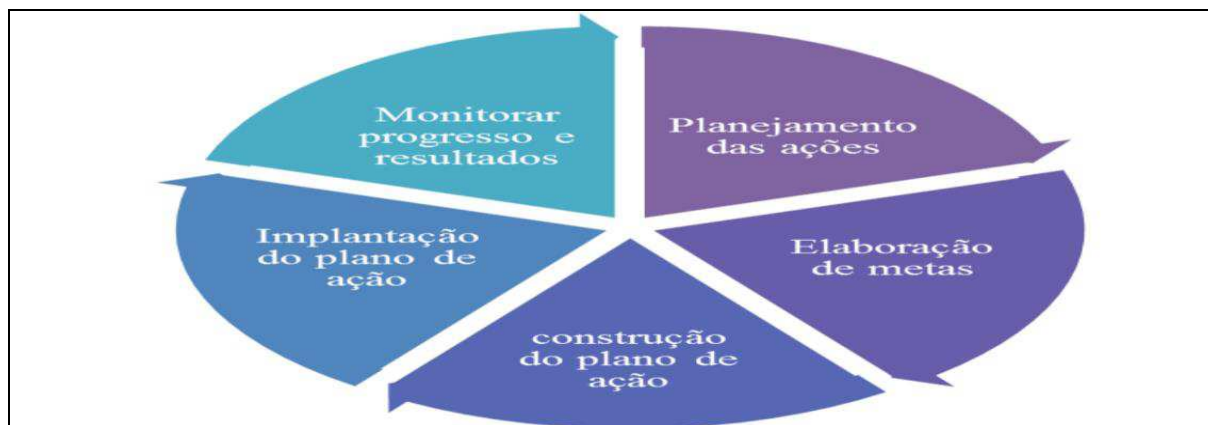
Figura 2-etapas da metodologia de implantação das compras públicas