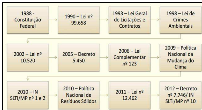
Figura 1-Principais normas e leis brasileiras em relação às compras e contratações públicas sustentáveis