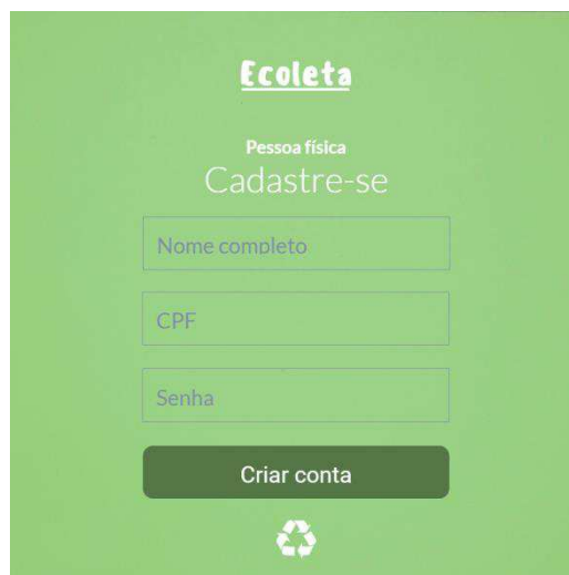
Figura 2 – Guia de Cadastro