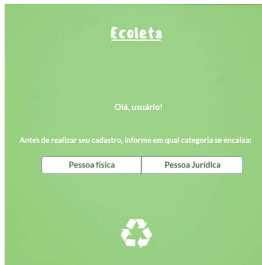
Figura 1 – Guia Inicial