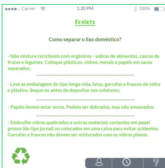
Figura 5 – Guia de Conscientização

Mais um resultado que poderá ser obtido pelo uso do Ecoleta, é o trabalho de conscientização e educação ambiental com os usuários, conforme retratado na Figura 5, pois nem todos estão cientes sobre a importância do controle de resíduos sólidos pela população, já que o descarte deles é algo dinâmico e constante.