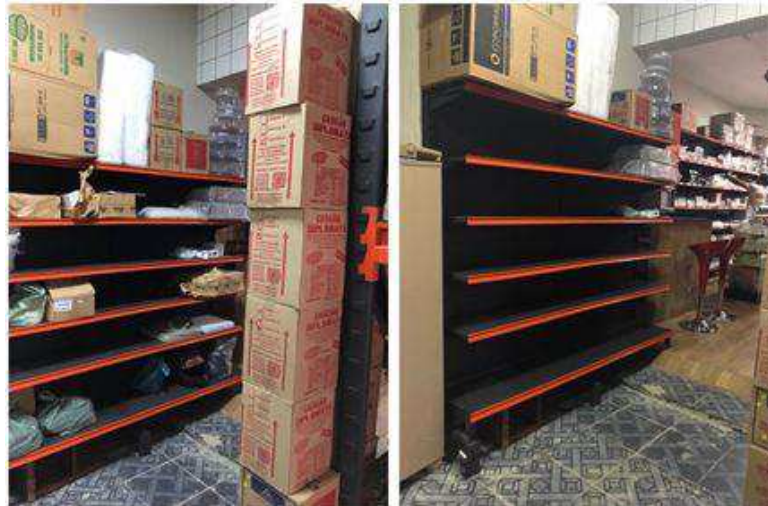
Figura 5 – Limpeza de prateleiras para serem usadas posteriormente

Neste senso ocorreu a ordenação do estoque de acordo com os seguintes critérios: itens mais vendidos, tipos de produtos, tamanho, além do posicionamento de etiquetas nas prateleiras para a definição dos locais específicos de cada grupo de produtos, assim como a limpeza de prateleiras que serão usadas posteriormente com produtos que serão vendidos e ficarão à vista do cliente, como mostra a Figura 5.