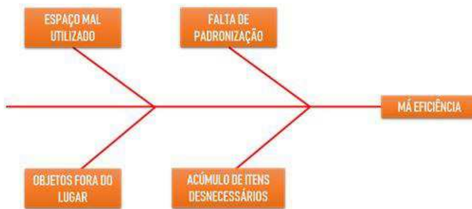
Figura 2 – Diagrama de Ishikawa para a identificação das causas do problema

A princípio utilizou-se o Diagrama de Ishikawa para identificar as causas do maior problema da empresa, onde este foi apontado como sendo a má eficiência dos processos operacionais do empreendimento. As possíveis razões encontradas estão listadas a seguir, especificadas no diagrama ilustrado na Figura 2.