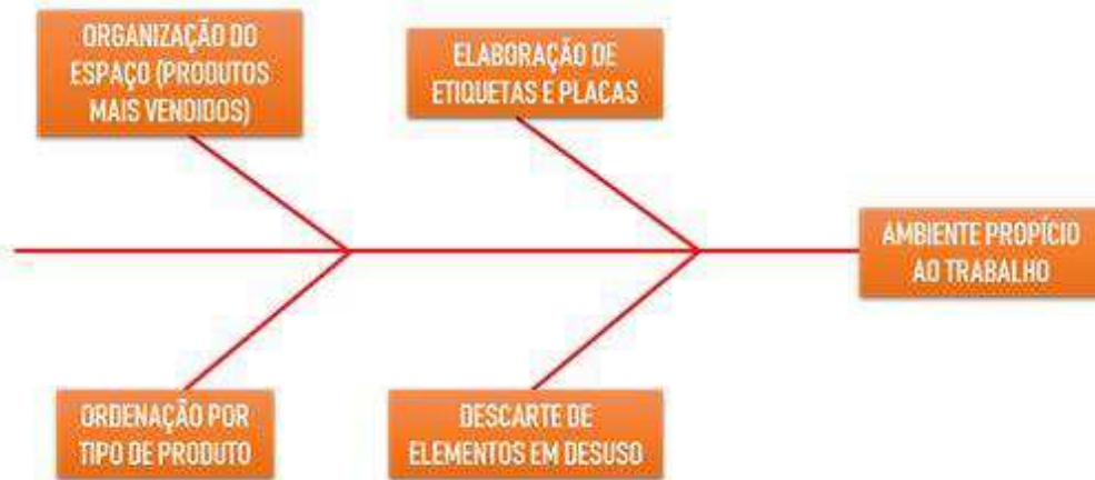
Figura 11 – Diagrama de Ishikawa para análise dos métodos realizados