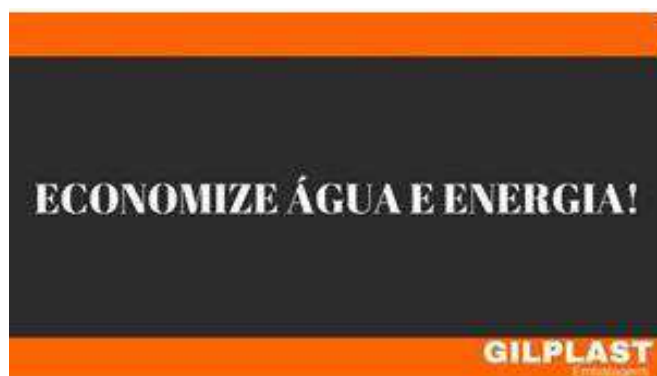
Figura 8 – Placa de conscientização localizada na copa