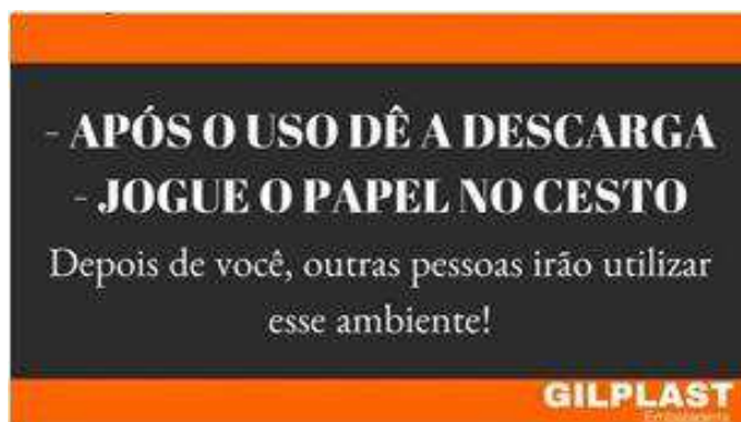
Figura 9 – Placa de sinalização nos banheiros