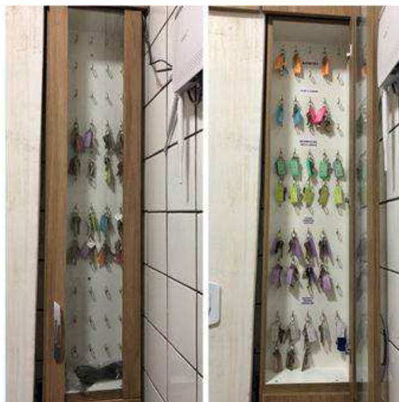
Figura 6 – Quadro de chaves do escritório

A última modificação do senso de ordenação ocorreu no escritório, no qual foi feita a arrumação do quadro de chaves por cor do chaveiro e finalidade, com o intuito de aumentar a produtividade quando houver a necessidade de sua utilização, como apresentado na Figura 6, além da ordenação de objetos que estavam acumulados por todo o ambiente.