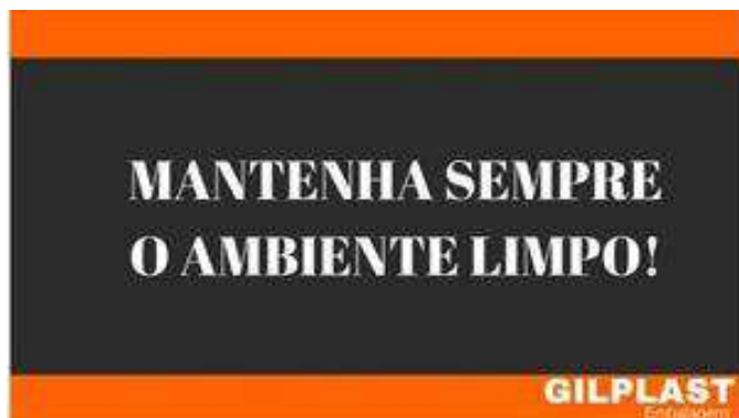
Figura 7 – Placa de conscientização localizada no estoque

Nesta etapa, discutiu-se a importância da limpeza dentro do estabelecimento. Para incentivar a cultura de conscientização e ressaltar a importância de manter o ambiente sempre limpo, que por consequência proporciona um local de trabalho mais agradável, foram expostas placas motivadoras, como mostram as Figuras 7 e 8 a seguir.