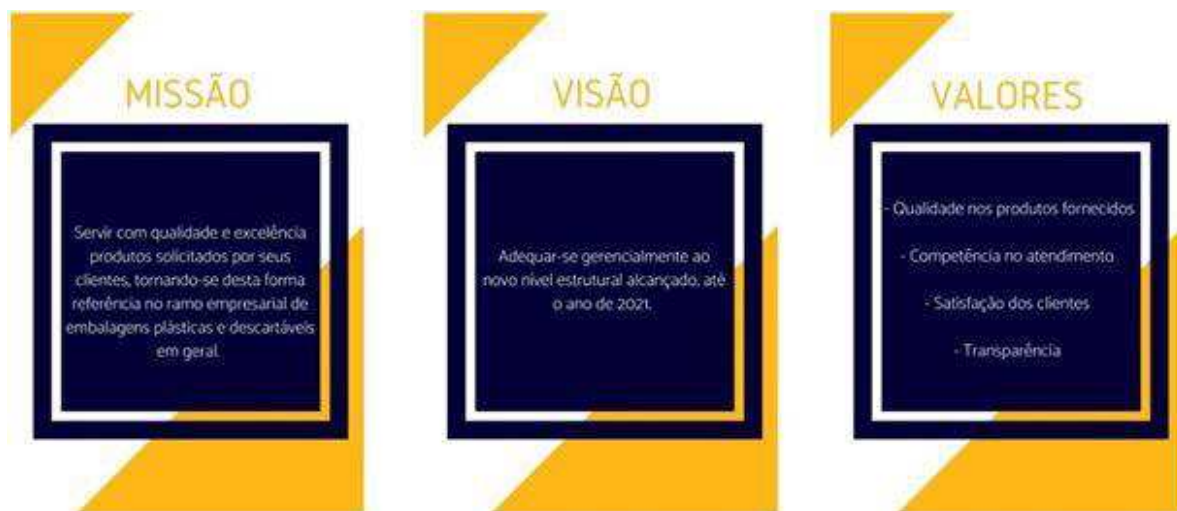
Figura 10 – Missão, valor e valores

Neste senso, há a importância de desenvolver o hábito de perpetuar as etapas anteriores segundo um ciclo. Houve um treinamento de funcionários para esses conhecerem a importância do Programa. Com a finalidade de promover e garantir a cultura organizacional da empresa, levantou-se informações acerca do empreendimento para a criação de missão, visão e valores (demonstrados na Figura 10) e desta forma os colaboradores sentirem-se motivados a dar continuidade ao 5S.