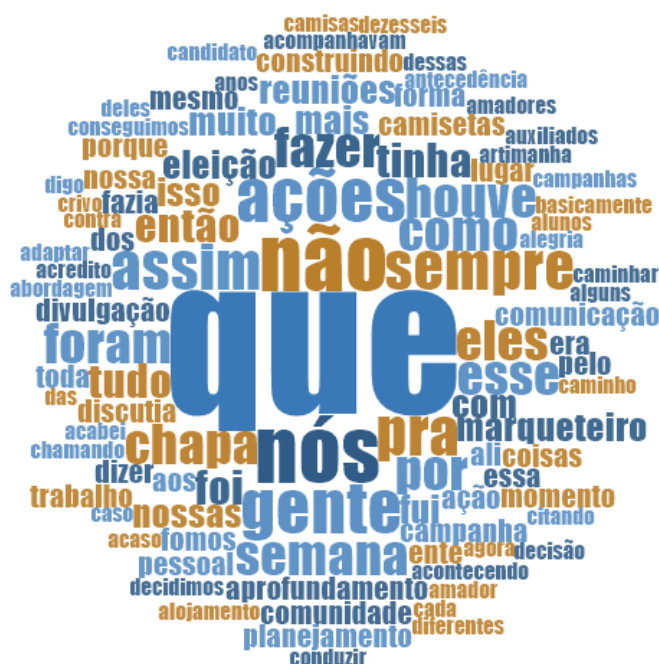
Figura 1 – Nuvem de palavras sobre o planejamento estratégico de marketing político