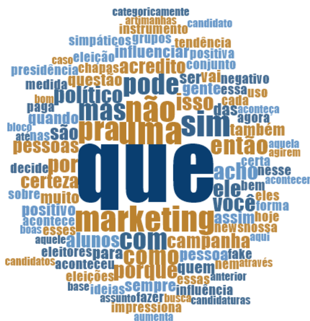
Figura 5 – Nuvem de palavras sobre a influência do marketing político