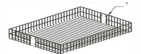
Figura 3 - Desenho Técnico do Produto

Para se dar início ao custo do produto, foi necessário primeiramente saber quanto de matéria prima é utilizada, foi solicitar ao setor de design a vista explodida do produto, para saber o material utilizado. A figura 7 informa os dados necessários: