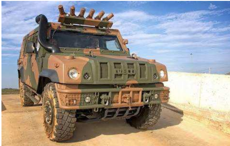
Figura 1: Iveco Lince

Praticamente todas as grandes montadoras mundiais têm viaturas que atenderiam os requisitos técnicos. Propostas foram entregues pela IVECO Latin America contendo ofertas de seus Veículos Multifuncionais Leves (LMV conforme sigla em inglês), pela Avibras envolvendo o Tupi (versão brasileira do Sherpa da Renault Trucks Defense), pela BAE Systems Land Systems South África ofertando o RGvibr32M LTV e pela AM General and Plasan propondo o MLTV-BR. Entretanto, as finalistas do programa foram a Iveco, oferecendo seu Lince LMV e Avibrás em parceria com a Renault Truck Defense oferecendo o Tupi. As figuras 1 e 2 apresentam os modelos da IVECO e da Avibrás, respectivamente.