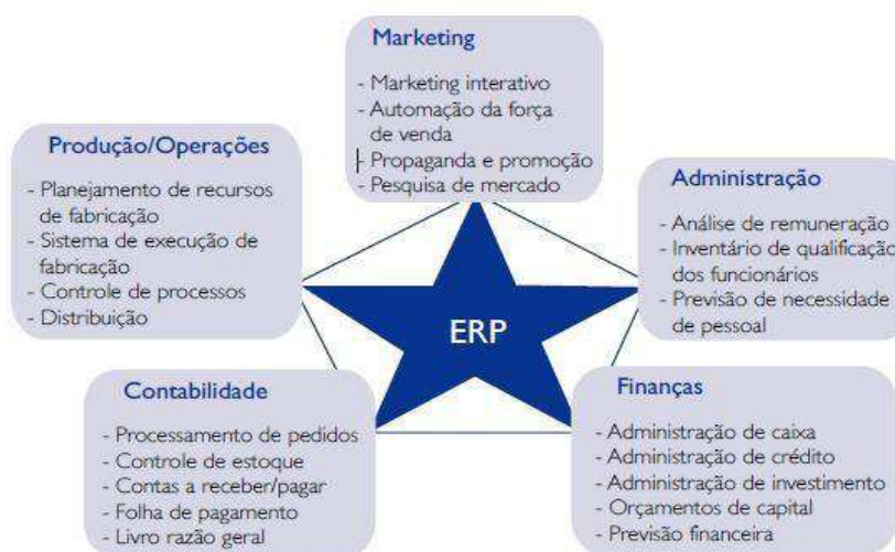
Figura 2 - Integração entre as principais áreas de uma empresa

O ERP é um software que permite a integração das informações que surgem pela empresa, esse sistema determina sua própria lógica à estratégia, à cultura e a à organização da instituição. É uma sistemática que procura atender a todo tipo de companhia e seu projeto reflete uma série de possibilidades sobre como operam as organizações e é preparado para desenvolver as melhores práticas de negócio, porém fica a critério do cliente para definir a melhor prática e atender às suas necessidades (DAVENPORT, 1998). Existem áreas específicas que o sistema ERP interliga, na Figura 2 a seguir são apresentadas as áreas de integração do sistema.