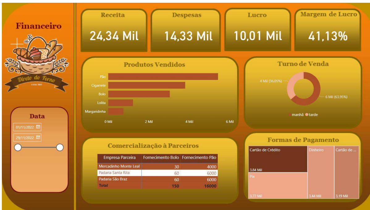
Figura 3. Ilustração do painel referente à análise financeira

também, os produtos mais vendidos e suas respectivas quantidades, além do lucro, margem de lucro, turno de maior concentração de vendas, formas de pagamento e um filtro que permite o usuário acessar os dados de acordo com o período histórico de interesse.