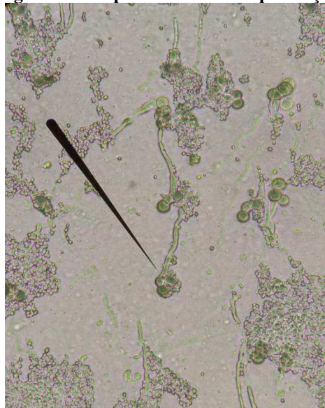
Figura 2 – Morfologia microscópica Candida com presença de blastoconídeos

Os fungos do gênero Candida são da classe Ascomycetes, família Saccharomycetaceae, formando em sua maioria células unicelulares, mas também formam micélios. Como descritos na figura 1, são microrganismos que podem se apresentar morfológicamente, ovais, com ou sem presença de hifas ou pseudo-hifas quando suas formas de brotamentos crescem separadamente, criando cadeias de células alongadas ou contraídas na septação entre células (Sule; Kumurya; Shema, 2019).