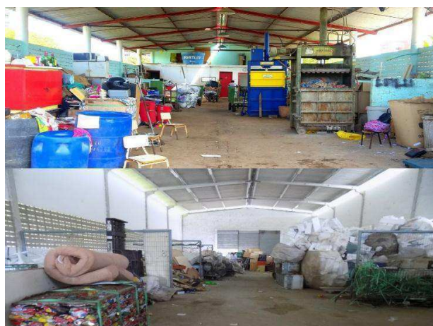
Figura 1. Galpões das associações ASCARE-JP (a) e Acordo verde (b).

A pesquisa foi realizada em duas associações de catadores de materiais recicláveis no município de João Pessoa/PB-Brasil, sendo: ASCARE-JP e Acordo Verde, que atendem aos bairros das zonas norte e sul do município. As referidas associações possuem galpão de pequeno porte, contendo divisores para cada tipo de resíduo, uma sala de descanso e um banheiro para os catadores (Figura 1).