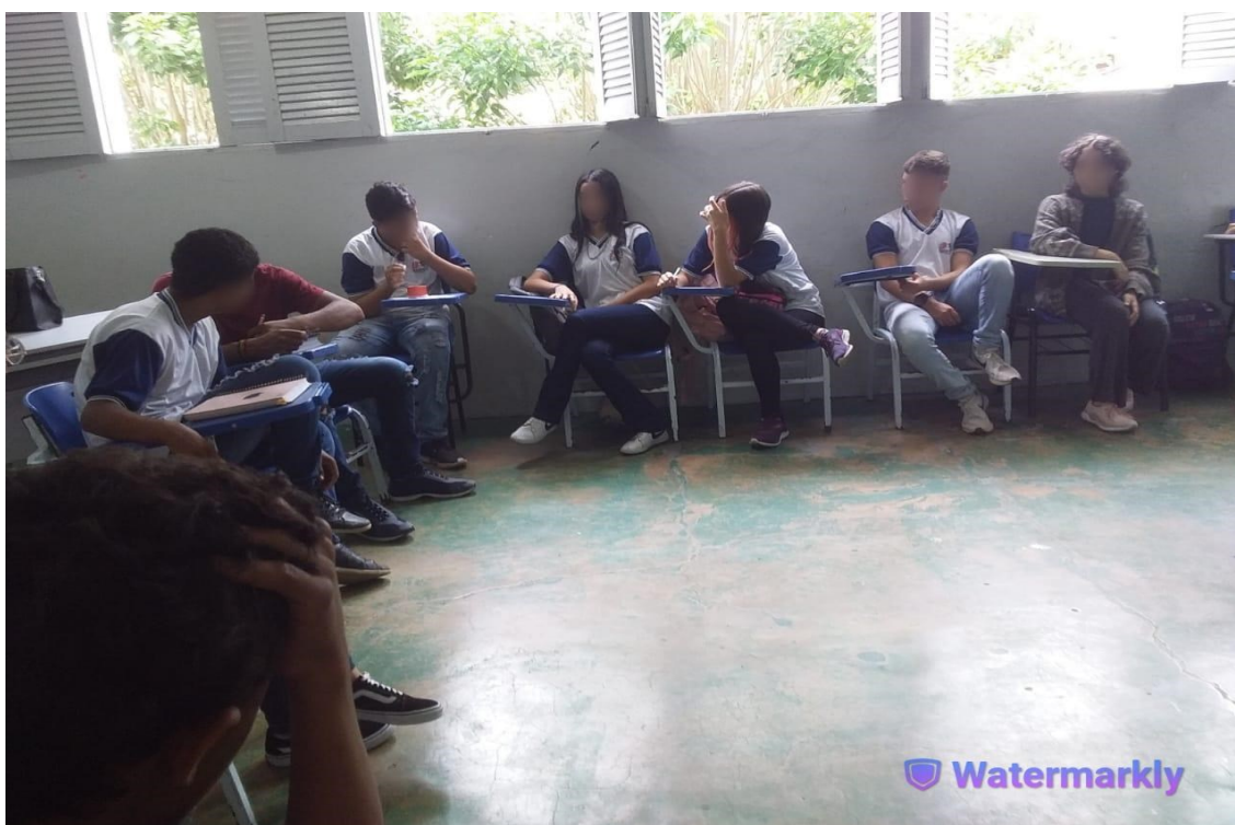
Imagem 3 - Turma multisseriada 8º/9º ano - turno da manhã