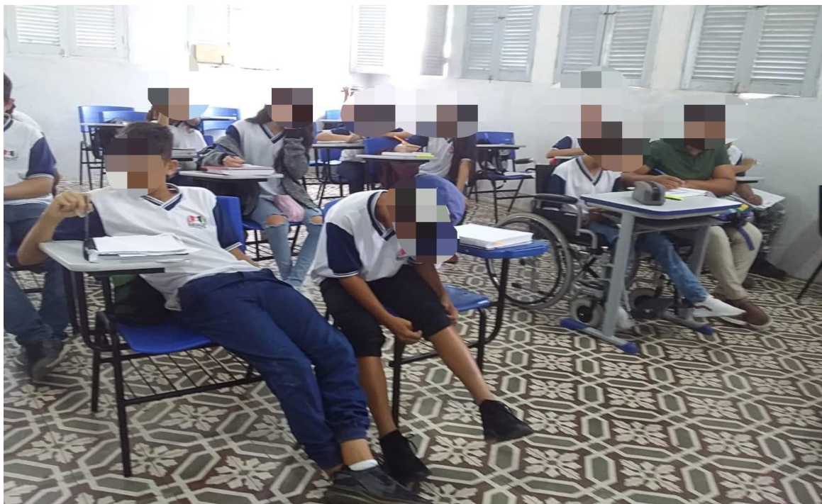
Imagem 2 - Turma multisseriada 6º/7º ano - turno da manhã