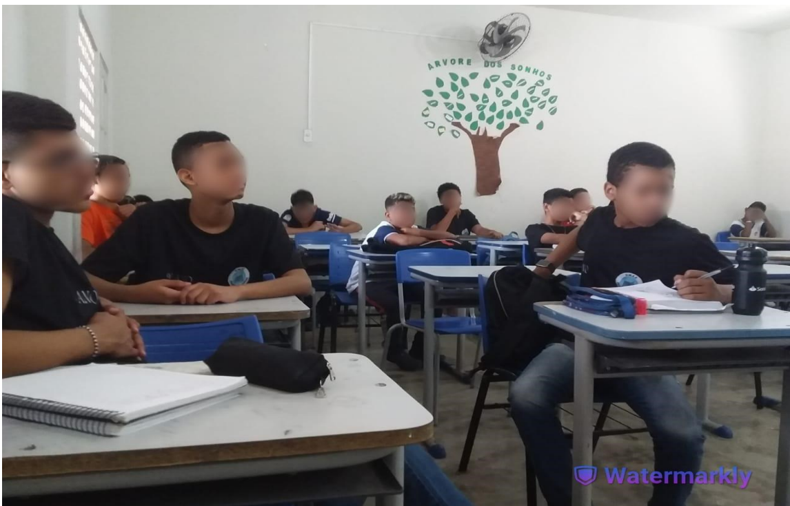
Imagem 5 - Turma multisseriada 8º/9º ano - turno da tarde