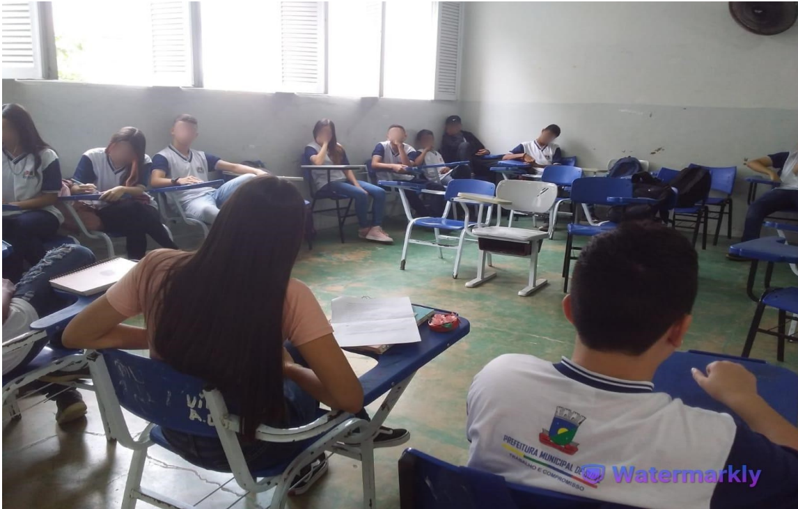
Imagem 4 - Turma multisseriada 8º/9º ano - turno da manhã (mesma turma da imagem 4)