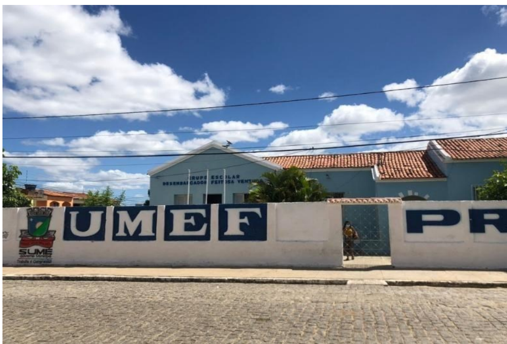
Imagem 1 - Localização da escola Presidente Vargas

A seguir, vejamos uma foto da Escola Presidente Vargas: