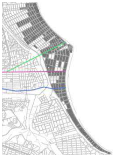
Figura 4: Mapa com as quadras ocupadas entre 1960 e 1974, identificadas no levantamento do ARCEN/PMJP. Edição nossa sobre base cartográfica atual da PMJP.

Vai contribuir com a intensificação da ocupação da Orla Marítima, porém não ao ponto de uma consolidação e para que esses bairros perdessem o caráter de veraneio.