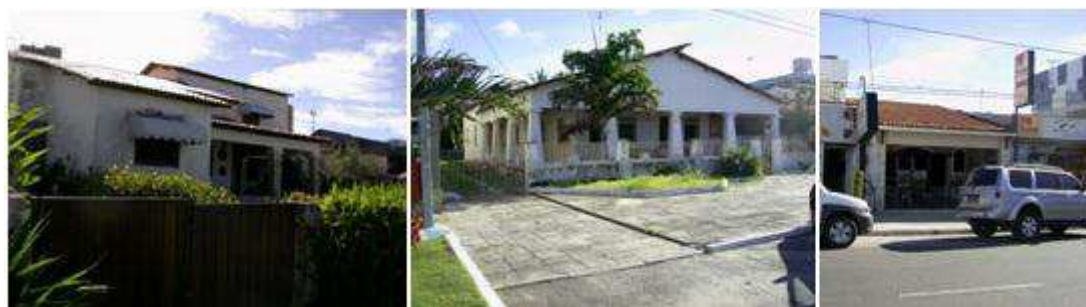
Figura 1: casas remanescentes do período de ocupação inicial da orla marítima, nas proximidades do núcleo original de Santo Antônio, atualmente Baixo Tambaú.

Dividido em três núcleos que posteriormente originaram os atuais bairros, a orla era composta da Praia de Cabo Branco, das comunidades Santo Antônio (onde hoje é o bairro de Tambaú) São Gonçalo e Maceió(atualmente Manaíra). Nesse período o trecho que tem mais construções é a comunidade de Santo Antônio, próximo a Igreja de Santo Antônio, (no bairro de Tambaú). Exemplares remanescentes desse período inicial de ocupação ainda podem ser vistos nos bairros e proximidades do núcleo da Igreja Santo Antonio; eram em geral construções com telhado em duas águas, implantadas em lotes estreitos e compridos, com alpendres circundando a construção ou marcando a entrada.