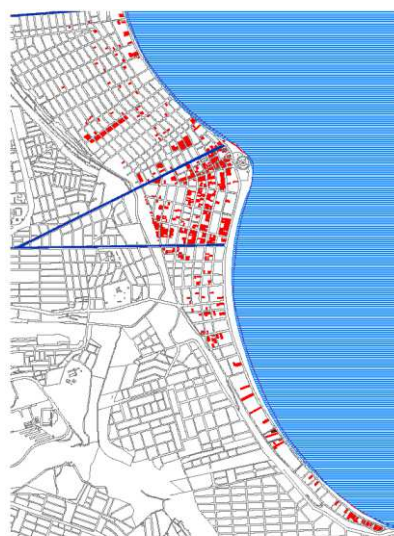
Figura 6: lotes ocupados entre 1960 e 1974, de acordo com levantamento do ARCEN/PMMP. Edição nossa em base cartográfica atual da PMJP.

Franca, explicando que essas casas representavam uma melhor imagem da praia, “que não eram aquelas caiçaras miseráveis, e que dariam uma boa impressão ao turista”. No documento de levantamento de 1969, encontrado por nós no ARCEN, já está implícita a intenção da remoção de edificações precárias. A planta indica os edifícios mais recentes e indica o grupo de habitações em frente a futura implantação do Hotel como “casebres de palha”. O turismo é uma grande aposta do governo, por isso também o cuidado com a imagem da praia, na imprensa os anúncios de atividades para o Hotel ainda em construção.