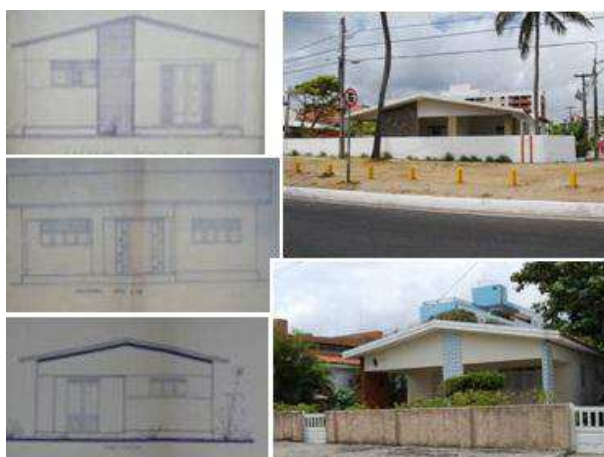
Figura 5: Residências com aparência de Conjunto Habitacional de baixa renda, descartadas na coleta.

A Orla Marítima vai sendo aos poucos edificada com ajuda do governo e de ações de particulares, mas principalmente pelo interesse de uma classe média que paraibana que vê nesses empreendimentos uma viabilização para o lazer sazonal. E que já consolidara esse uso na Orla Marítima.