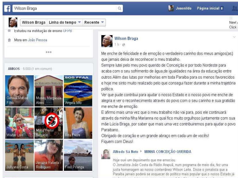
Figura 16: Publicação de Wilson sobre o reconhecimento político