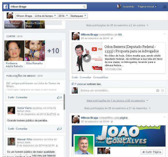
Figura 20: Deputados apoiados por Wilson em 2014.