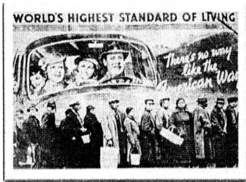
Louisville, Kentucky, 1937.