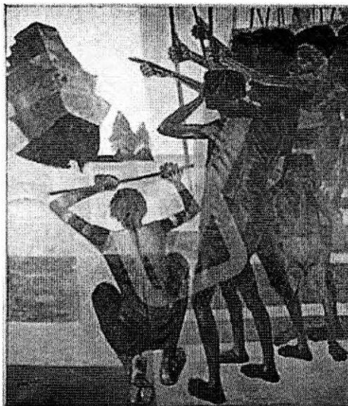
PORTINARI, C. O descobrimento do Brasil. 1956. Óleo sobre tela, 199 x 169 cm

Disponível em: www.portinari.org.br . Acesso em: 12 jun 2013.