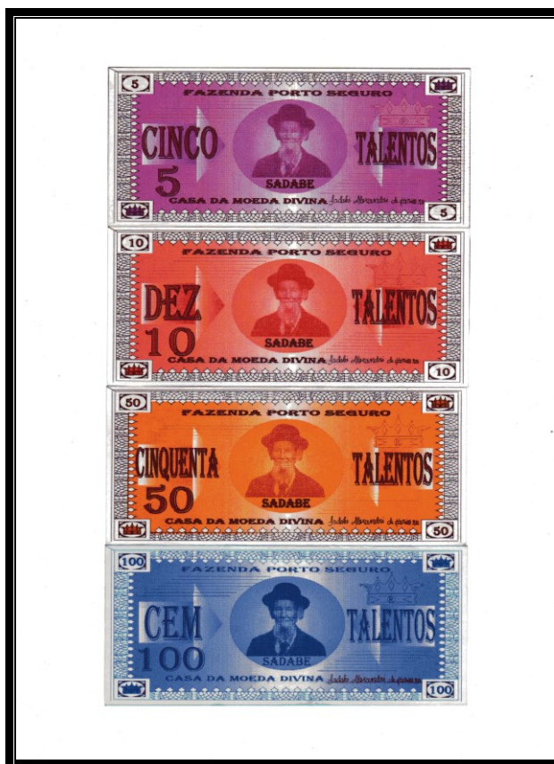
Figura 5: Talento

Uma outra diferença entre estes dois líderes encontra-se no comportamento sexual. Tendo em vista que Antônio Conselheiro, assim como D. Sebastião 17 , vivia uma vida celibatária, tentando manter distância das tentações da carne; Meu Rei não tinha o celibato como algo necessário para se alcançar a divindade, uma vez que dividia seu palácio com sete moças. 18 Necessário registrar que esta informação carece de aprofundamento, seja do ponto de vista de abordagens etnográficas, seja do ponto de vista de reflexões sobre concepções sexuais de caráter religioso.