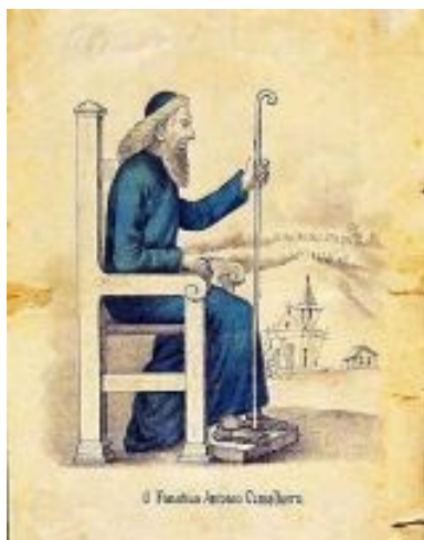
Figura 3: Antônio Conselheiro

ordens mendicantes, Meu Rei vestia-se de forma simples e despretensiosa, o único adorno presente nos dois era o cajado.