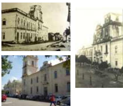
Figura 05: O Colégio em três momentos distintos; Acima à esquerda, o Conjunto em 1890; abaixo, vista em 2007; e à direita foto de 1923.

Constatou-se como se deu a inserção das edificações no núcleo urbano, levando em consideração as iconografias disponíveis e os relatos de cronistas das épocas. O distanciamento inicial da Igreja de São Gonçalo do núcleo urbano no século XVI, por questões estratégicas para a catequese, transformou-se em meados do século XVIII, quando passou a ter seu entorno edificado, embora escassamente, e em meados do século XIX, já envolvido pela malha urbana.