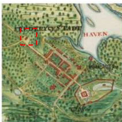
Figura 01: Mapa “Frederica Civitas”, com a Igreja de São Gonçalo em destaque.

É evidente a participação dos padres da Companhia de Jesus na conquista da Capitania