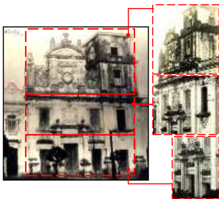
Figura 02: Igreja de Conceição dos Militares no ano de 1923, com elementos em destaque.

Pouco se sabe sobre a sua planta, com exceção de que ocupava o terreno que cedeu lugar ao jardim lateral do Palácio do Governo e, segundo a bibliografia consultada, possuía apenas uma nave e um único altar (LEITE, 1950: 357). Em 1736 foram iniciadas as obras de sua remodelação, com seu interior ganhando novas imagens e um estrado de madeira na capela-mor, enquanto seu exterior recebia um rebuscado frontispício adornado por volutas; as obras foram concluídas em 1754.