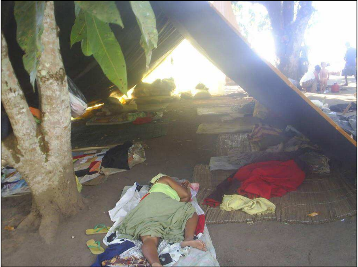
Figura 3: Última retomada territorial da Mata da Cafurna (2008)