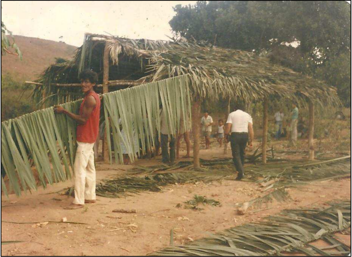
Figura 2: Primeira reconquista territorial (1979)