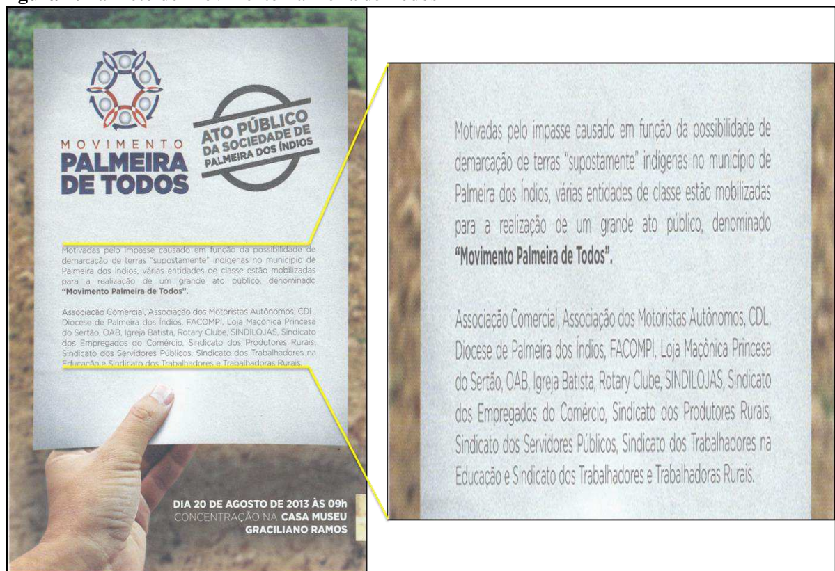
Figura 4: Panfleto do Movimento Palmeira de Todos

Para ampliar a visibilidade dos conflitos, entidades, associações, sindicatos e políticos organizaram o Movimento Palmeira de Todos no dia 20 de agosto de 2013, dia da comemoração da emancipação política do município. A concentração do movimento foi em frente ao Museu Graciliano Ramos, ponto turístico da cidade e representativo da História de Palmeira dos Índios. A escolha do dia foi estratégica, pois a cidade atraía pessoas de várias regiões para prestigiarem os desfiles cívicos das escolas municipais e estaduais e consequentemente compareceriam ao movimento. Os representantes do movimento distribuíram panfletos, figura 4, e seus discursos foram transmitidos pelas rádios locais, o objetivo era obter o apoio da população e convencê-la que a demarcação era imprópria ao município, impor medo aos indígenas e pressionar o Governo Federal a paralisar o processo.