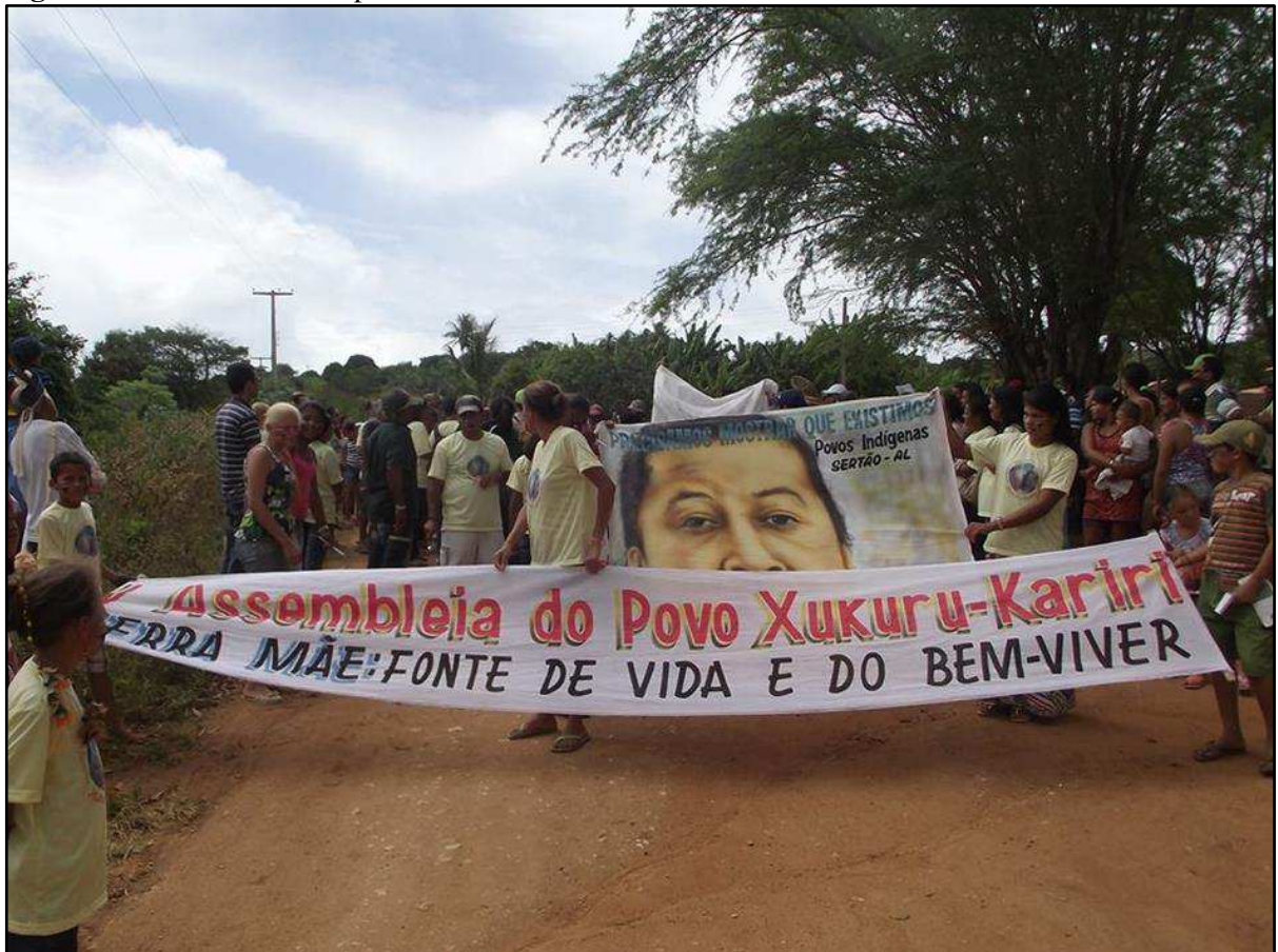
Figura 5: V Assembleia do povo Xukuru-Kariri

A reinvidicação dos Xukuru-Kariri era buscar junto à sociedade envolvente uma justiça social para todos, obtendo o direito ao território tradicional como definiu a Constituição Federal do Brasil de 1988 e a Organização Internacional do Trabalho/OIT que seguiram a mesma perspectiva na ideia de que os indígenas possuem uma relação especial com terra, envolvendo aspectos sociais, econômicos e culturais. Com o intuito de expor como se constituíam as assembleias, a imagem a seguir exprime parte das pessoas que fizeram parte da V assembleia Xukuru-Kariri, com cartazes que traziam referências as lideranças (figura 5).