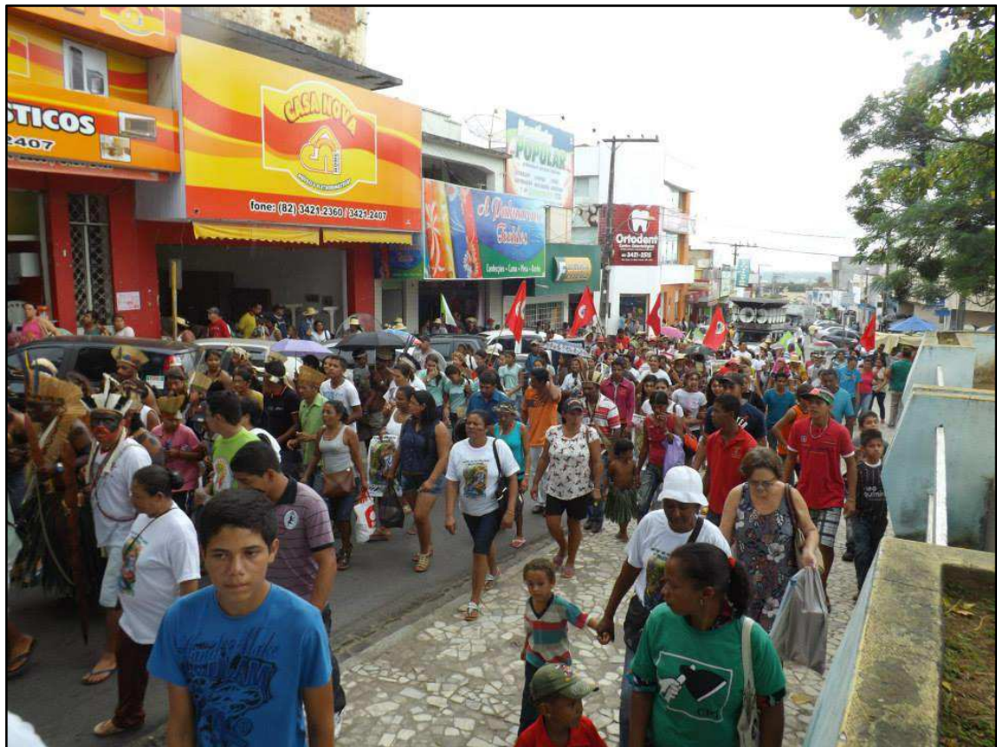
Figura 6: Movimento Grito dos Excluídos

Na imagem a seguir, figura 6, identificamos o momento em que a mobilização tomou as ruas da cidade. A população envolvente se misturava ao movimento e acabava aderindo a reivindicação. Uma caminhada pacífica e democrática, pois todos tinham direito de exercer sua cidadania e solicitar uma postura dos órgãos públicos na efetivação dos direitos; os participantes tinham vozes ativas.