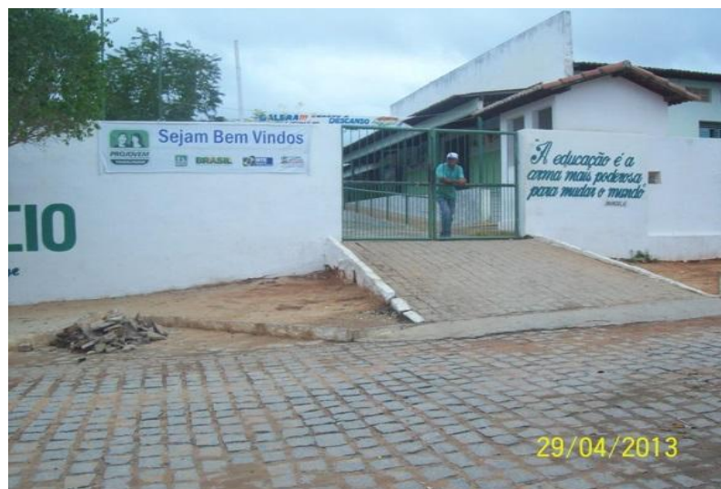
Fotografia 02 - Frente da escola Senador José Gaudêncio

A Escola Estadual de Ensino Fundamental e Médio Senador José Gaudêncio, está localizada na Rua Boa Ventura, s/n, no centro do município de Serra Branca – PB. É uma escola de rede estadual: