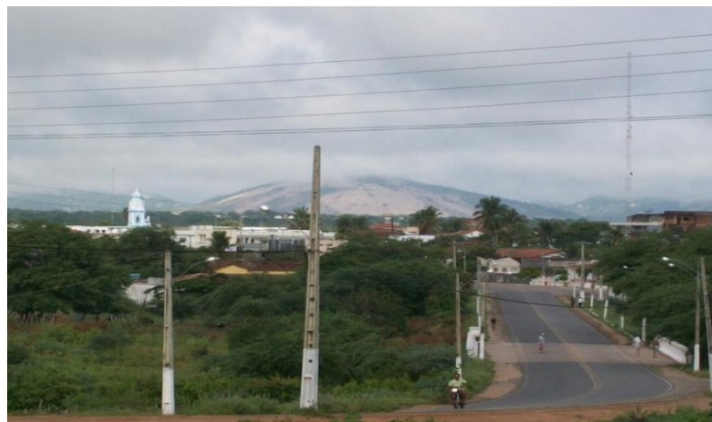
Fotografia 1 - Entrada da cidade de Serra Branca - PB

Serra Branca possui esse nome por situar a maior pedra branca contínua da América Latina, como é possível perceber na imagem a seguir: