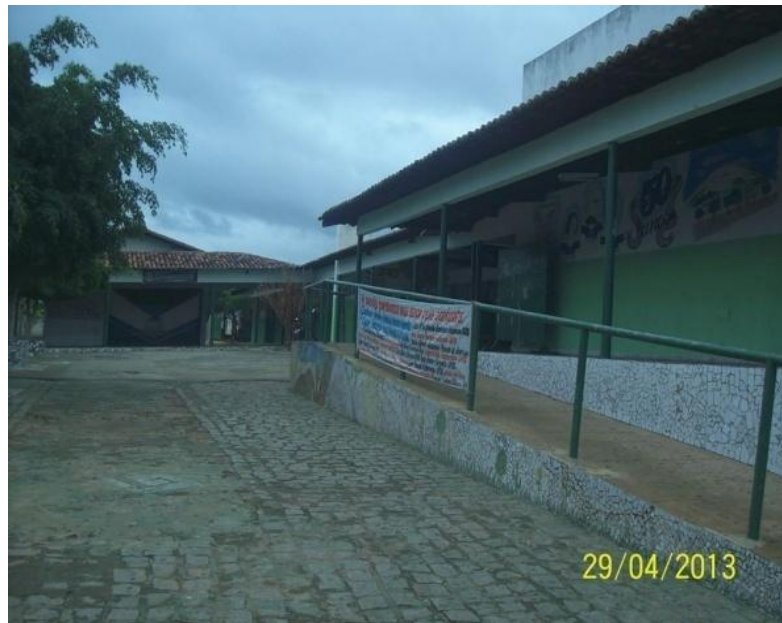
Fotografia 03 – Interior da escola Senador José Gaudêncio