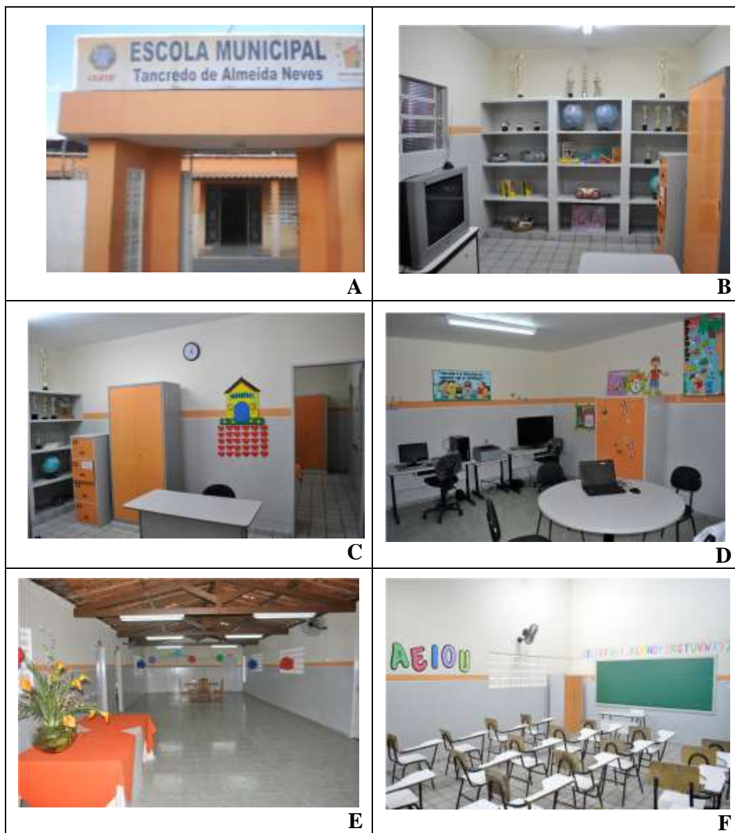
Figura 3.1: (A) Vista frontal. (B) e (C) Secretaria. (D) Sala de Atendimento Educacional Especializado. (E) Espaço de convivência. (F) Sala de aula 2 .

dezenove computadores, três impressoras, dois aparelhos de Data Show, uma caixa de som, dois microfones sem fio, uma filmadora, dois freezers, um fogão e uma geladeira. Na Figura 3.1, esboçamos algumas fotos que dão uma visão geral sobre a estrutura física da escola.