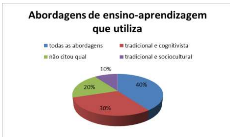
Gráfico 4.2: Abordagens de ensino utilizadas pelos respondentes em suas práticas pedagógicas.

Para a pergunta 8 “Você utiliza alguma dessas abordagens de ensino e aprendizagem em sala de aula?” (Gráfico 4.2). Todas as docentes (100%) responderam que sim. Destes, 40% responderam que utilizam todas as abordagens, 30% responderam tradicional e cognitivista, 20% não responderam qual abordagem e 10% responderam tradicional e sociocultural.