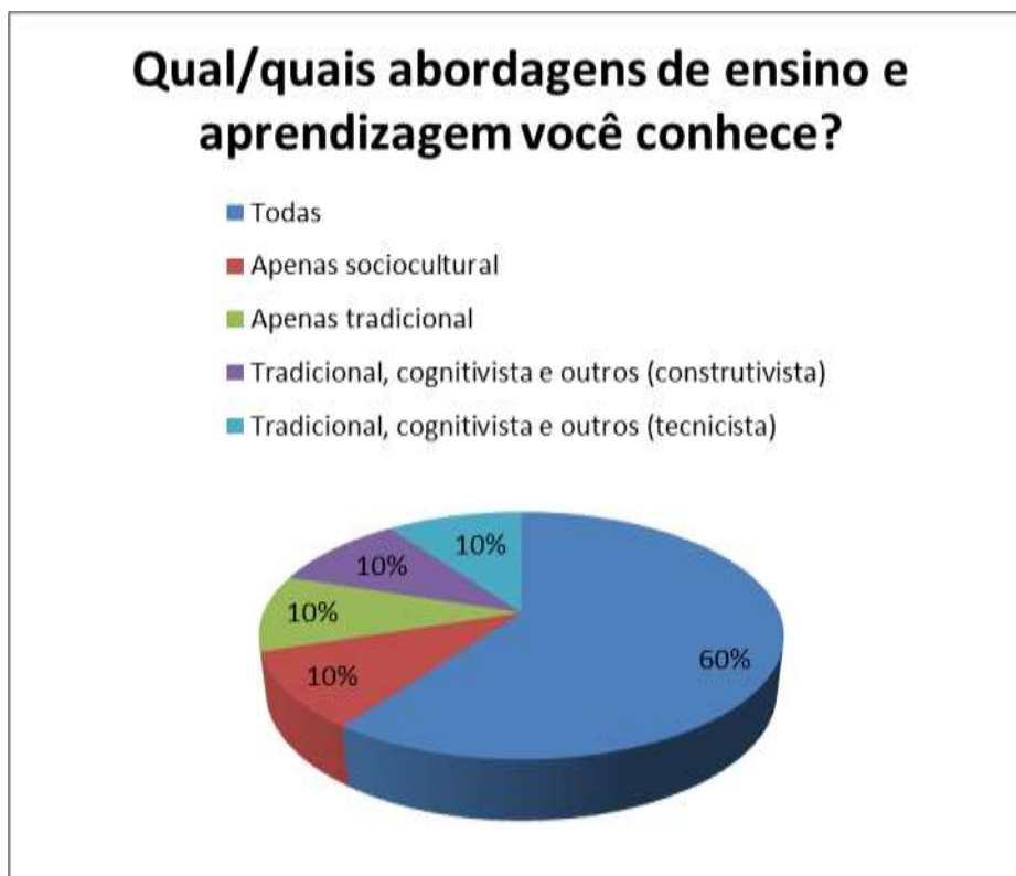
Gráfico 4.1: Abordagens de ensino e aprendizagem conhecidas.

marcaram todas as abordagens, 10% assinalaram apenas a sociocultural, 10% marcaram apenas a tradicional, 20% marcaram a tradicional, cognitivista e outros. Sendo que, destas, 10% responderam em outras: construtivista 3 e 10% responderam tecnicista 4 .