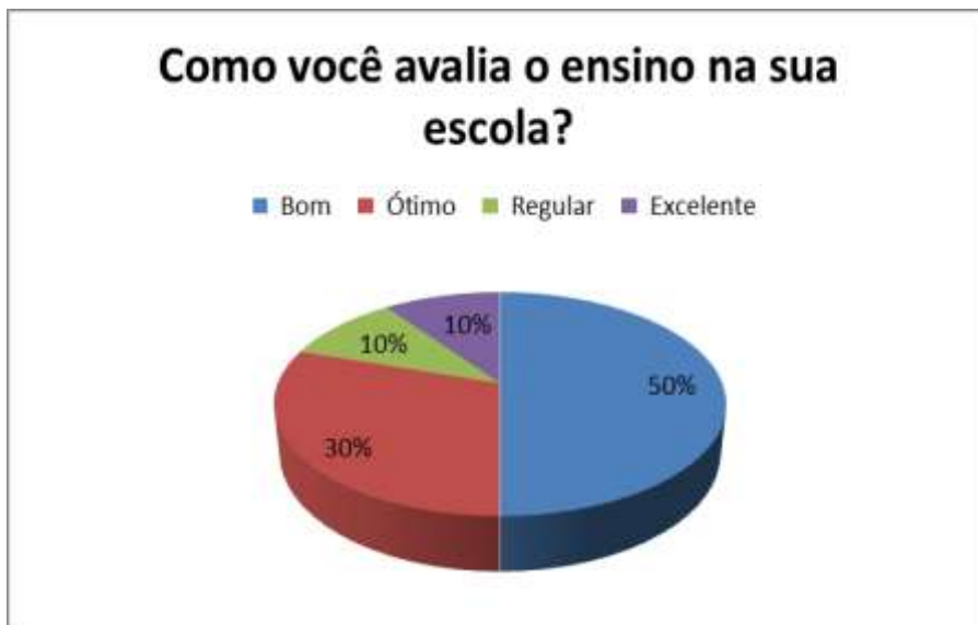
Gráfico 4.5: Respostas das professoras sobre a avaliação do ensino na escola.

Para a pergunta 17 “Como você avalia o ensino na sua escola?” (Gráfico 4.5), deveriam assinalar: excelente, ótimo, bom, regular ou ruim. 50% responderam que é bom, 30% responderam ótimo, 10% responderam regular e 10% responderam excelente.