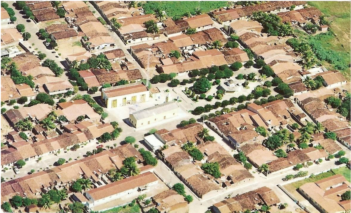
Foto 1 Vista panorâmica do município de Carrapateira/PB

Fonte: Arquivo da Prefeitura Municipal de Carrapateira/PB