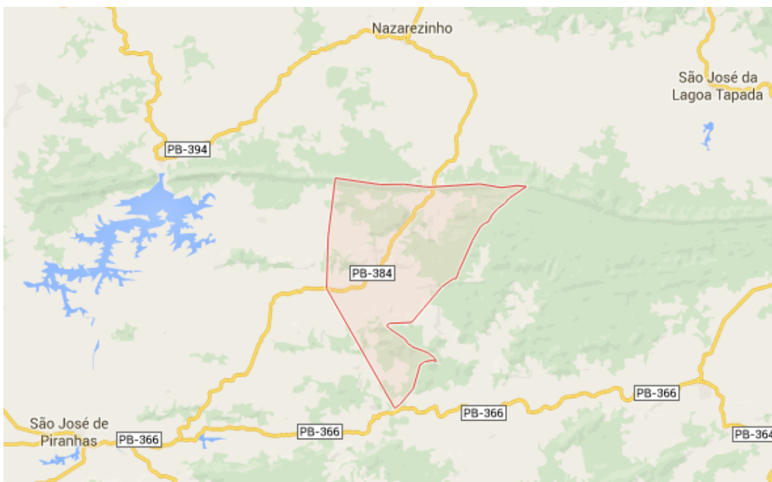
Figura 1: Mapa de localização do município de Carrapateira/PB

Conforme Plano de Contingência Municipal 2013/2016, o município de Carrapateira está localizado na região Oeste do Estado da Paraíba, limitando-se a Oeste e Sudoeste com São José de Piranhas, a norte Nazarezinho e a Leste e Sudeste Aguiar. Ocupa uma área de 54,7km 2 . Inserida nas folhas Sousa/PB (SB.24-Z-A-V) e Itaporanga (SB.24-Z-C-II), escala 1:100.000, editadas pelo MINTER/SUDENE em 1972. Os limites do município podem ser observados no Mapa de Recursos Minerais do Estado da Paraíba, na escala 1:500.000, resultante do convênio CPRM/CDRM, publicado em 2002. A sede municipal apresenta uma altitude de 380m e coordenadas geográficas de 38°20' 38'' longitude oeste e 07° 02' 20'' de latitude sul.