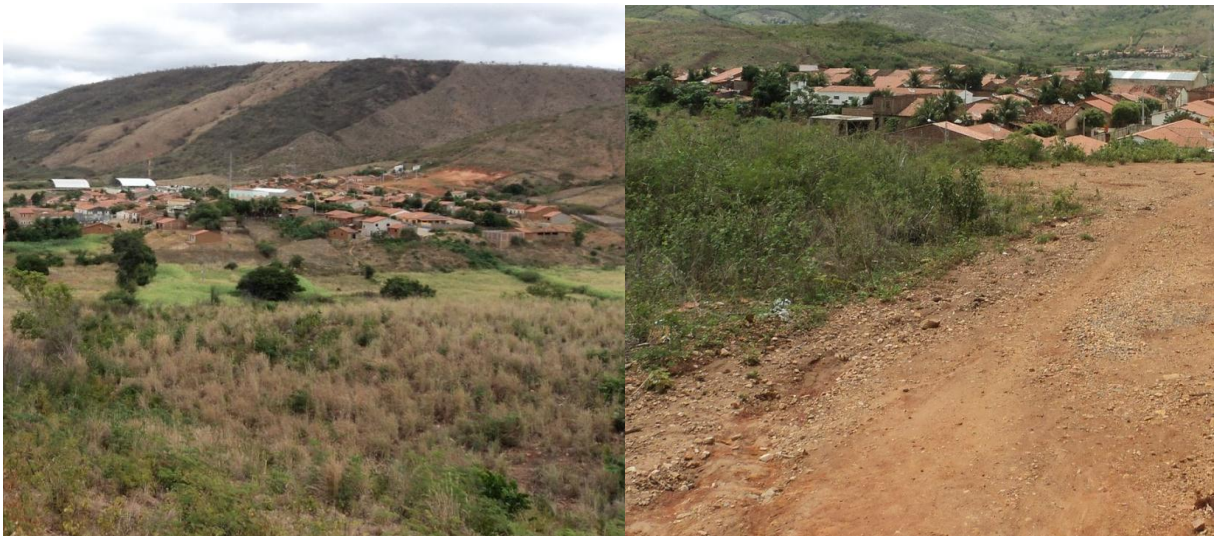
Foto 2 Paisagem dos arredores da zona urbana de Carrapateira/PB

durante o período das secas. O regime pluviométrico é baixo e irregular com médias em torno de 800 mm/ano. Devido às variações dos fatores climáticos, podem ocorrer oscilações com valores para cima ou para baixo do intervalo referenciado. No geral caracteriza-se pela presença de apenas duas estações, sendo uma o período seco que constitui o verão, cujo clímax é de Setembro a Dezembro e outra o período chuvoso denominado pelos munícipes de inverno.