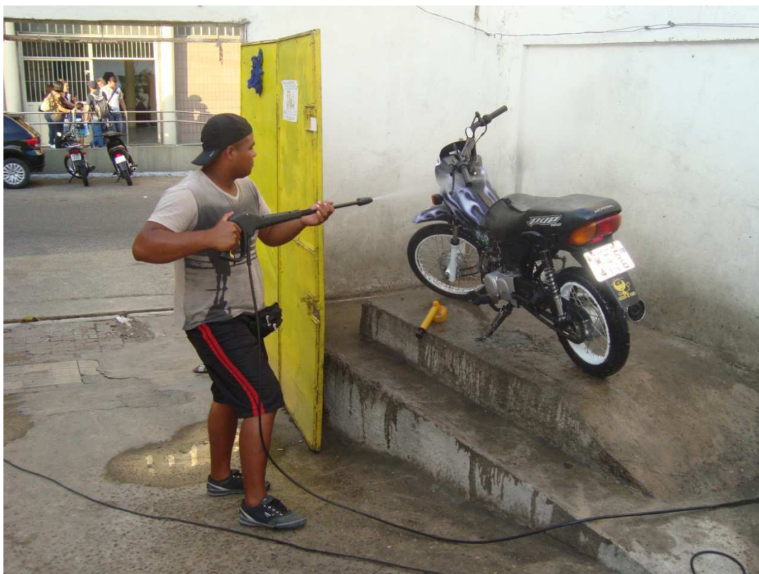
Foto – 10 Local alugado para motos

Isso demonstra que o grupo já tem uma articulação interna que permite assumir compromisso de aluguel que aponta para possibilidades distintas do que ocorre nos demais pontos analisados.