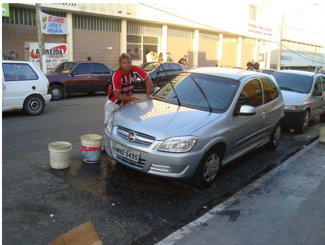
Foto 3: “Flanelinha” exercendo suas atividades: “olhada” e lavagem