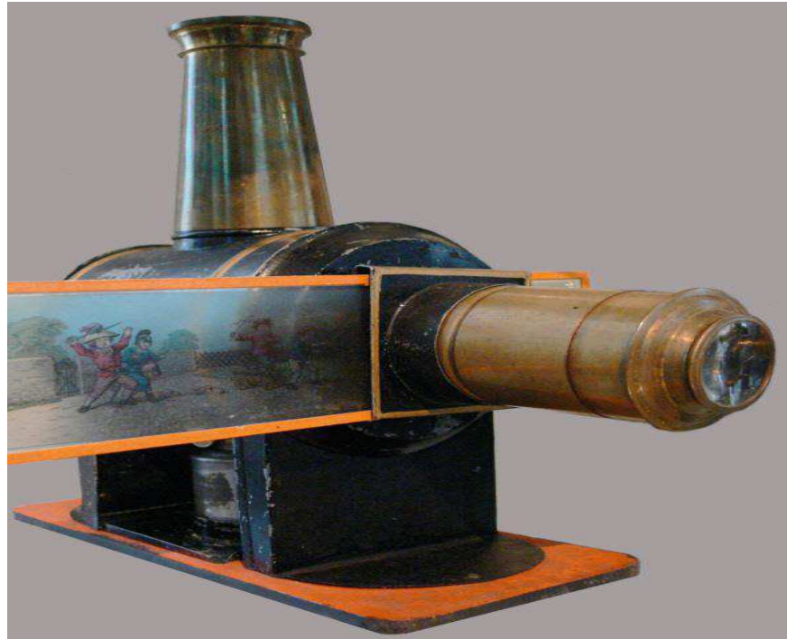
Figura 01 - Lanterna mágica Aulendorf