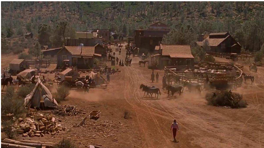
Figura 05 – Organização da cidade, 1885