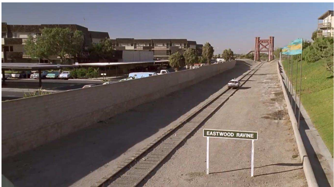
Figura 08: Linha férrea, Eastwood Ravine, 1985.