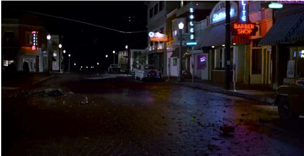
Figura 06 – Organização da cidade, 1955