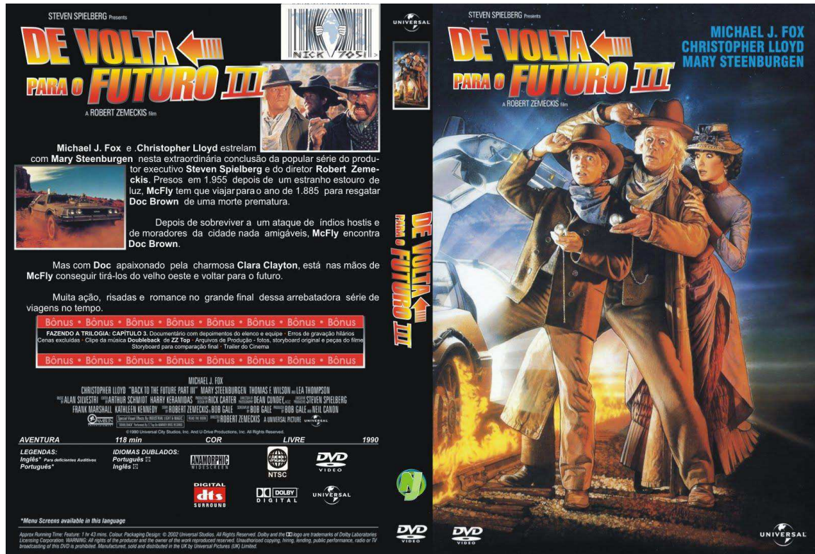
Figura 04 – Filme: De volta para o futuro III