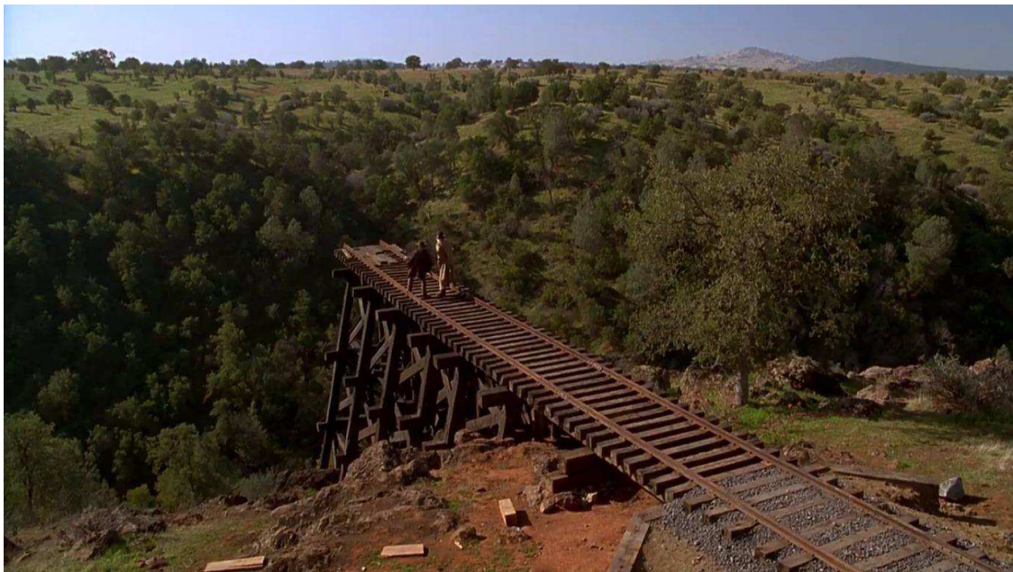
Figura 07: Linha férrea, Eastwood Ravine, 1885.