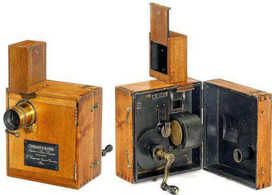
Figura 02 - Cinematógrafo

Fonte: FERNANDES, Luciano 2 Invenção que filmava e tirava fotos