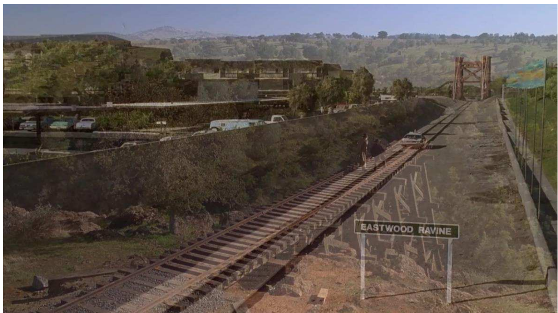
Figura 09 – Sobreposição das figuras 07 e 08

8