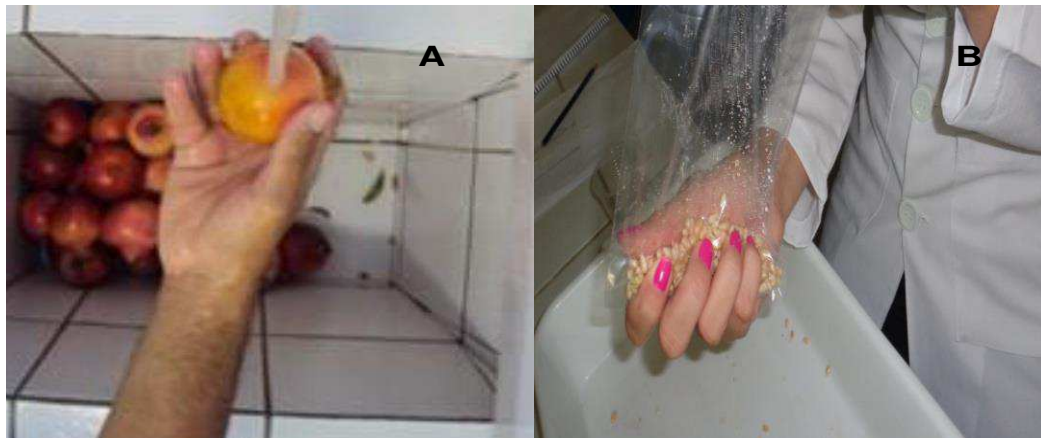
Figura 4: Lavagem dos frutos (A), extração do suco (B).

sanitizados com solução de hipoclorito de sódio a 100ppm de cloro livre por quinze minutos e secos a temperatura ambiente (Figura 4.A). Os arilos foram separados da semente por prensagem manual em saco plástico de polietileno (Figura 4.B). Posteriormente, o volume de suco extraído dos arilos foi utilizado para as análises. Para as análises de antioxidantes, o suco foi mantido em recipiente fechado envolto com papel alumínio, sendo mantidos congelados em freezer até a realização das análises.