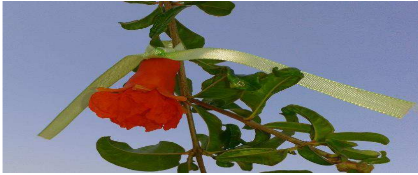
Figura 2: Marcação das flores, Sousa-PB, 2014.

Após os frutos atingirem as idades preestabelecidas realizou-se a colheita dos mesmos no período da manhã. Foram realizadas 5 coletas em distintas épocas num intervalo de dez dias. Assim foram colhidos e analisados frutos aos 60, 70, 80, 90 e 100 após a antese (Figura 3).