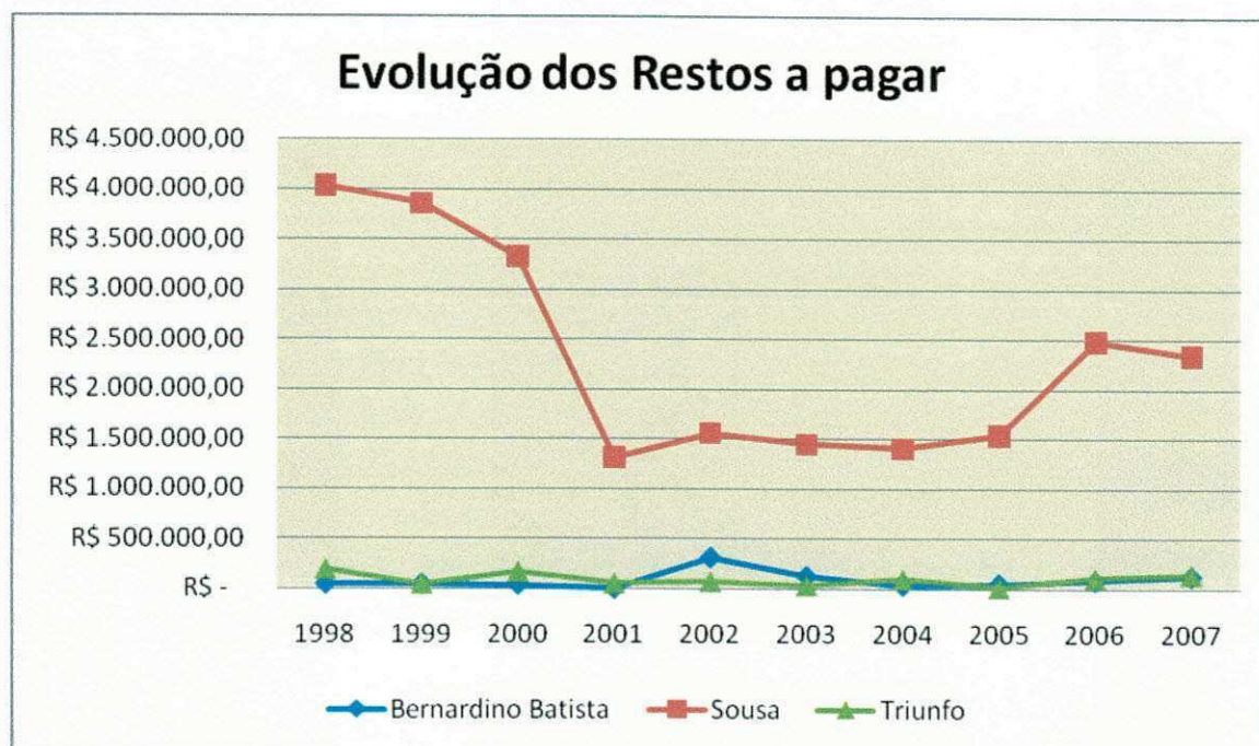
Gráfico 2 Evolução dos Restos a Pagar Município de Bernardino Batista, Sousa e Triunfo Período: 1998 a 2007

O Gráfico 2 a seguir, permite uma melhor visualização da evolução dos Restos a Pagar Processado dos municípios em estudo.