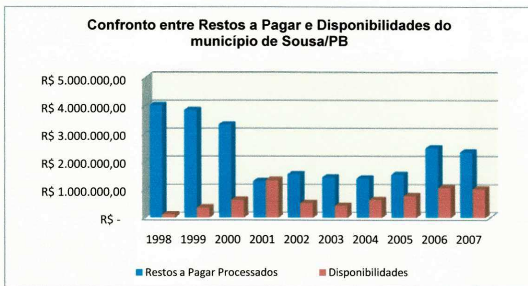
Gráfico 4 - Confronto: Restos a Pagar X Disponibilidades Município de Sousa - Período: 1998 a 2007

O Gráfico 4 a seguir traduz melhor os números representados na tabela 2 em relação aos Restos a Pagar Processados e as Disponibilidades do município de Sousa/PB.