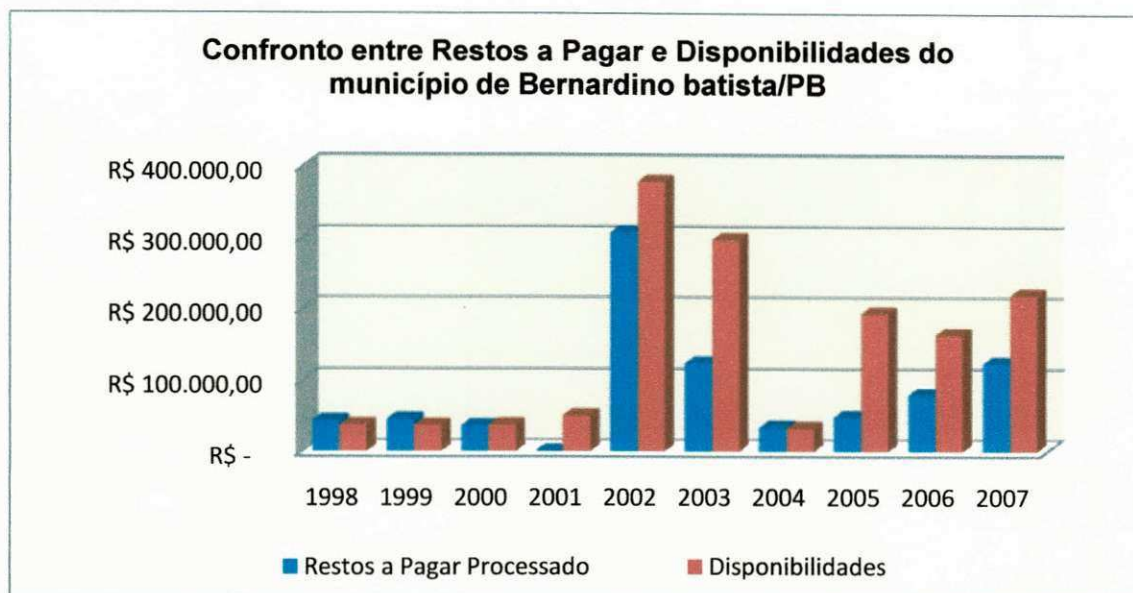
Gráfico 3 - Confronto: Restos a Pagar X Disponibilidades Município de Bernardino Batista/PB - Período: 1998 a 2007