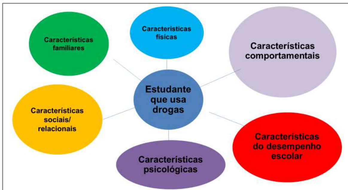
Figura 4. Características dos/as estudantes que usam drogas