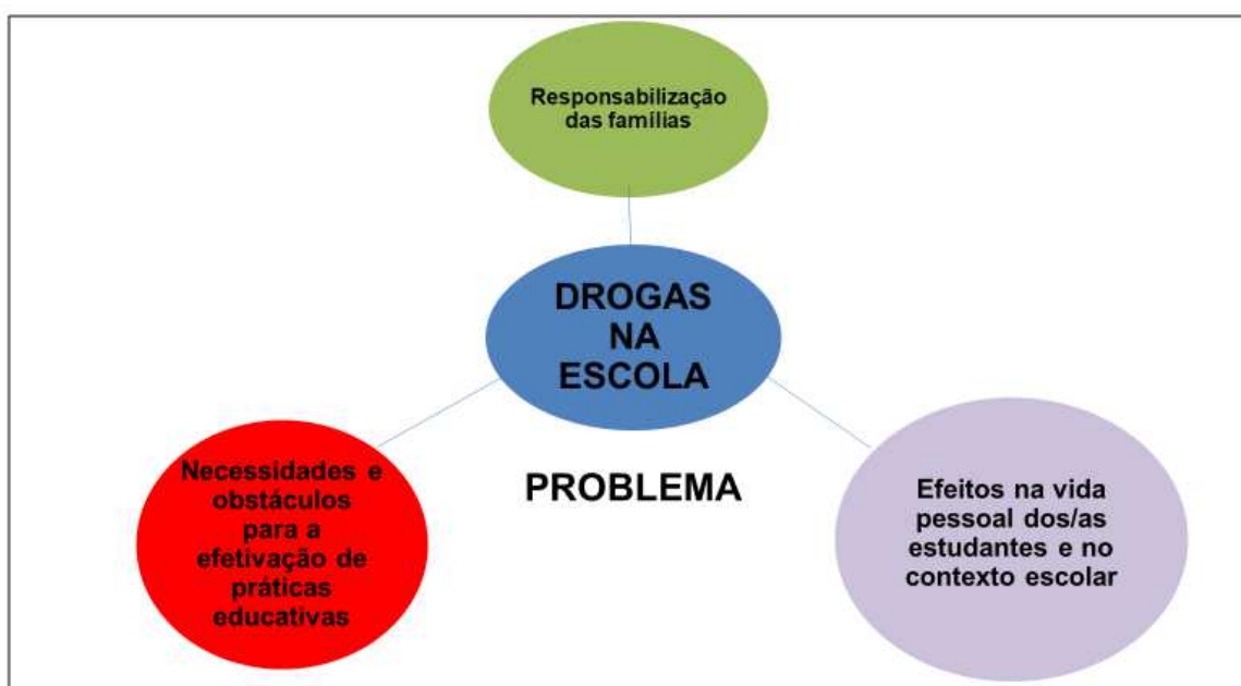
Figura 2. Drogas no contexto da Rede Estadual de Ensino em Campina Grande/PB