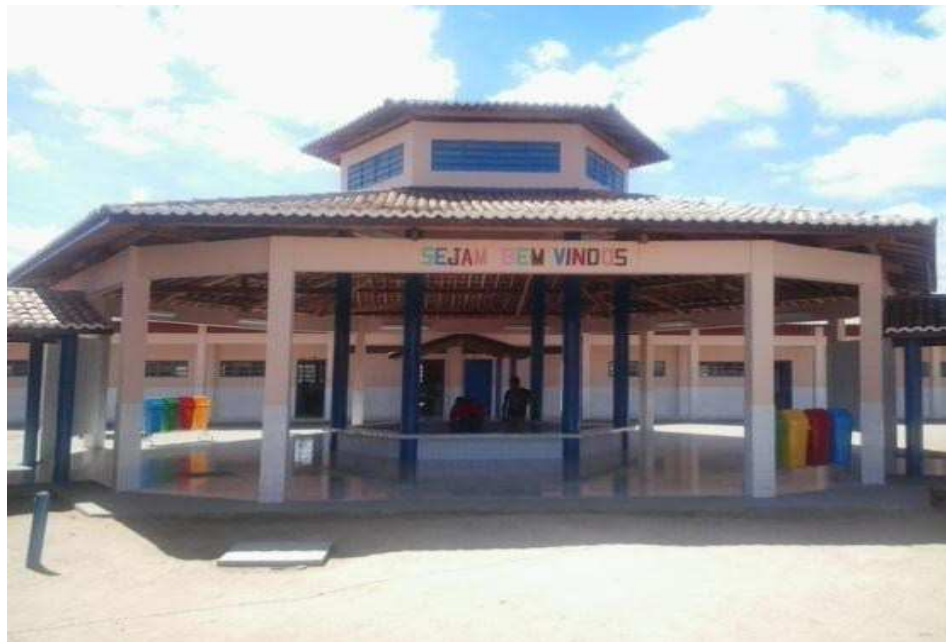
Figura 1 - Escola José Bonifácio Barbosa de Andrade

A Unidade de Ensino Infantil e Fundamental I e II José Bonifácio Barbosa de Andrade está localizada no Distrito de Pio X, zona rural do município de Sumé-PB. A unidade escola funciona apenas no turno da manhã e tarde, atendendo alunos do Ensino Infantil e do Ensino Fundamental I e II filhos de pequenos agricultores que residem nas comunidades vizinhas. A escola funciona dois dias por semana no turno da tarde, onde funciona o programa Novo Mais Educação 2 .