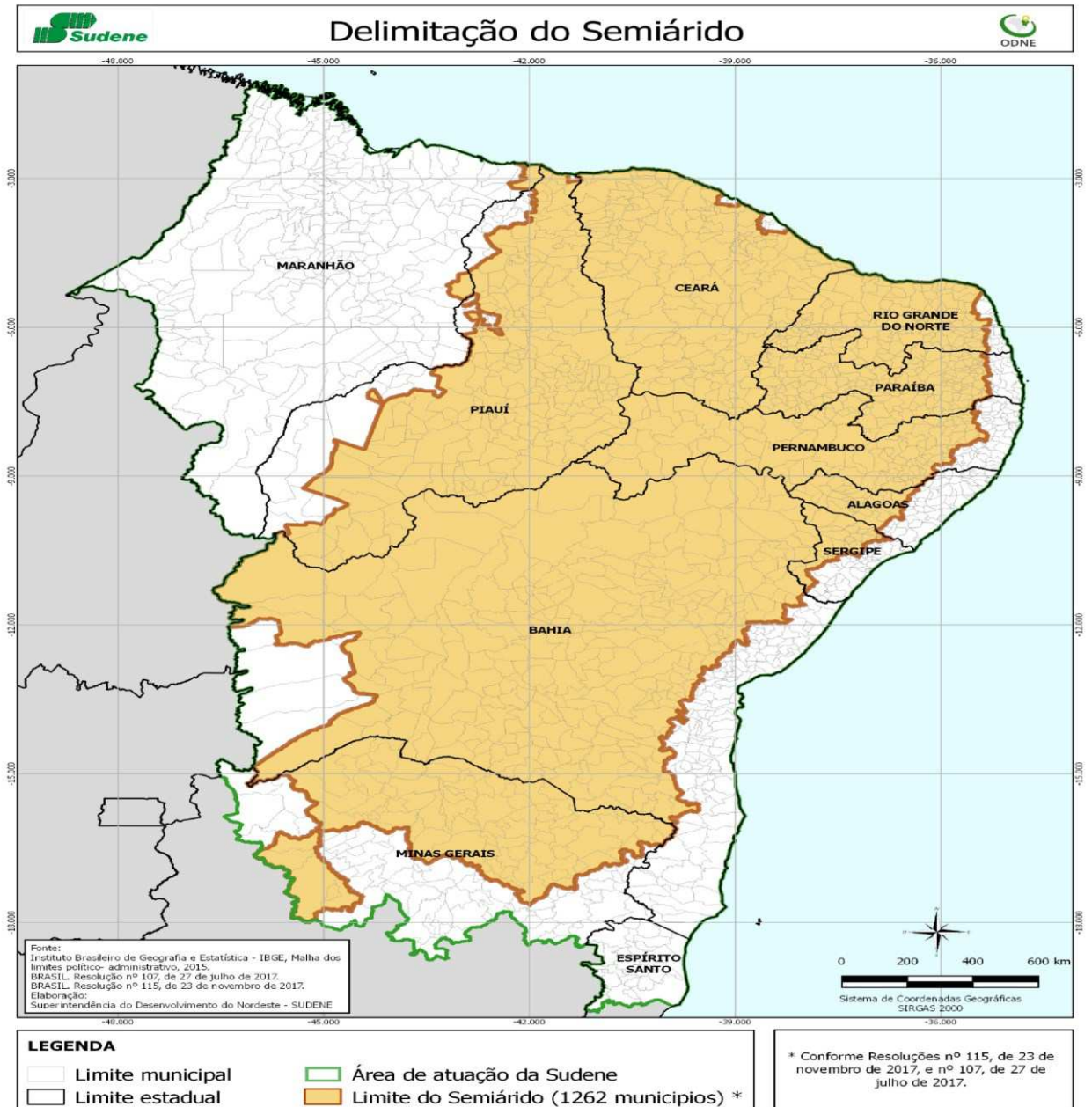
Mapa 1 - Delimitação do Semiárido Brasileiro

Como podemos verificar o Semiárido abrange grande parte do território brasileiro atingindo toda a Região Nordeste e até mesmo Estado de outra região, como é o caso de Minas Gerais. Como podemos observar no mapa abaixo a delimitação do Semiárido: