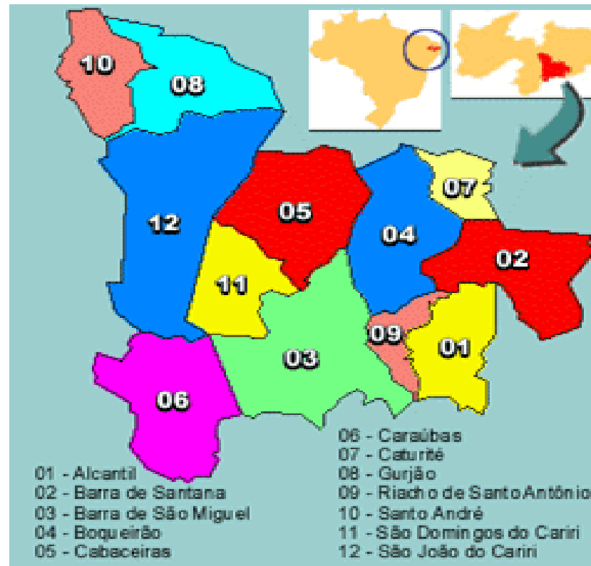
Mapa 3 - O território do Cariri Oriental

econômica do município de Campina Grande. Agora vejamos, a figura abaixo, do território do Cariri Oriental.