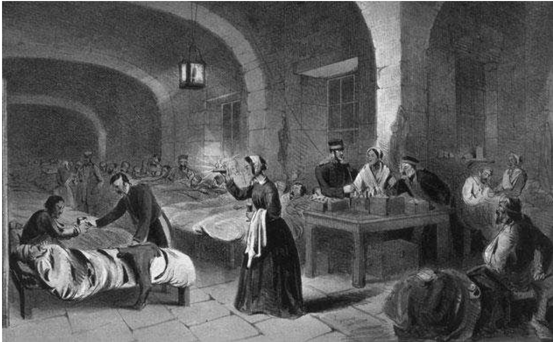
IMAGEM 3 - Ilustração de Nightingale, a dama da lâmpada, durante as visitas aos pacientes no turno da noite.