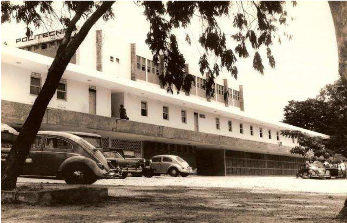
IMAGEM 6 - Escola Politécnica em Campina Grande.