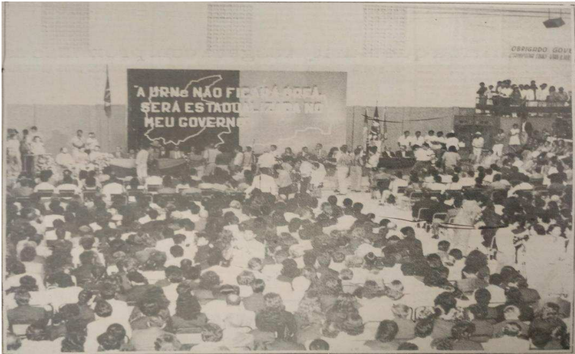
IMAGEM 5 - Reunião de debates para estadualização da URNe.