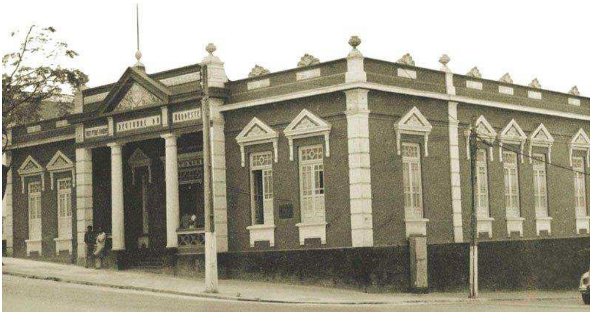
IMAGEM 7 - Prédio localizado no Centro de Campina Grande, que abriga o Museu Assis Chateaubriand, a sede da FURNe, e posteriormente a Reitoria da URNe.

Nesse período, o prédio no qual anteriormente funcionava o Grupo Escolar Solon de Lucena 30 passou a ser utilizado pela FURNe, tornando-se a sua sede definitiva. Ainda nesse ano de 1967 a Fundação promoveu a criação do Museu Assis Chateaubriand 31 que funcionaria no mesmo prédio, o qual também seria sede da Reitoria da URNe após sua criação.