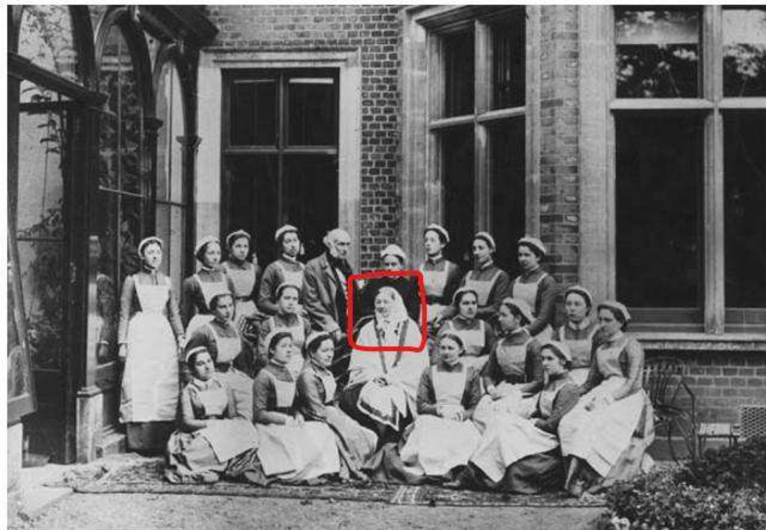
IMAGEM 4 - Florence Nightingale já idosa com sua turma de enfermeiras da Escola de Enfermagem.

É interessante notar que havia uma padronização nas vestimentas utilizadas pelas alunas, e provavelmente pela própria Nightingale, visto que era considerada o modelo a ser seguido. A meu ver esse tipo de traje contendo o gorro e o avental como instrumentos de proteção, estava imbuído das representações atribuídas a mulher que desempenhava suas funções na ambiência de casa. Para a época esse tipo de vestimenta poderia ser tratado como “normal”, porém as significações representativas não são deixadas de lado quando utilizadas.