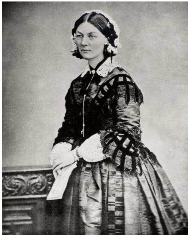
IMAGEM 1 - Florence Nightingale já como enfermeira durante a guerra na Criméia.