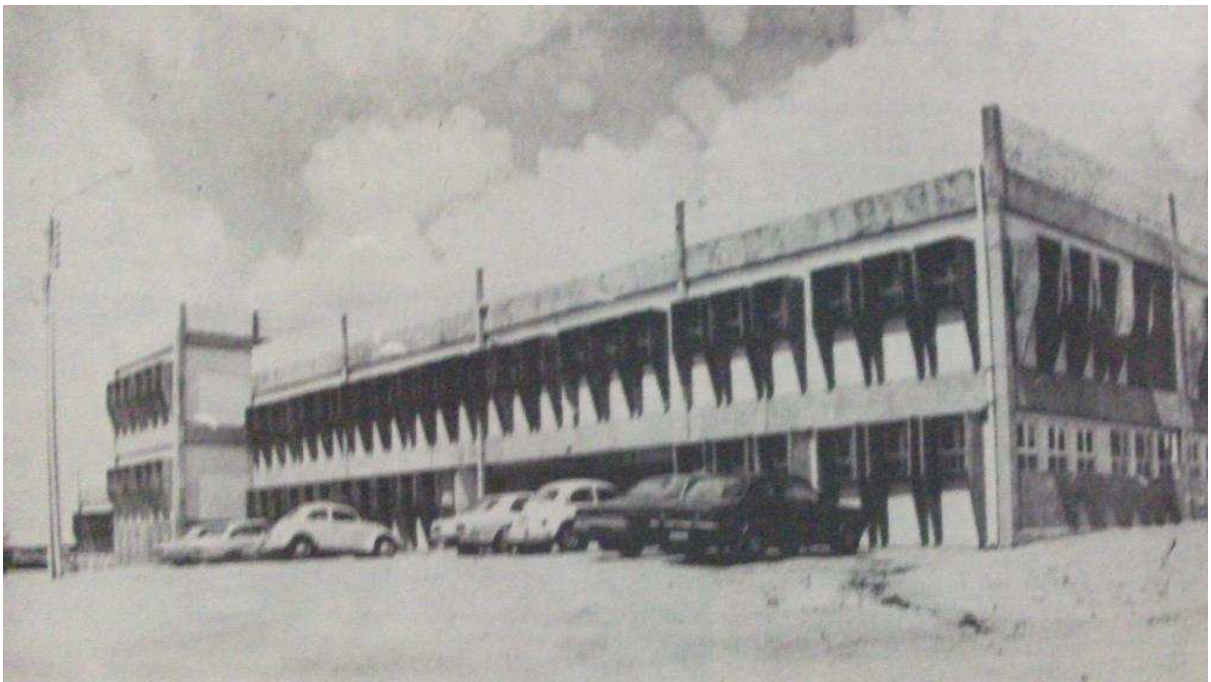
IMAGEM 8 - Prédio construído para funcionamento dos cursos da URNe.