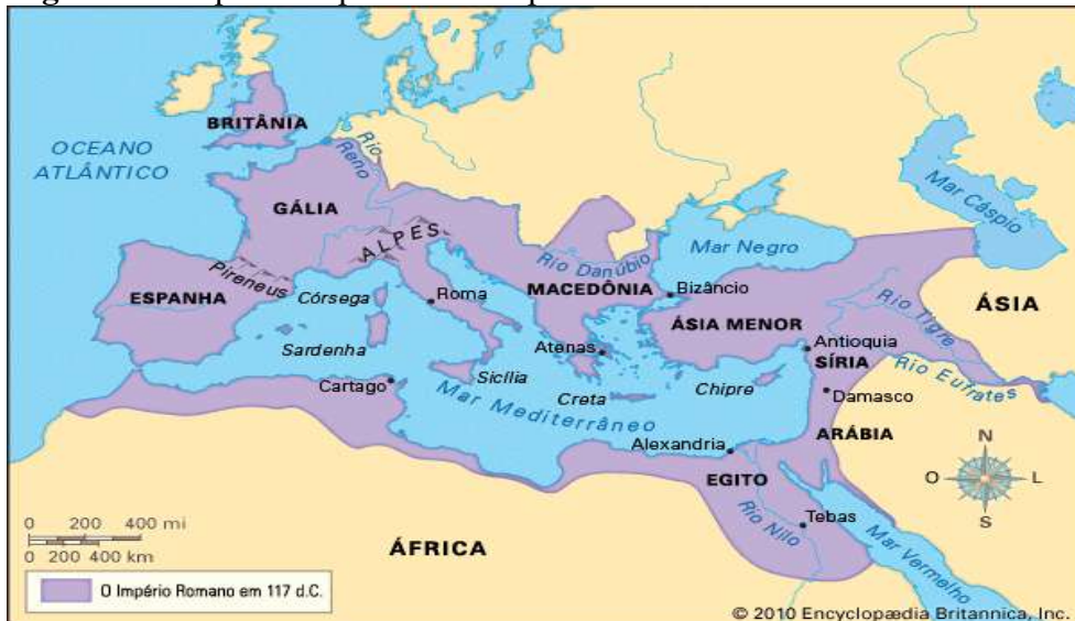
Figura 3 - Mapa de Expansão do Império Romano

Todas as vitórias, conquistas e expansões territoriais se deram depois da derrota de Cartago, nas Guerras Púnicas (264-146 a.C.). Aconteceu uma grandiosa expansão romana no território do Mediterrâneo e em toda a Europa, possibilitando a criação do maior império, o romano. Por meio do mapa (Figura 3), observamos a expansão e conquistas do Império Romano.