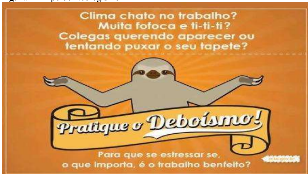
Figura 2 - Tipo de Neologismo

Leia este cartaz criado para uma campanha do Ministério do Trabalho, que circulou nas redes sociais em 2015: