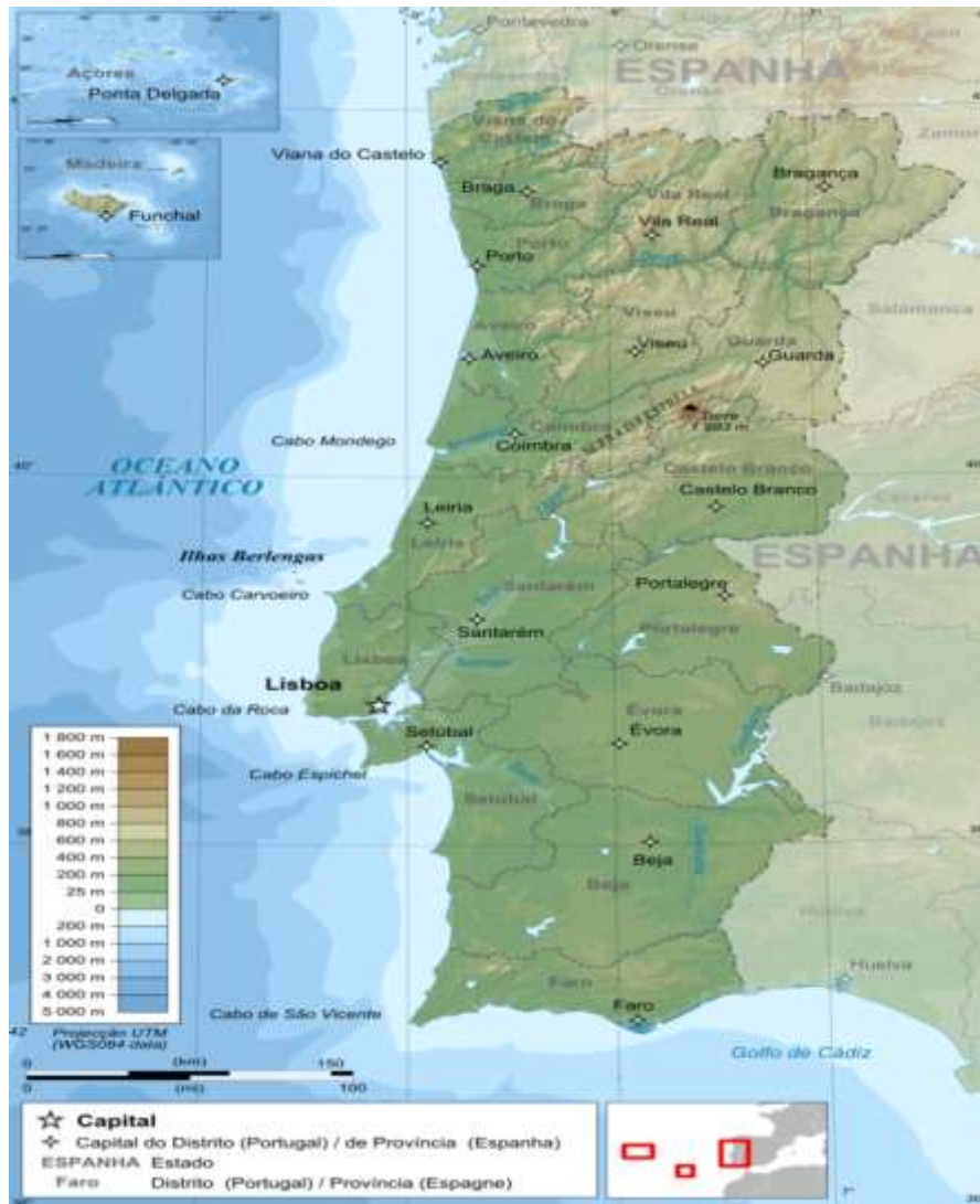
Figura 8 - Mapa do Território Português