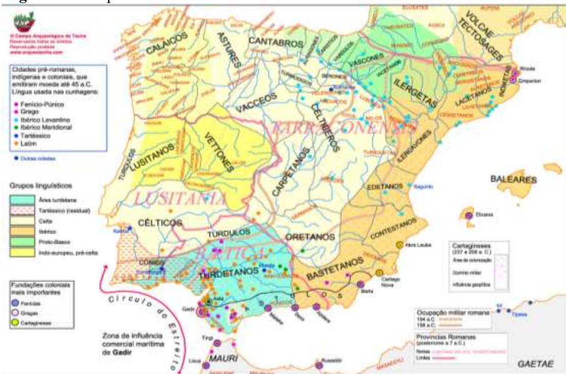
Figura 11 - Mapa do Latim falado na Península Ibérica

Abaixo, mapa (Figura 11) referente aos povos pré-românicos da Península Ibérica – antes da chegada do latim.