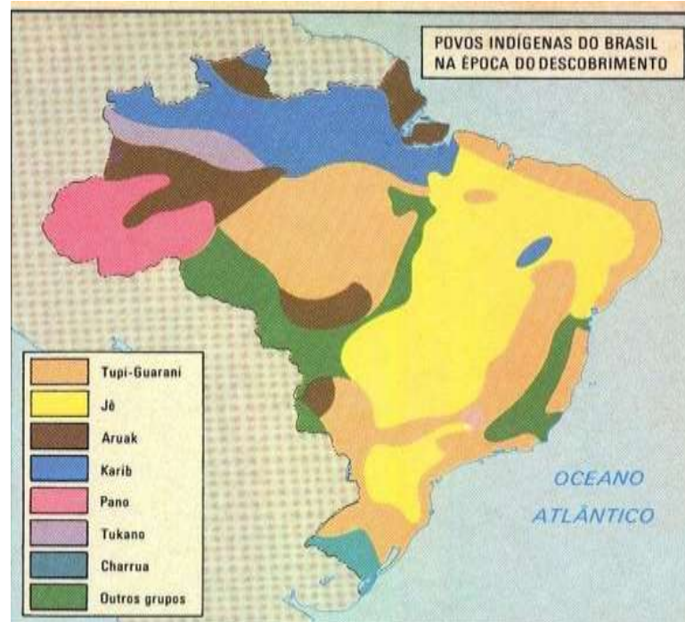
Figura 10 - Mapa dos povos indígenas do Brasil na época do descobrimento

Ao entrarem em contato com as terras brasileiras, por volta de 1500, os portugueses encontraram aqui os povos nativos que já habitavam o novo território conquistado, os índios – que já traziam consigo seus costumes, sua cultura, suas crenças e tradição e como idioma vários dialetos próprios. A partir daí, a Língua Portuguesa se difundiu e se incorporou às línguas que existiam no território brasileiro – iniciava-se a colonização do novo território. Entre os povos indígenas encontrados no Brasil, nesse período de descobrimento, destacamos: o Tupi-Guarani, o Jê e outros que mostraremos por meio do mapa a seguir (Figura 10).