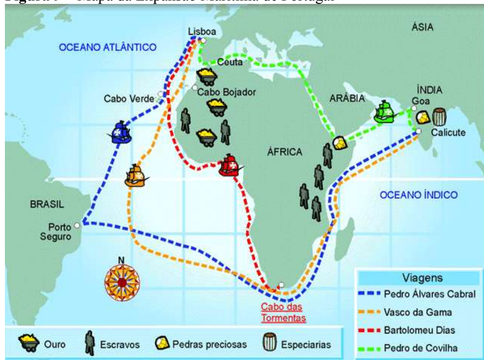
Figura 9 – Mapa da Expansão Marítima de Portugal

Entre os séculos XV e XVI, Portugal encontrava-se consolidado político e economicamente independente, tendo como língua oficial o Português, é impulsionado pelo desejo de expandir o território. Com isso, inicia por meio do processo de navegação marítima, a conquista de novas terras para difundir seus costumes, crenças e idioma – essa missão ficou a encargo dos jesuítas que vieram com o intuito de catequizar os povos dominados. A seguir, mostraremos o mapa da expansão de Portugal através dos mares.