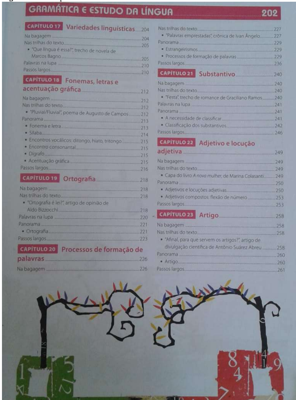
Figura 18 - Do capítulo 17 ao 23