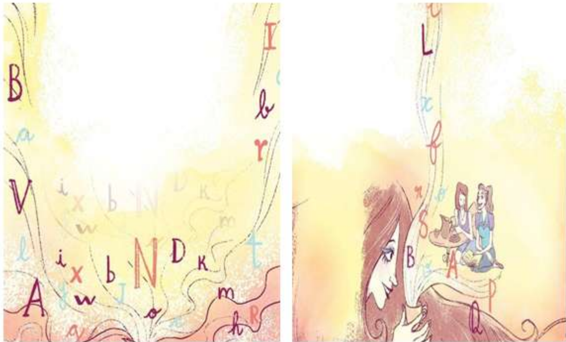
Figura 21 - A língua de Eulália , “ novela sociolinguística ” de Marcos Bagno

Fonte: Sette et al. (2016, p. 204, 206-207).