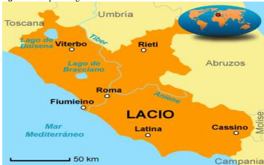
Figura 2 - Mapa da região do Lácio