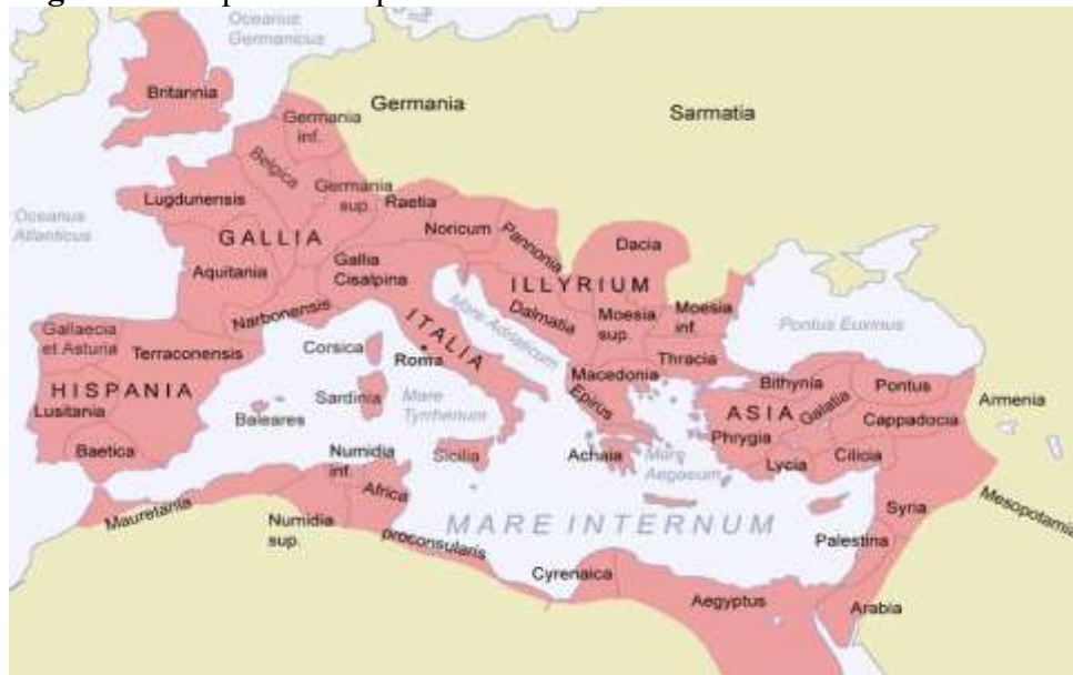
Figura 4 - Mapa da Conquista romana na Península Itálica