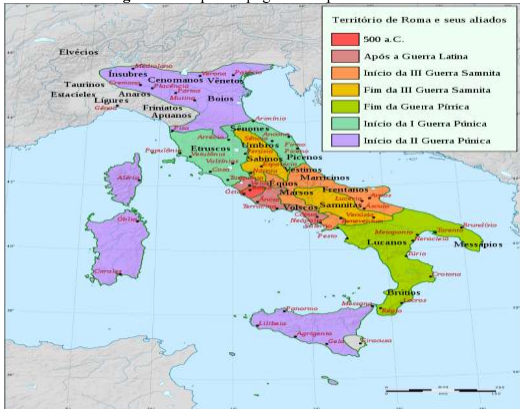
Figura 5 - Mapa do apogeu do Império Romano