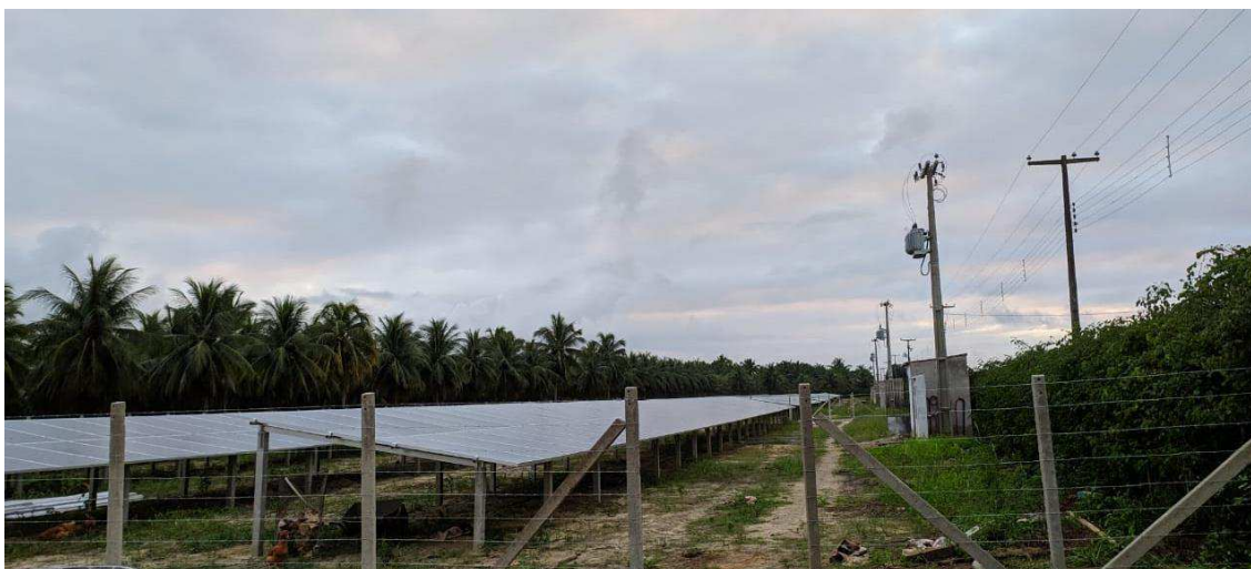
Figura 4 – Vista da instalação visitada em Mataraca-PB.

A geração foi separada em 4 conjuntos de 400 placas cada. Cada conjunto precisou de uma subestações de 112,5 kVA, totalizando 4 subestações, como pode se notar com mais detalhes na Figura 5, e também na Figura 4. As subestações foram projetadas e executadas pela empresa WA Engenharia.