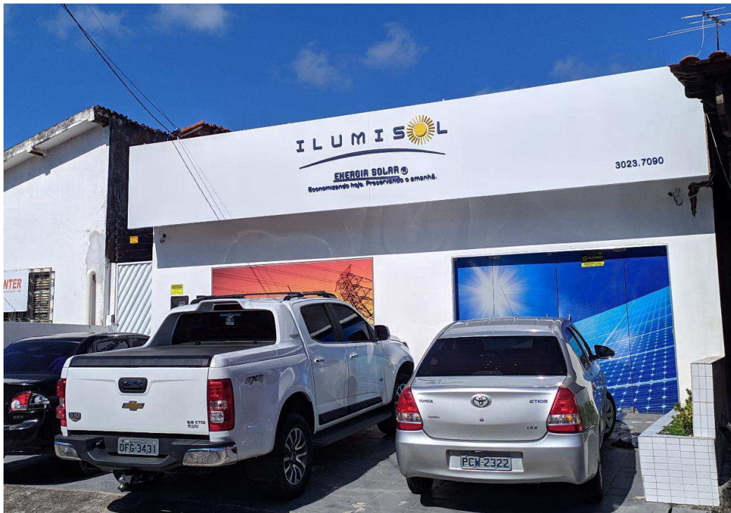
Figura 1 – Fachada ILUMISOL João Pessoa.