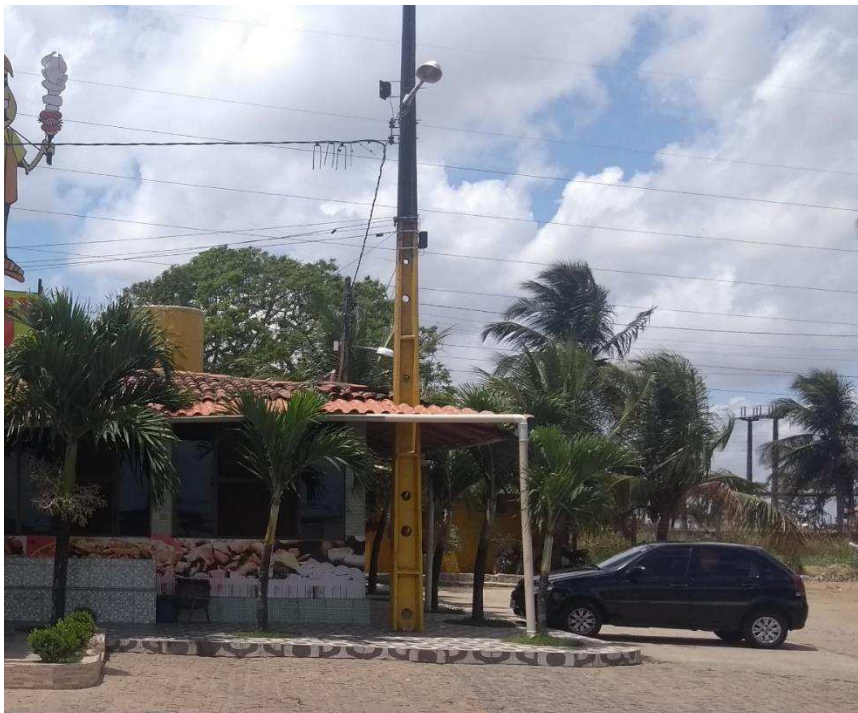
Figura 6 – Fachada do restaurante com poste da Energisa.

O primeiro caso de dificuldade encontrado durante o estágio foi o restaurante localizado no Conde. O projeto do restaurante conta com dois inversores da marca Fronius. O primeiro é o modelo ECO 27.0-3-S, que é um inversor trifásico de 27 kW. O segundo inversor utilizado foi o modelo PRIMO 8.2-1, que é monofásico com uma potência nominal de 8,2 kW. No projeto ainda se tem 128 módulos fotovoltaicos da marca Canadian, modelo CS6U-330P, que possuem uma potência de 330 W e uma área de aproximadamente 2 m 2 .