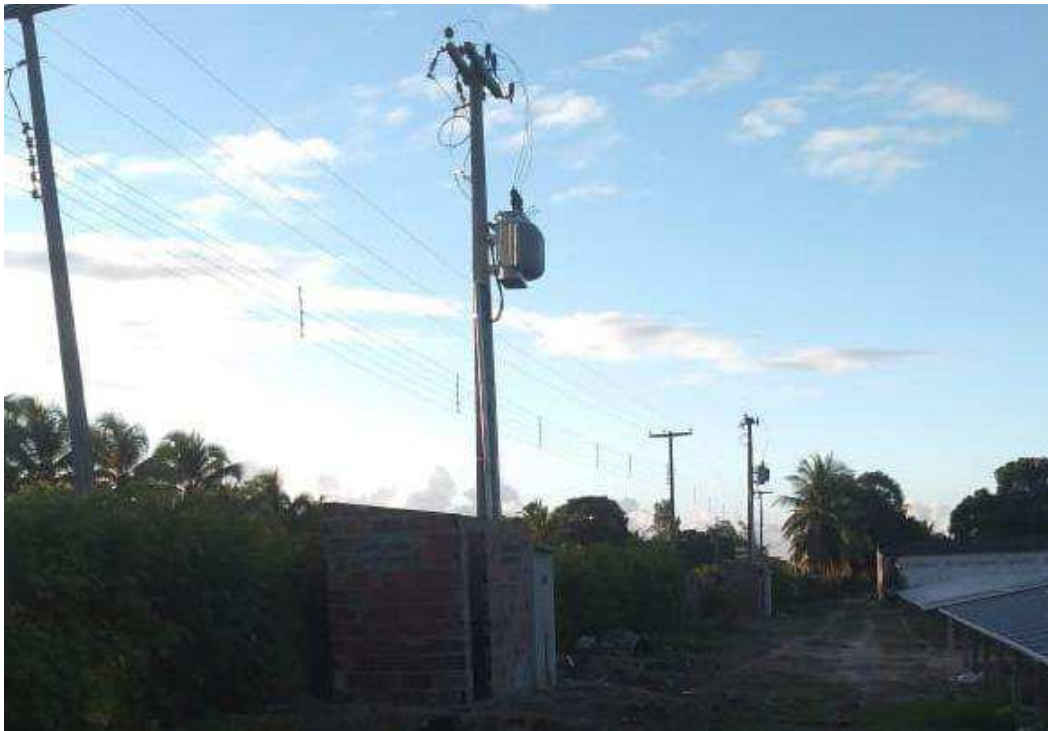
Figura 5 – Subestação na usina geradora em Mataraca-PB

A visita teve o intuito de vistoriar a obra, sanando possíveis dúvidas dos instaladores e do eletricitista presentes no local, observando os equipamentos instalados, se tudo estava conforme os padrões do projeto.